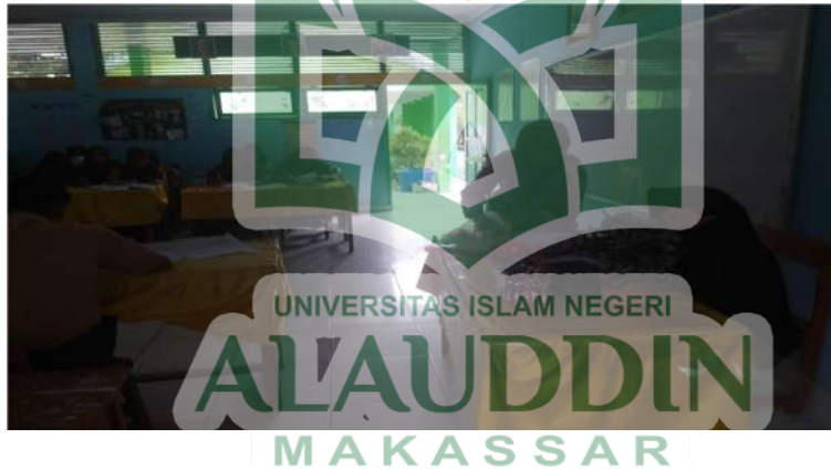
Dokumentasi Guru Al-Qur'an Hadis Pengisian Angket pada Tanggal 10, Februari 2023