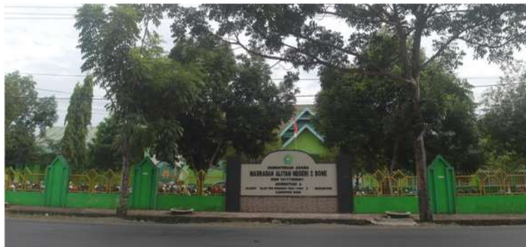
Dokumentasi Lokasi MAN 2 Bone pada Tanggal 10, Februari 2023