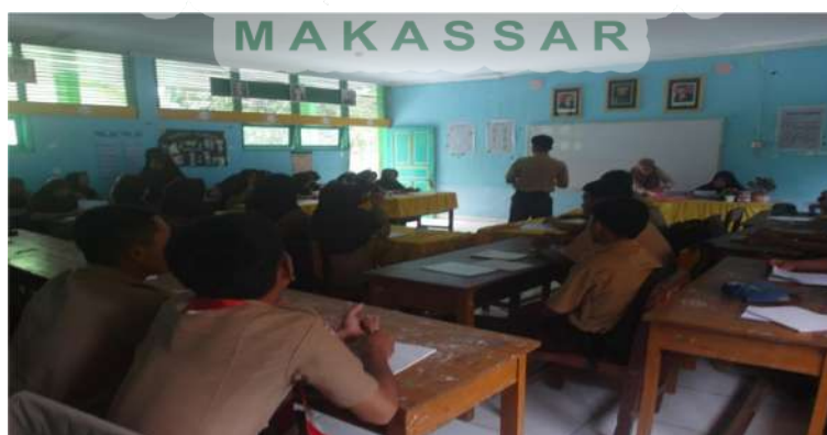
Dokumentasi aktivitas pembelajaran kelas X MIPA 1, pada Tanggal 10, Februari 2023