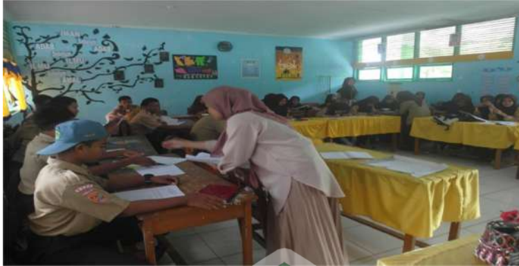
Dokumentasi Pembagian Agket Kelas X MIPA 1, pada Tanggal 10, Februari 2023