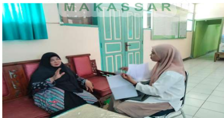
Dokumentasi Guru Al-Qur'an Hadis Pengisian Angket pada Tanggal 11, Februari 2023