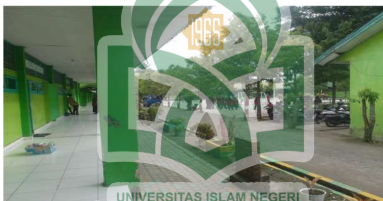
Dokumentasi Lapangan Sekolah MAN 2 Bone pada Tanggal 10, Februari 2023