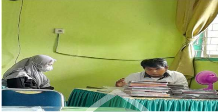
Dokumentasi Guru Al-Qur'an Hadis Pengisian Angket pada Tanggal 21, Februari 2023