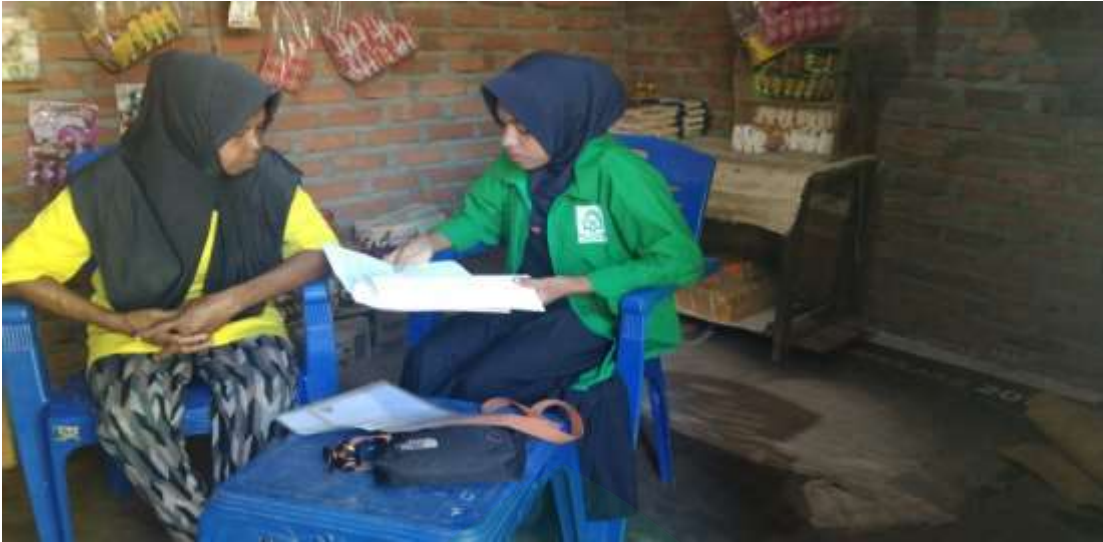
Wawancara oelang tua di dusun 4 (Trikora)