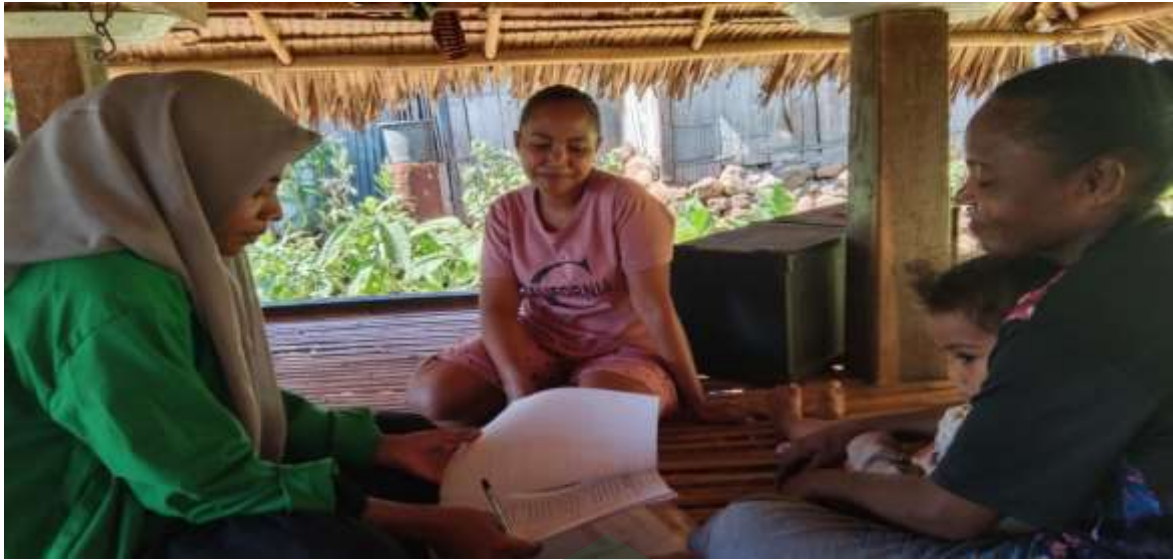
Wawancara Orang Tua Anak Di Dusun 1 (Roda Tolang)