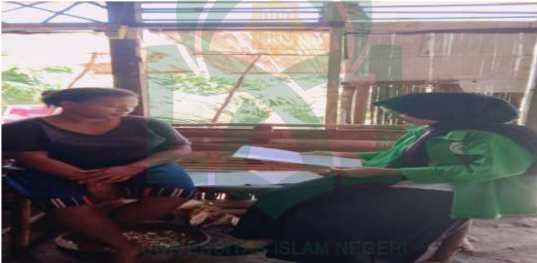
Wawancara oelang tua di dusun 4 (Trikora)