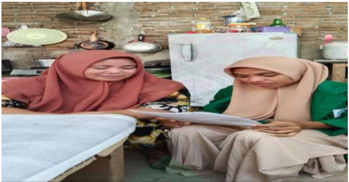
Wawancara Orang Tua Anak Di Dusun 1 (Roda Tolang)