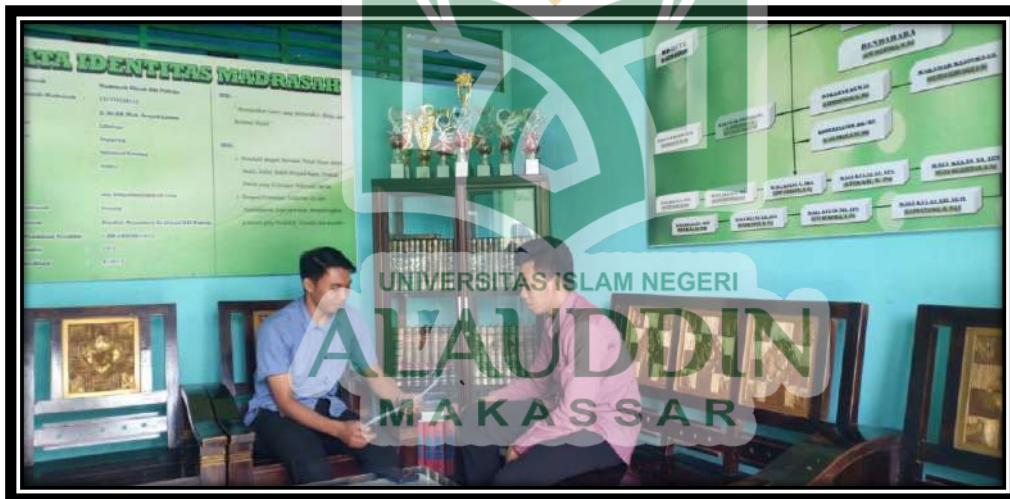
Dokumentasi Wawancara Guru Bahasa Arab Madrasah Tsanawiyah