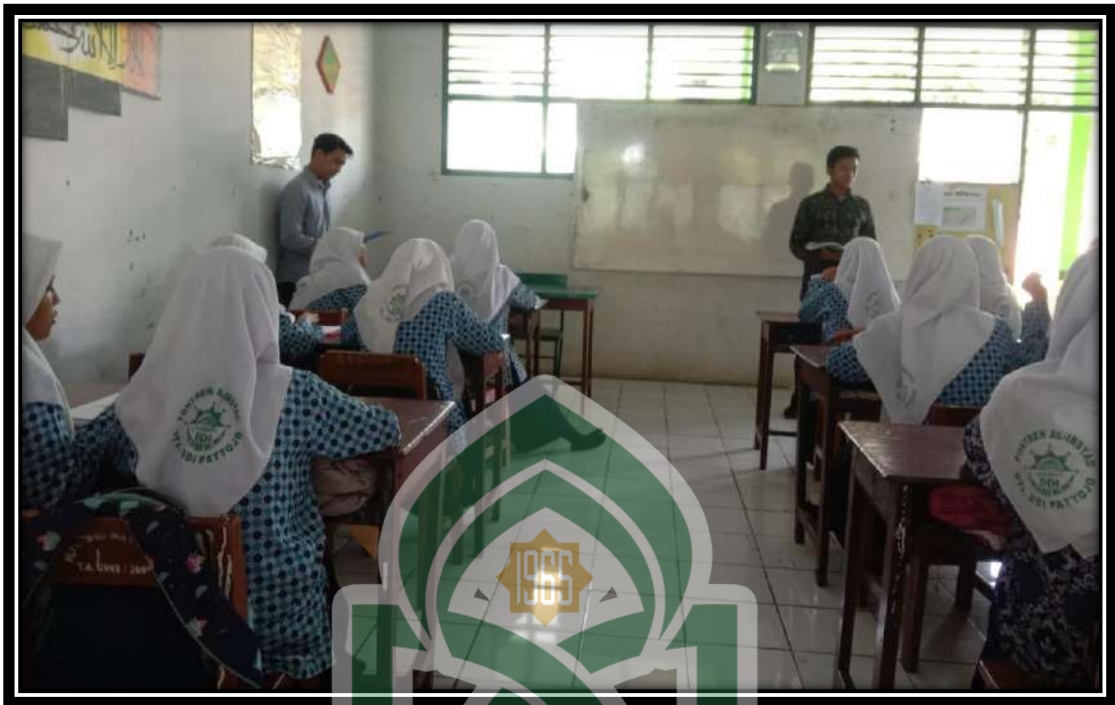
Dokumentasi Obesevasi di Kelas