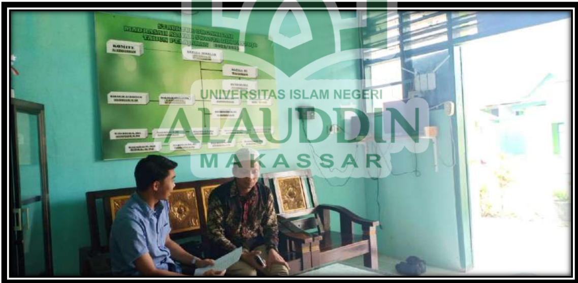
Dokumentasi Wawancara Guru Bahasa Arab Madrasah Aliyah