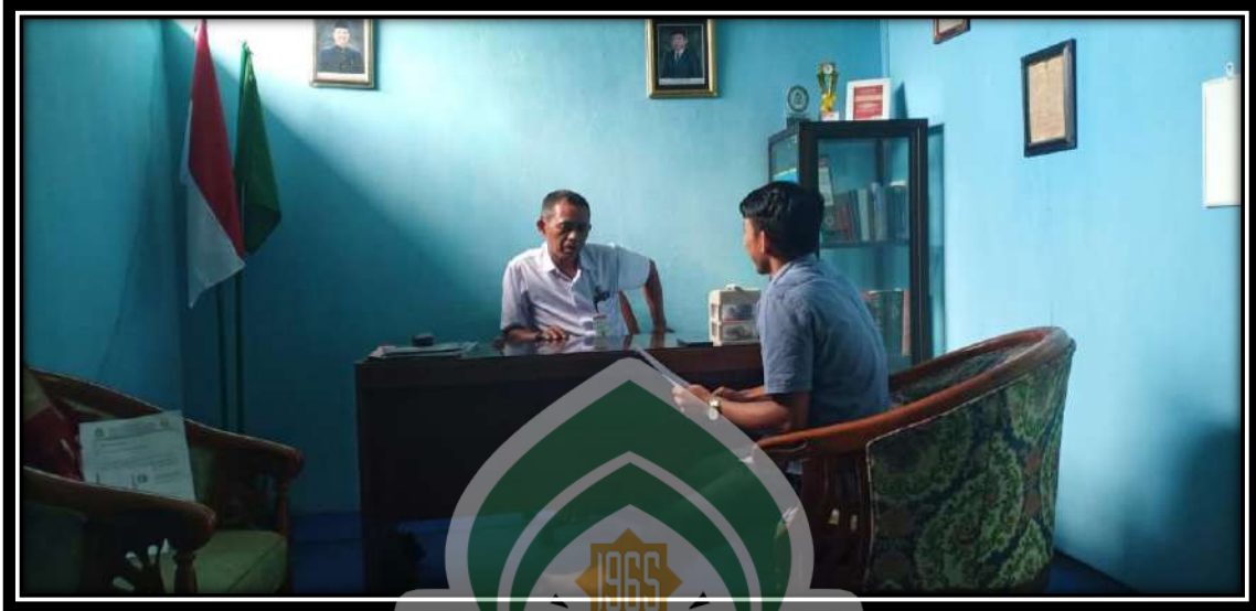
Dokumentasi Wawancara Kepala Madrasah Aliyah