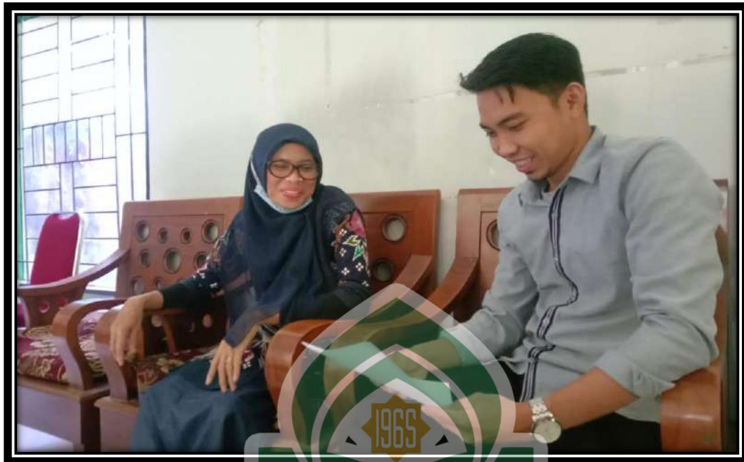
Dokumentasi Wawancara Kepala Madrasah Tsanawiyah