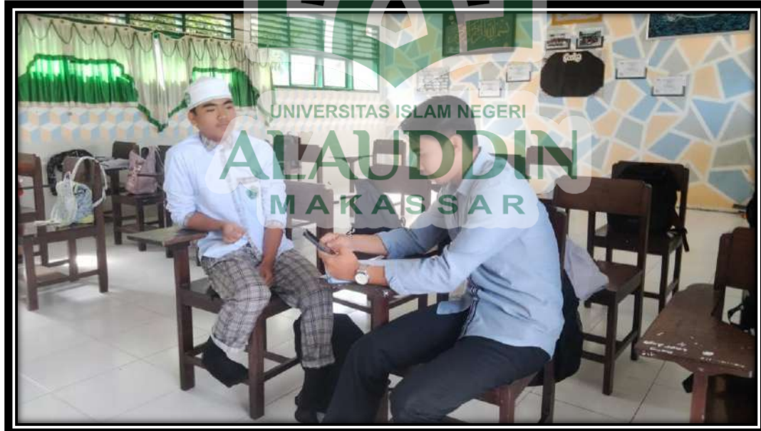
Dokumentasi Wawancara Peserta Didik