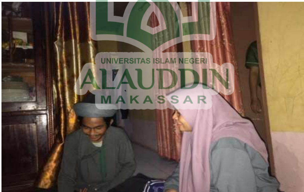
MR (21 tahun), Anggota Komunitas An-Nadzir Non Mukim, Wawancara di Kelurahan Romang Lompoa, pada Tanggal 08 Oktober 2022