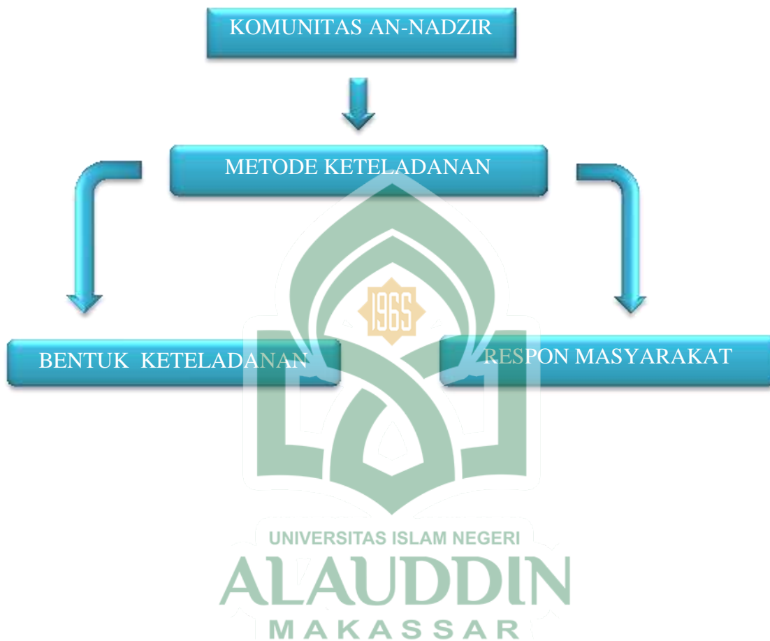
Gambar 2.1 Kerangka Pemikiran