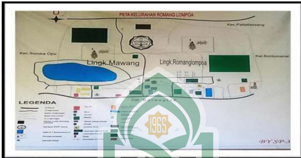
Gambar 4.1 Peta Kelurahan Romang Lompoa

Sumber Data: Profil Kelurahan Romang Lompoa 2022. 3