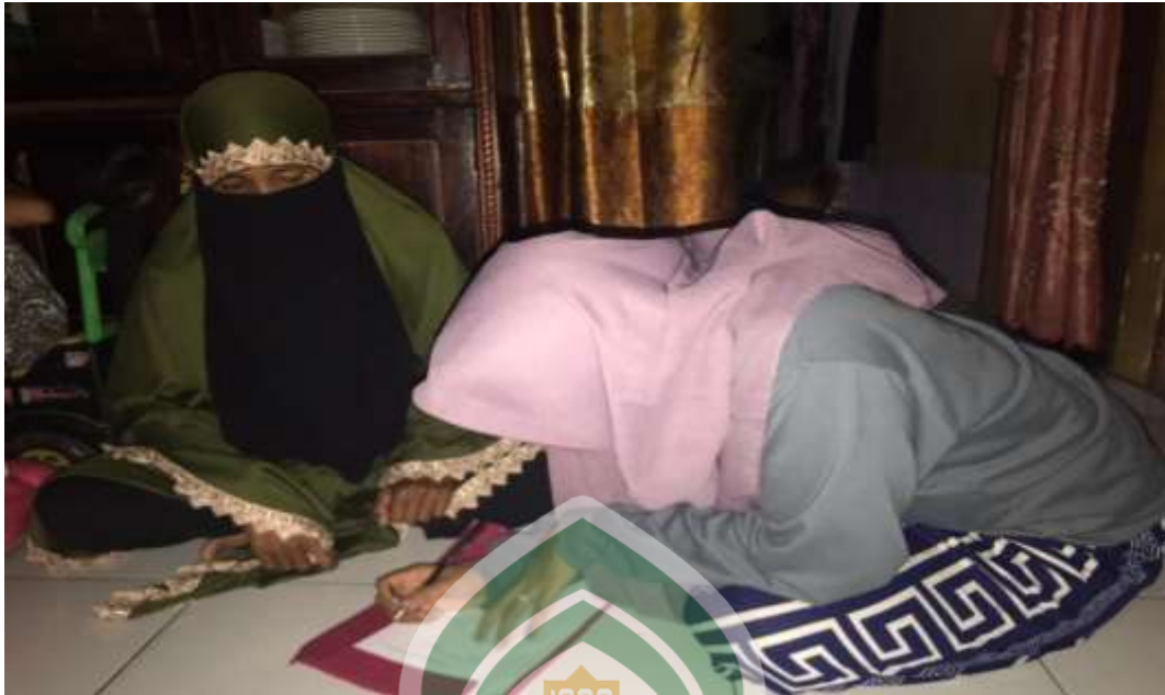
JR (37 tahun), Anggota Komunitas An-Nadzir Non Mukim, Wawancara di Kelurahan Romang Lompoa, pada Tanggal 08 Oktober 2022