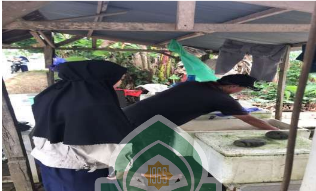
Foto Masyarakat dengan Anggota An-Nadzir saat Membeli Ikan Pada Tanggal 05 Oktober 2022