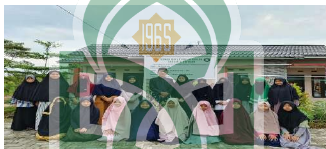
Gambar. 5 Rumah qur'an Gratis Untuk Ummat