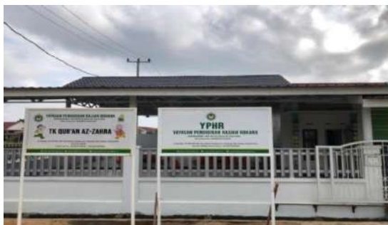
Gambar. 6 Yayasan Pendidikan Hajjah Rohana