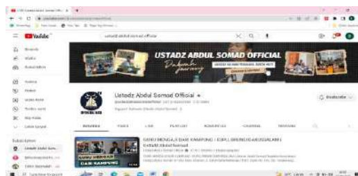
Gambar. 11 (Dalam Vidio) Ustadz Abdul Somad Official