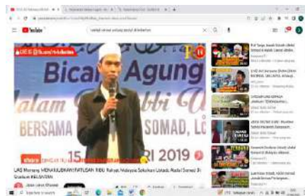
Gambar. 9 (Dalam Vidio) Tablig Akbar di Stadium Kelantan di Malaysia.