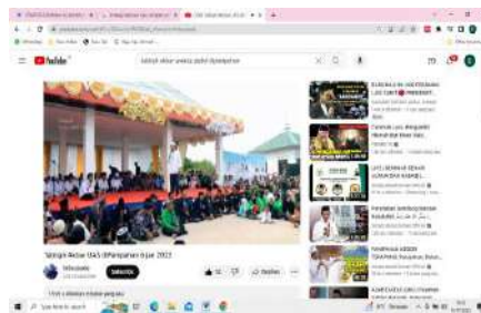
Gambar. 10 (Dalam Vidio) Tabligh Akbar Panipahan Rohil Riau