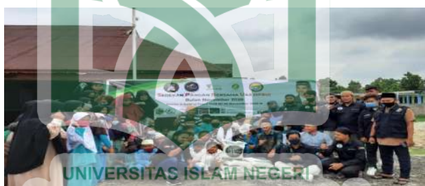
Gambar 4. Ustadz Abdul Somad Launching "SPBU" Bersama YTWU

Ingin berbuat lebih maksimal untuk umat dan perihatin dengan keadaan ekonomi sebagian besar masyarakat di Riau, Ustadz Abdul Somad bersama Yayasan Tabung Wakaf Umat menggagas gerakan bernama SPBU yang merupakan singkatan dari Sedekah Pangan Bersama UAS. Ketua Yayasan Tabung Wakaf Umat Ustadz Alnof Dinar mengatakan gerakan ini akan dilaksanakan