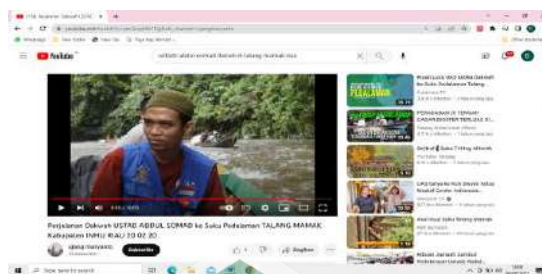
Gambar 3. (Dalam Vidio) Dakwah di Pedalaman Talang Mamak