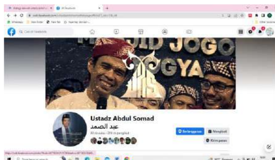
Gambar. 13 Ustadz Abdul Somad