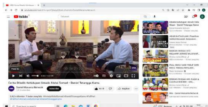
Gambar. 7 (Dalam Vidio) Dialog Ustadz Abdul Somad dalam Podcast