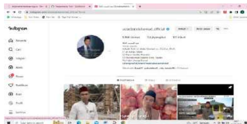
Gambar. 12 ustadzabdulsomad_official