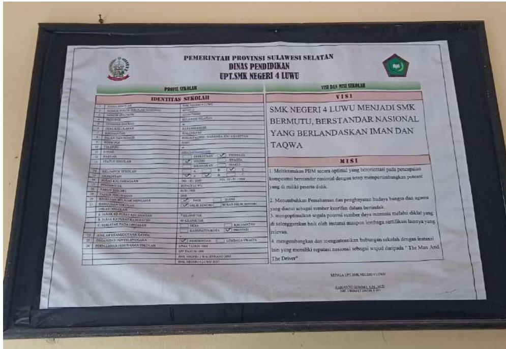
Profil sekolah dan visi misi sekolah