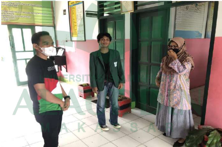
Foto Bersama pegawai SMP Negeri 3 Mattiribulu