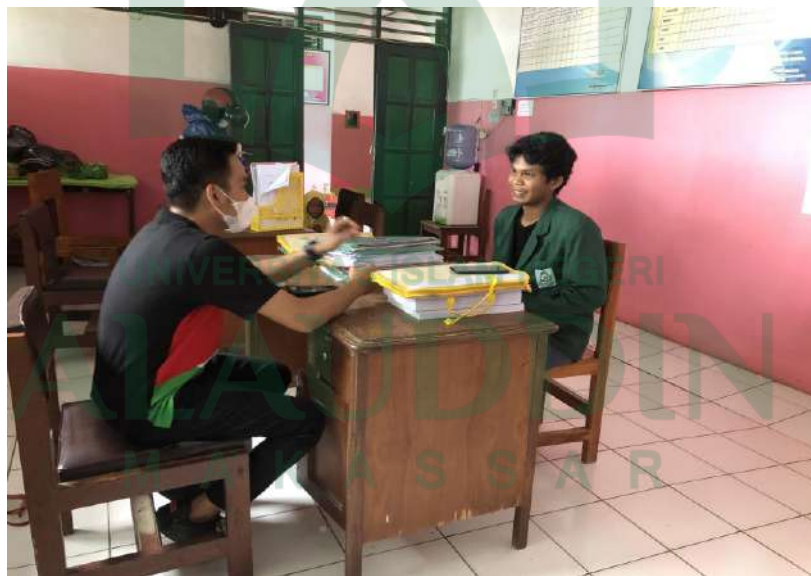
Meminta data sekolah SMP Negeri 3 Mattirobulu