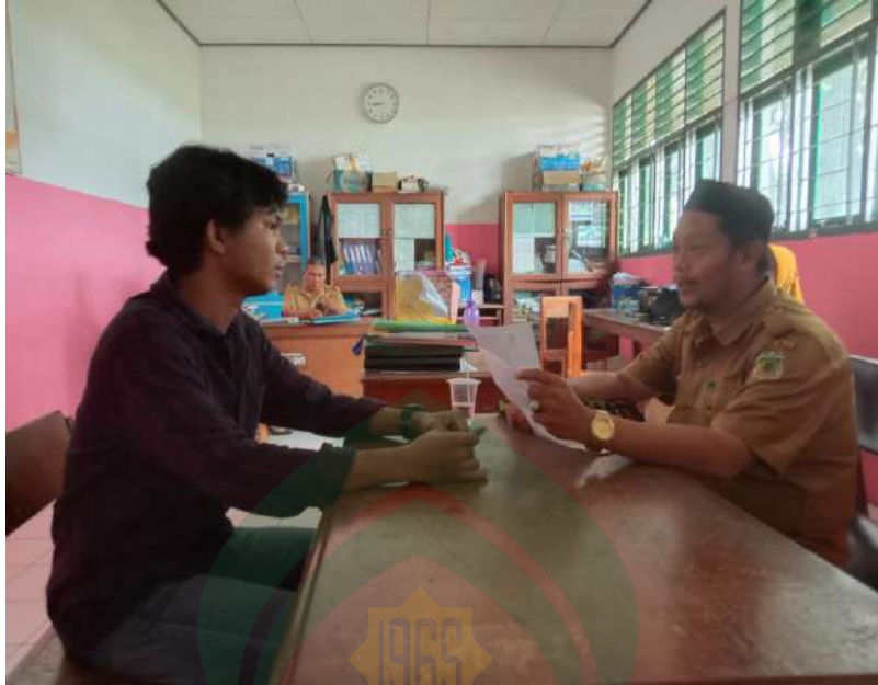
Wawancara dengan guru PAI SMP Negeri 3 Mattirobulu