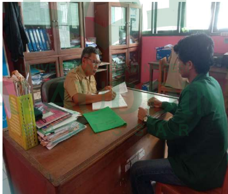
Memina izin kepada kepala sekolah untuk melakukan penelitian di SMP Negeri 3 Mattirobulu