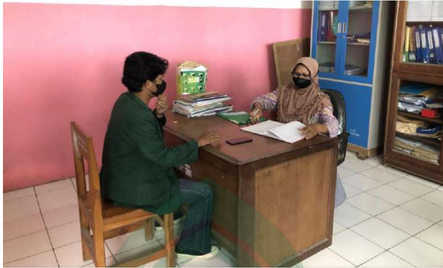
Meminta data sejarah berdirinya sekolah SMP Negeri 3 Mattirobulu