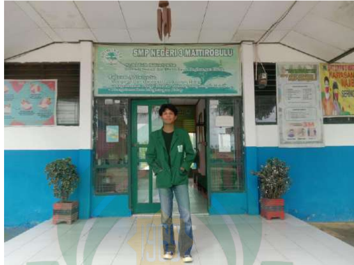
Foto depan pintu masuk SMP Negeri 3 Mattirobulu