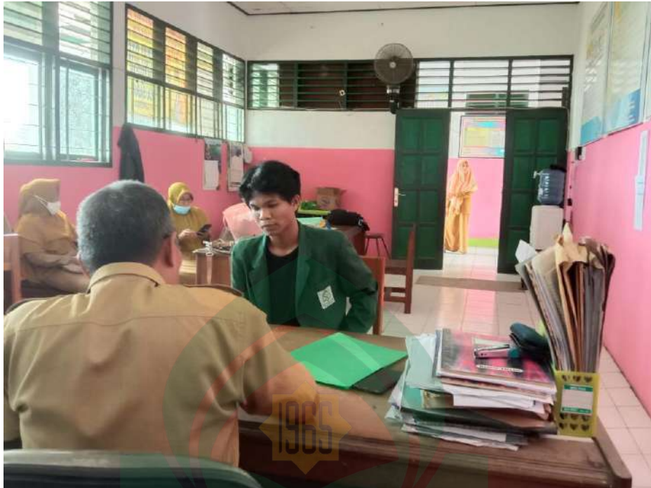
Berbingcang dengan guru PAI SMP Negeri 3 Mattirobulu