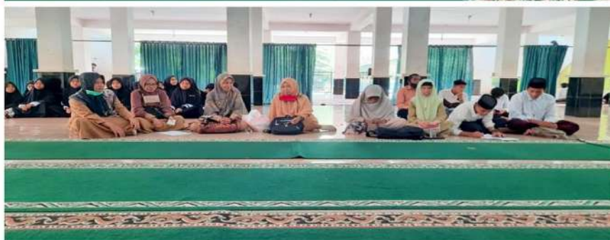
Pembinaan Tilawah Qori' dan Qori'ah Lembaga Pengembangan Tilawatil Qur'an Kota Bima, Wawancara, Mpunda Kota Bima, 14 November 2022