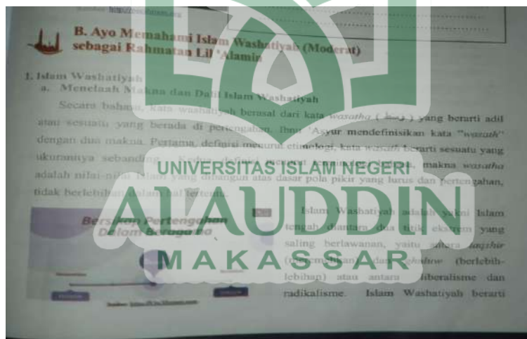
Gambar 4.3 Pembelajaran Akidah Akhlak

Moderasi beragama merupakan salah satu program dari kementerian agama. Tujuan moderasi beragama ini adalah bagaimana masyarakat khususnya Indonesia yang memiliki berbagai perbedaan mulai dari suku, adat, budaya dan agama sehingga dapat melahirkan sebuah masyarakat yang rukun. Maka dapat saya jelaskan pemberian materi yang berkaitan moderasi beragama pada pembelajaran akidah akhlak adalah bertujuan agar peserta didik dapat memahami tentang sebuah perbedaan khususnya dalam beragama, suku, adat dan budaya sehingga memiliki pemahaman tentang kerukunan dalam bermasyarakat dan berbangsa. 12