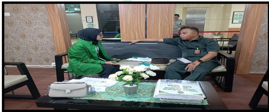
Gambar 5 Wawancara Dengan Hakim Ketua Pengadilan Negeri Makassar 11 juli 2023