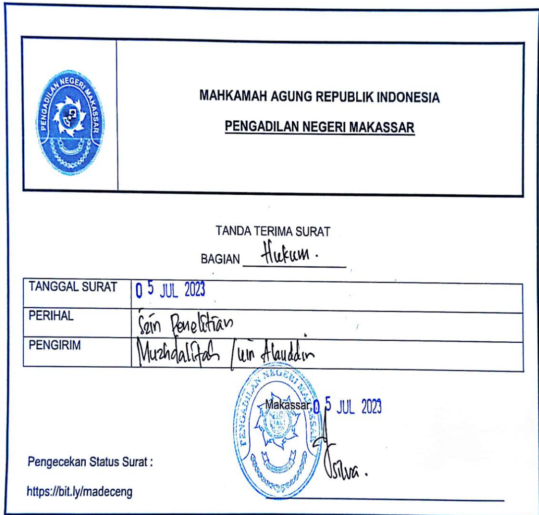
Gambar 4 Kartu Tanda Terima Surat Izin Penelitian oleh Pengadilan Negeri Makassar