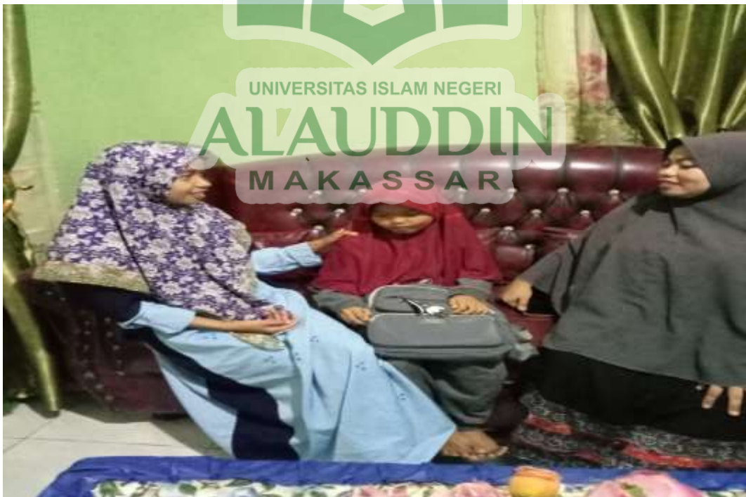
Dokumentasi setelah proses penanaman nilai-nilai pendidikan Islam