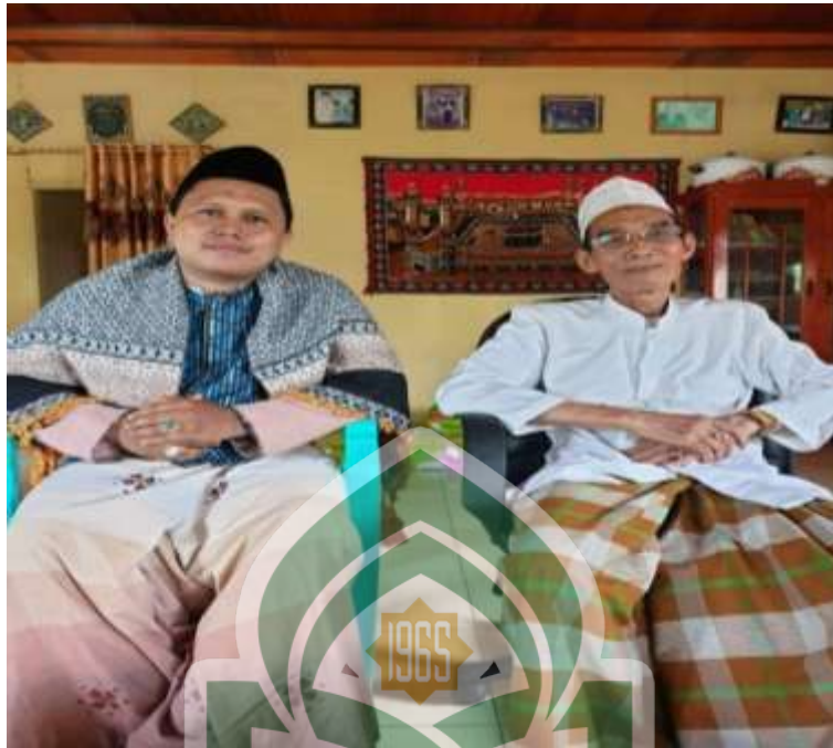
Gambar 3: Imam Desa Bonto Marannu dan Imam Dusun Tambua.