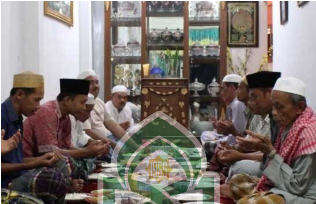
Gambar 5: Berdo'a bersama sebelum memakan hidangan yang disediakan.