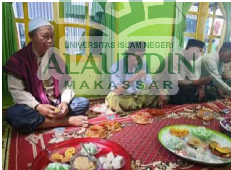
Gambar 4: Makan bersama masyarakat dalam Tradisi Ma' baca Pattingelle di Desa Bonto Marannu Kabupaten Maros.