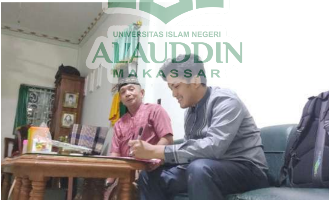
Gambar 6: Wawancara bersama Kepala Desa Bonto Marannu Kabupaten Maros tentang analisis Pesan Dakwah dalam Tradisi Ma'bacaa Pattingelle .