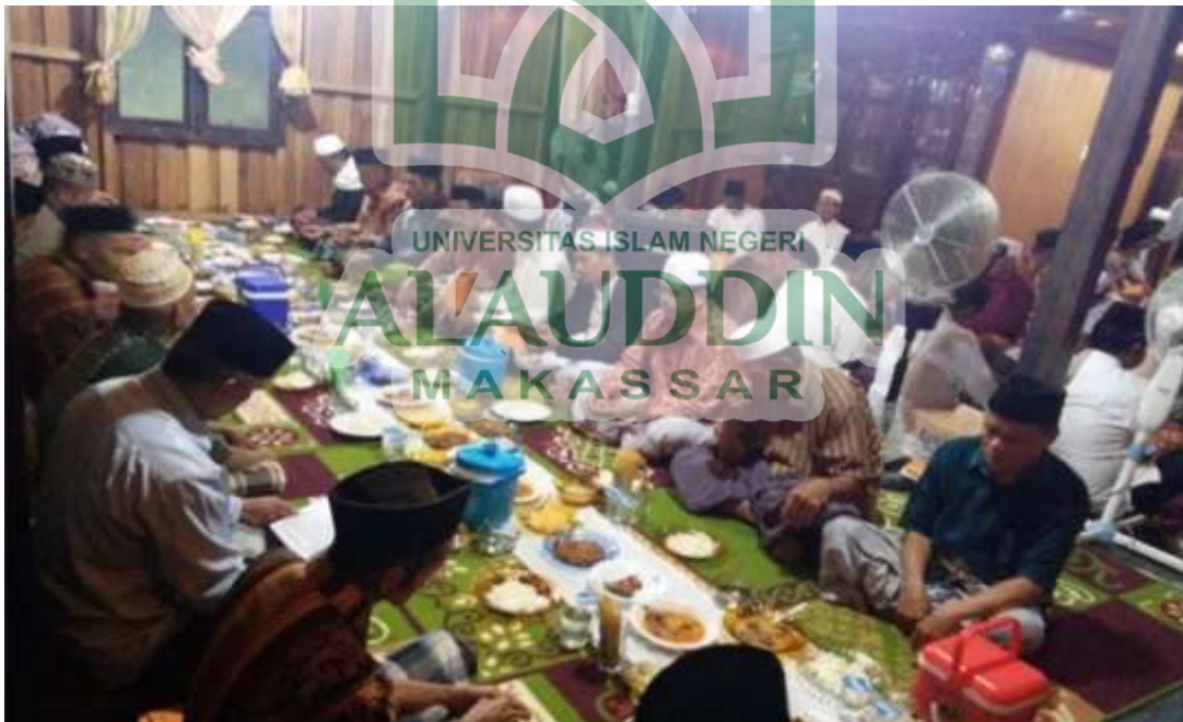
Gambar 2: Masyarakat Desa Bonto Marannu Kabupaten Maros berkumpul dan kemudian makan bersama setelah Imam membaca doa Tradisi Ma' baca Pattingelle .

Tahapan selanjutnya adalah makan bersama dengan para partisipan yang hadir pada pelaksanaan Tradisi Ma' baca Pattingelle tersebut, dalam hal ini adalah masyarakat warga Desa Bonto Marannu Kabupaten Maros. 22 Sebagaimana prosesi Tradisi Ma' baca Pattingelle di Desa Bonto Marannu Kabupaten Maros pada tahap makan bersama yang memberikan makna solidaritas karena tanpa melihat status dan jabatannya hakikatnya kita semua sama dimata Allah Swt. Sebagaimana contoh yang dapat di lihat pada Gambar berikut ini: