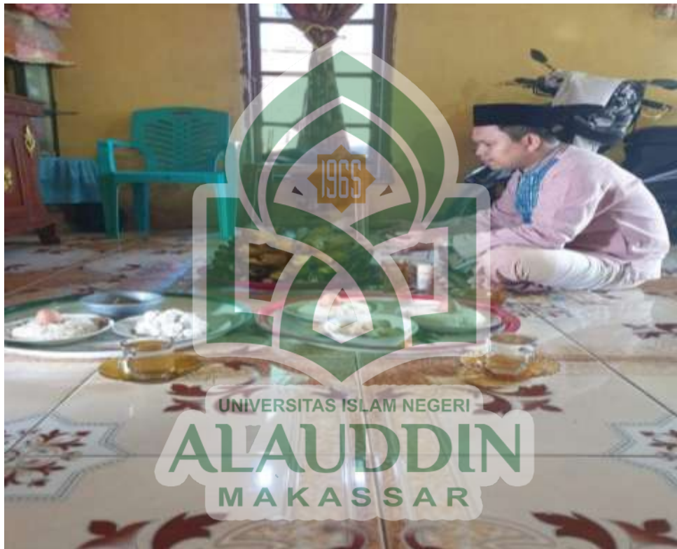
Gambar 1: Imam Dusun Tambua di Desa Bonto Marannu Kabupaten Maros Prosesi Tradisi Ma' baca Pattingelle .

ibadah sholat di masjid, seorang imam juga bertugas untuk melayani para jamaah yang datang memanggil atau meminta untuk didoakan dengan niat kesyukuran dan keselamatan kepada Allah Swt. Agar diberikan kemudahan dalam mewujudkan keinginan, memohon agar dapat terhindar dari segala bentuk musibah dan malapetaka. Salah satu contohnya dapat di lihat pada gambar berikut ini: