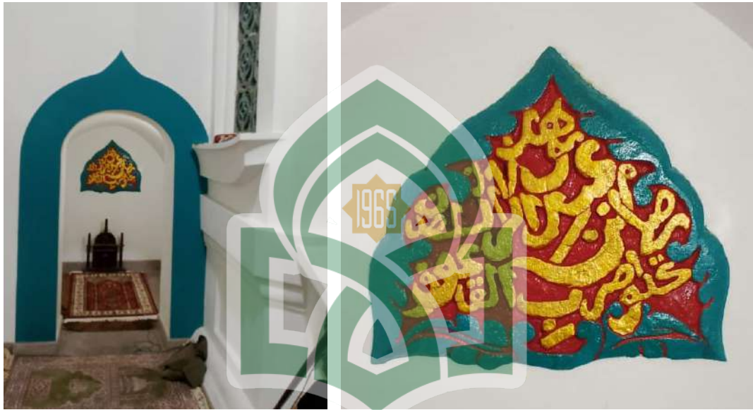
Gambar 1. Mihrab Masjid Tua Al-Hilal Katangka