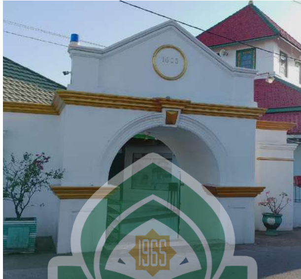
Gambar 7. Gerbang Utama Masjid

Gerbang utama masjid yang berbentuk seperti bangunan Eropa hal ini disebabkan karena adanya pencampuran budaya Kolonial-Belanda dengan Kerajaan Gowa. Gerbang utama masjid ini dibuat dari susunan batu merah yang tebal bergaya ciri khas bangunan kolonial, seperti pada bangunan Benteng Rotterdam. 35 Selain itu, warna dari gerbang masjid mengadopsi warna yang sering dipakai pada gaya arsitektur Kolonial Belanda, yaitu menggunakan warna putih nieuwe bouwen sebagai sarana ekspresi. Ornamen gawel pada gerbang tersebut mengadopsi ornamen Kolonial Belanda yang bervariasi pedivent .