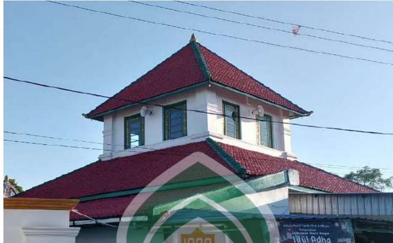
Gambar 9. Atap Masjid