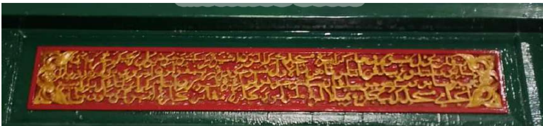
Gambar 3. Pintu Bagian Utara Masjid Tua Al-Hilal Katangka (Dokumentasi peneliti, 2023)