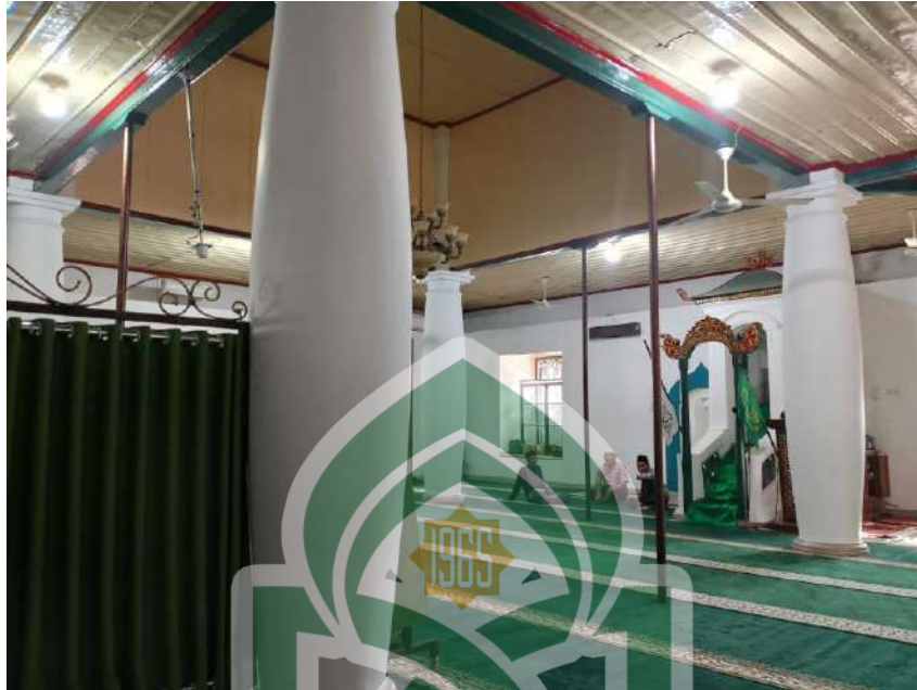
Gambar 8. Pilar atau Tiang Masjid

Tiang atau pilar di dalam masjid sebagai penyangga utama yang berfungsi untuk menopang atap pada bangunan masjid. Pilar ini terbagi menjadi dua, masing-masing berjumlah empat tiang yang bermakna jumlah khulafaurrasyidin . 36 Pilar berukuran besar terbuat dari material batu berplester semen dan mengadopsi bangunan dari kolonial Belanda yang bernuansa putih dan Yunani berbentuk order doric (menggelembung di tengah). Selain itu, terdapat pula empat tiang kecil berbentuk silinder yang terbuat dari baja untuk menopang balok plafon masjid.