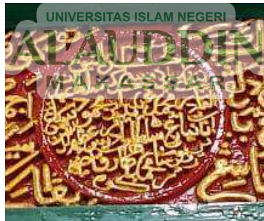
Gambar 5. Pintu Bagian Dalam Tengah Masjid Tua Al-Hilal Katangka

Selain itu, terdapat pula inskripsi lain pada bagian dalam inskripsi pintu bagian tengah yang dilingkari. Inskripsi tersebut berbunyi