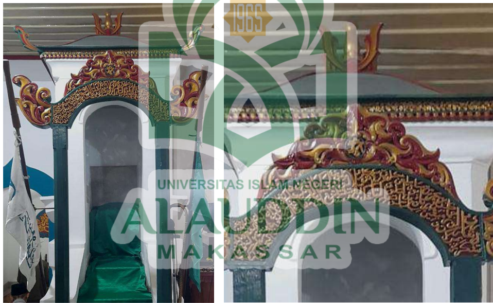
Gambar 2. Mimbar Masjid Tua Al-Hilal Katangka