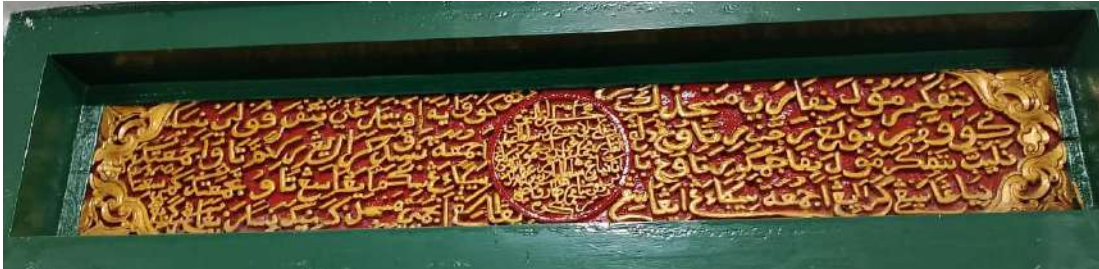
Gambar 4. Pintu Bagian Tengah Masjid Tua Al-Hilal Katangka

Inskripsi yang terdapat pada pintu masuk bagian tengah yang difungsikan pada masa Kerajaan Gowa untuk pintu masuk pegawai kerajaan. 23 Isi inskripsinya berupa: