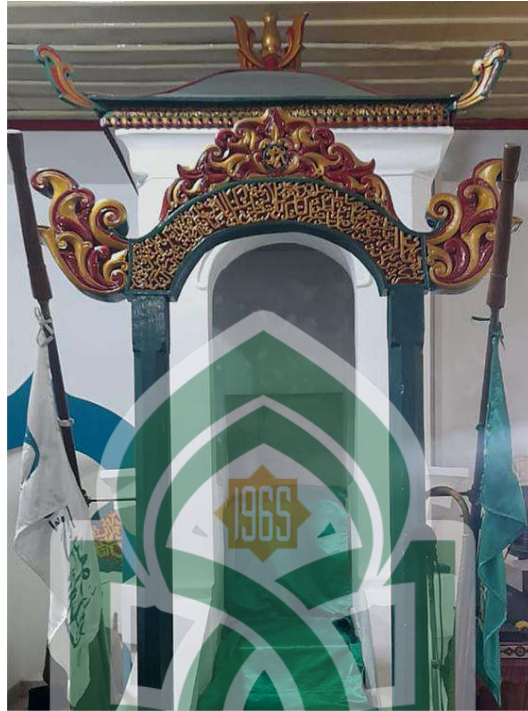
Gambar 10. Mimbar Masjid