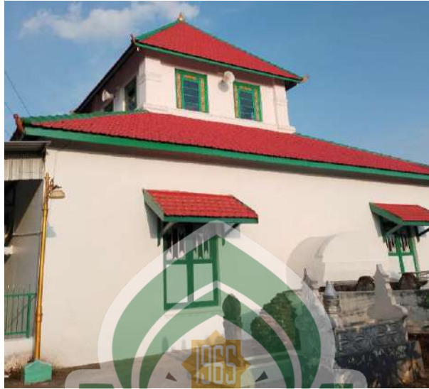
Gambar 12. Dinding Masjid

Dinding Masjid Tua Al-Hilal Katangka mendapat pengaruh budaya dari Belanda dengan berwarna putih. Ketebalan dinding pada masjid yang memiliki ukuran 120 cm. Ketebalan dinding masjid menunjukkan bahwa dahulu masjid tersebut dijadikan benteng pertahanan keluarga Kerajaan Gowa pada zaman penjajahan kolonial. 39 Dinding masjid terbuat dari batu kali yang kokoh dan sudah diplaster. Konon, dengan ketebalan masjid mampu menahan suhu panas dari luar untuk tembus masuk ke dalam masjid. Pada dinding sebelah timur badan masjid terdapat pintu masuk sebanyak tiga buah. Ketiga pintu tersebut pada bagian atasnya terdapat ornamen kaligrafi yaitu tulisan Arab berbahasa Makassar.