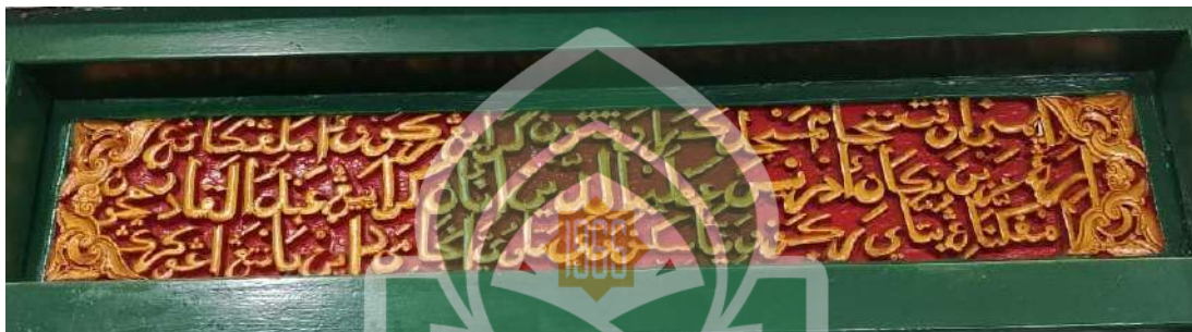
Gambar 6. Pintu Bagian Selatan Masjid Tua Al-Hilal Katangka

Inskripsi berikutnya terdapat di pintu masuk bagian selatan yang digunakan bagi masyarakat umum. 25 Isi inskripsinya berupa: