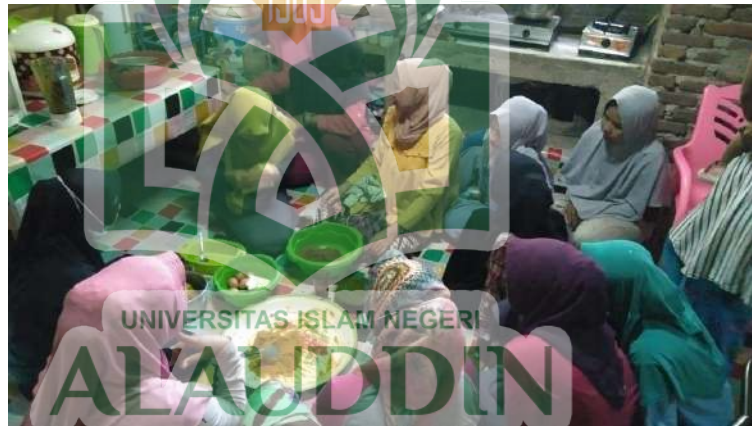
Pelatihan Pengolahan Pangan Lokal