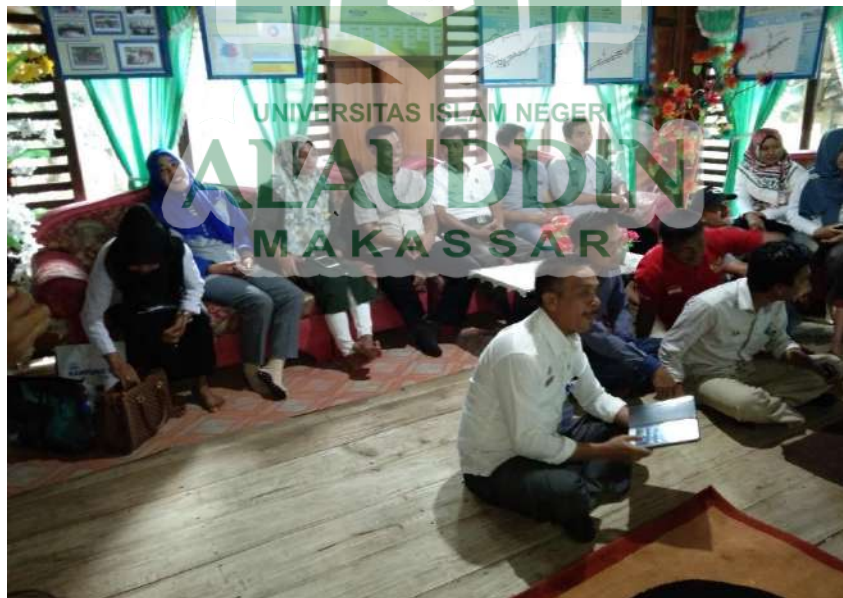
Pertemuan Pokja Kampung KB dengan Lintas Sektor