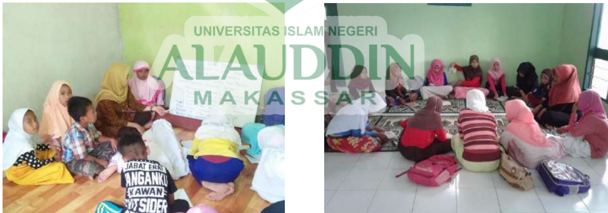
Kegiatan Taman Pendidikan Alquran (TPQ)