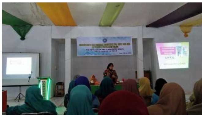
Penyuluhan Kesehatan di tingkat Kabupaten