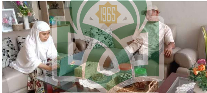
Wawancara dengan Puang Syaharuddin (Tokoh Masyarakat) tanggal 17 Juni 2022