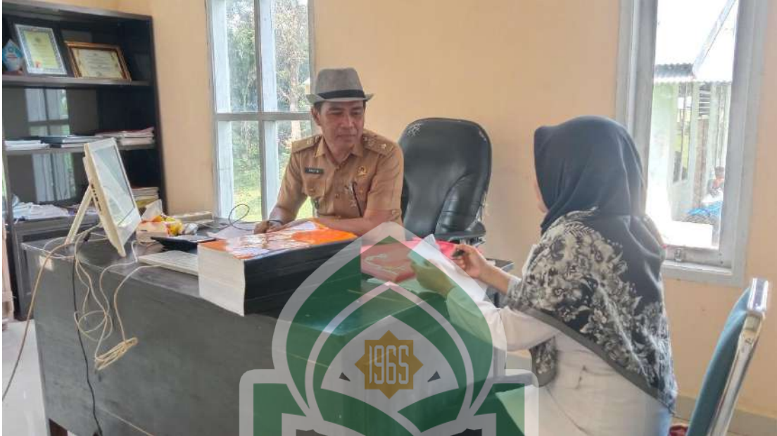
Wawancara dengan Kepala Desa Kalobba tanggal 10 Mei 2022