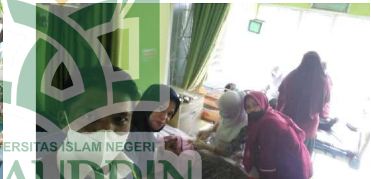
Kegiatan Pelayanan KB Gratis di Puskesmas