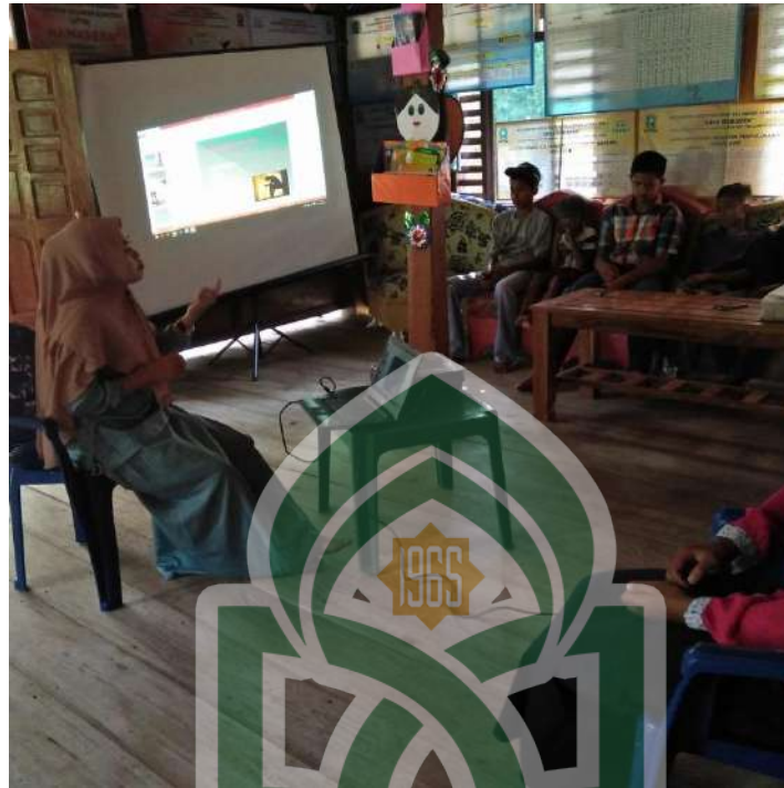
Penyuluhan Narkoba pada Remaja