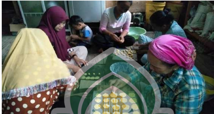
Kegiatan Praktek Pengolahan Pangan Lokal