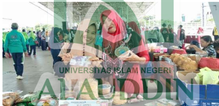
Kegiatan pameran Produk Usaha UPPKs dan UPPKA