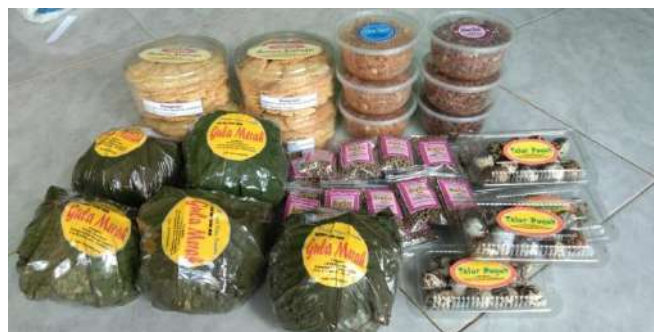
Produk-produk Usaha UPPKA dan Masyarakat