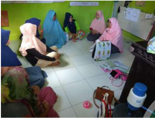
Kegiatan Penyuluhan Di Posyandu