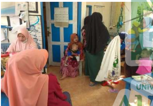
Kegiatan Pelayanan di Posyandu