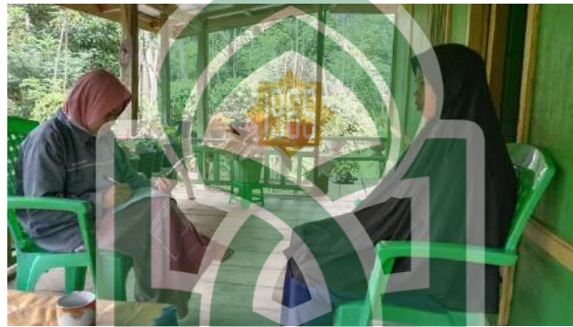
Wawan cara dengan Hikmawati, tanggal 19 Juni 222