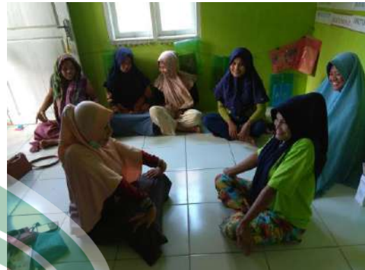
Kegiatan kelas Ibu Hamil