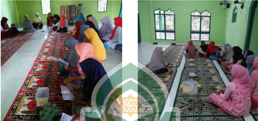
Kegiatan Pengajian Majelis Taklim