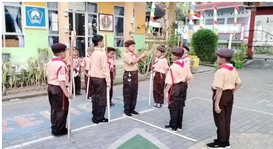
Kegiatan LKBB Pramuka Putra