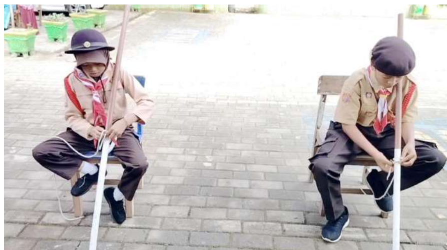
Latihan Tali Temali