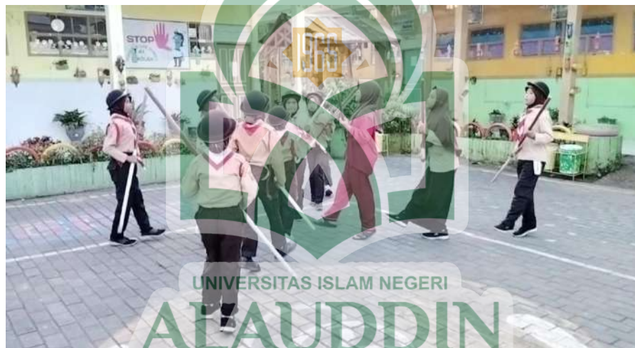
Kegiatan LKBB Pramuka Putri