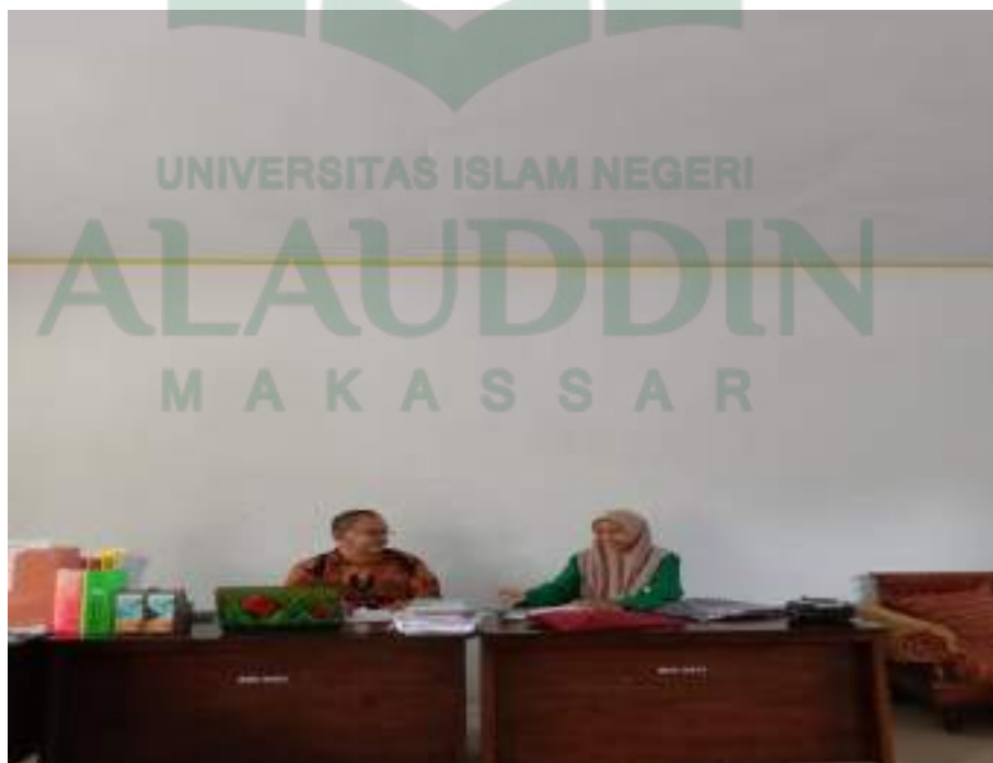
Gambar 4. 9 Wawancara dengan Wakil Kepala Sekolah Bidang Kesiswaan