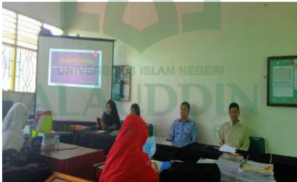
Gambar 4.7 Rapat Perumusan Visi Misi SMA Negeri 5 Bulukumba