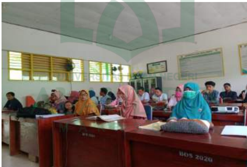
Gambar 4. 6 Pemaparan Rapat Kerja Anggaran Sekolah (RKAS) SMA Negeri 5 Bulukumba