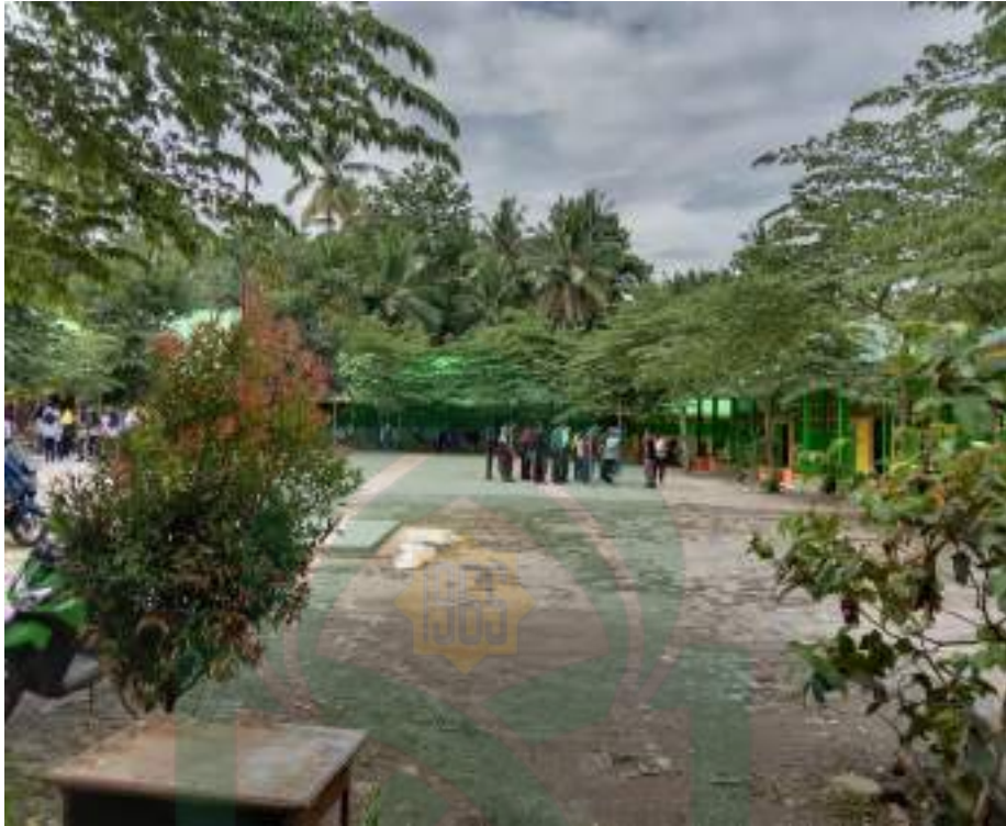
Gambar 4. 1 Halaman Sekolah