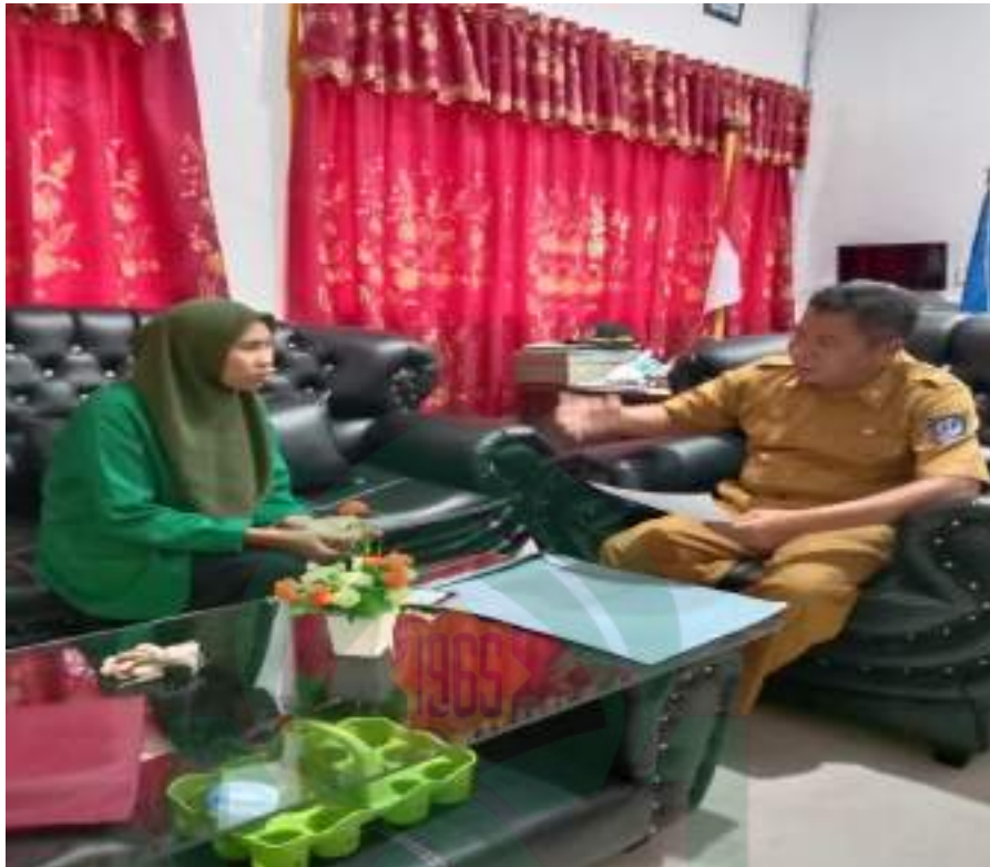
Gambar 4. 8 Wawancara dengan Kepala Sekolah