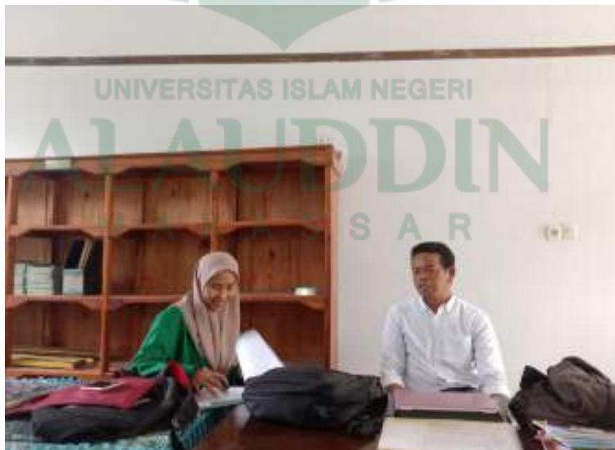
Gambar 5. 1 Wawancara dengan Wakil Kepala Sekolah Bidang Sarana dan Prasarana