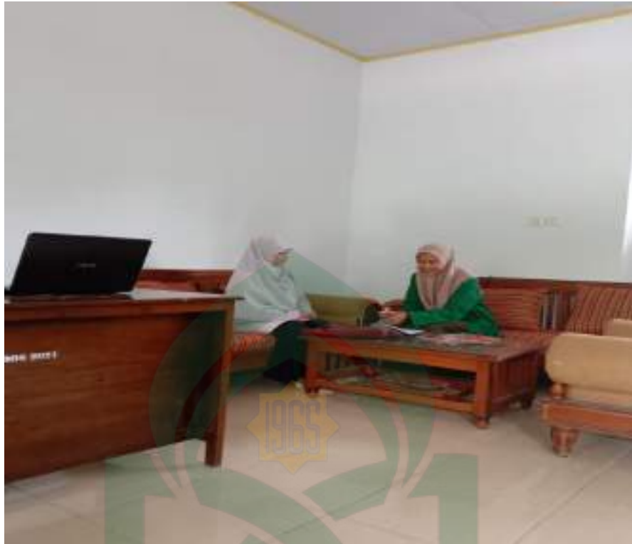
Gambar 5.0 Wawancara dengan Wakil Kepala Sekolah Bidang Kurikulum