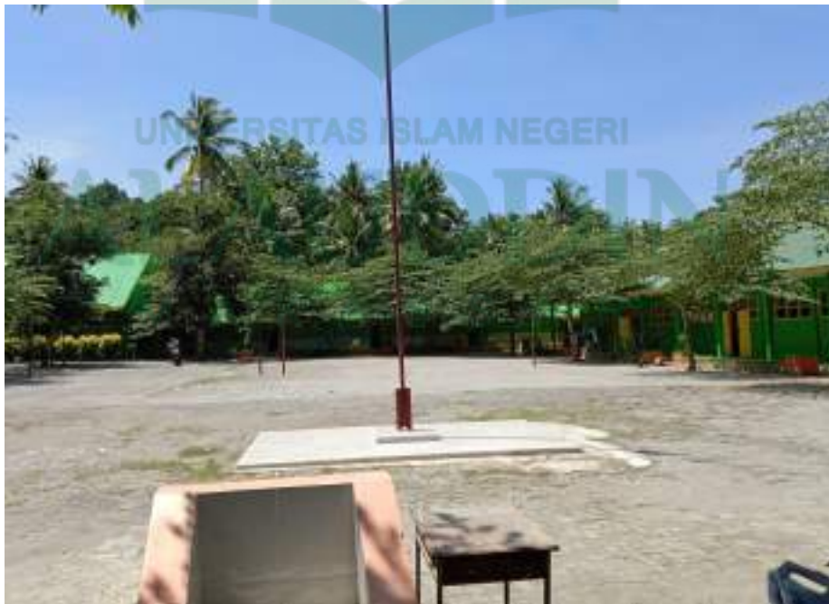
Gambar 4. 2 Lapangan Upacara Sekolah