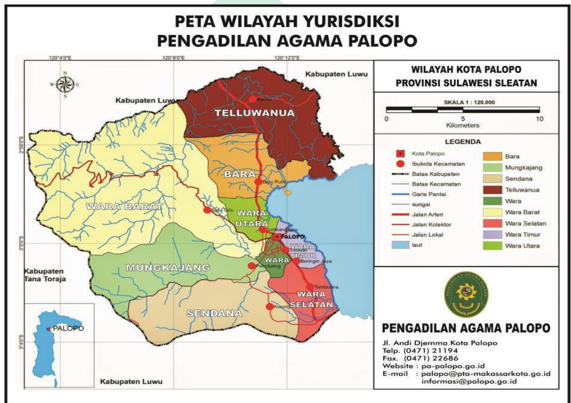
Gambar 1.1 Wilayah Yuridiksi Pengadilan Agama Palopo

Kota Palopo memiliki luas wilayah sekitar 247,52 Km 2 dengan jumlah penduduk sebanyak 168.894 jiwa. Sebagian besar Wilayah Kota Palopo merupakan dataran rendah sesuai dengan keberadaanya sebagai daerah yang terletak di pesisir pantai. Sekitar 62,00 persen dari luas Kota Palopo merupakan daerah dataran rendah dengan ketinggian 0-500 m dari permukaan laut, 24,00 persen terletak pada ketinggian 501-1000 m, dan sekitar 14,00 persen yang terletak di atas ketinggian lebih dari 1000 m.