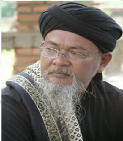
Gambar 4.1 Tokoh Penanggalan Istirhamiah

Sistem Penanggalan Istirhamiah mengikuti sistem kalender Gregorian atau di Indonesia lebih dikenal sebagai kalender Masehi, yakni menggunakan peredaran Bumi mengelilingi Matahari Yang mana satu tahun Penanggalan Istirhamiah berjumlah 365,2425 hari atau 365 hari 5 jam 49 menit 12 detik. Adapun Penentuan tahun kabisat dalam Penanggalan Istirhamiah ini mengikuti tahun kabisat pada kalender Masehi. Contohnya pada tahun 2000 M dengan tahun 3 Istirhamiah itu merupakan tahun kabisat. Akan tetapi penentuan tahun kabisat dalam penanggalan Istirhamiah bukan lagi tahun yang habis dibagi 4, tahun yang tidak habis dibagi 100, dan tahun yang habis dibagi 400. Akan tetapi setiap tahun yang dibagi 4, Sisa 3 itu merupakan tahun kabisat dalam penanggalan Istirhamiah.