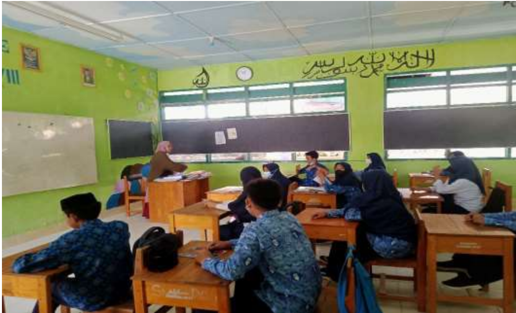
Gambar 1. Menjelaskan instrumen tes