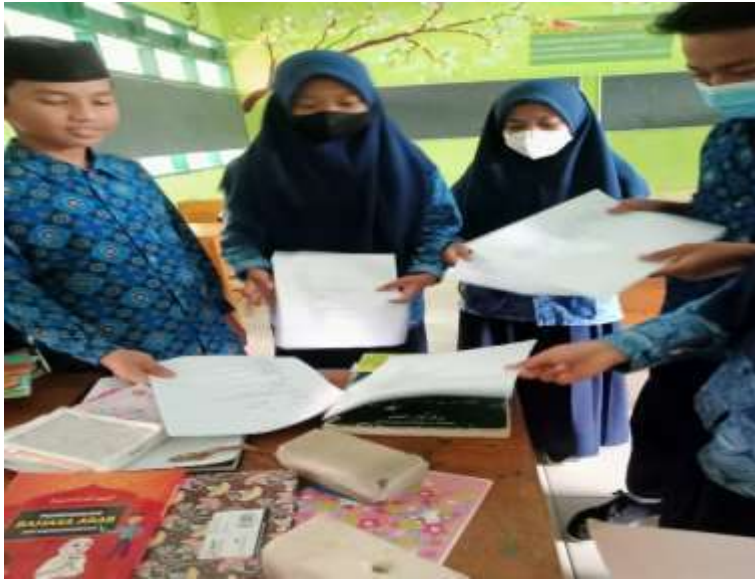
Gambar 3 mengumpulkan hasil jawaban