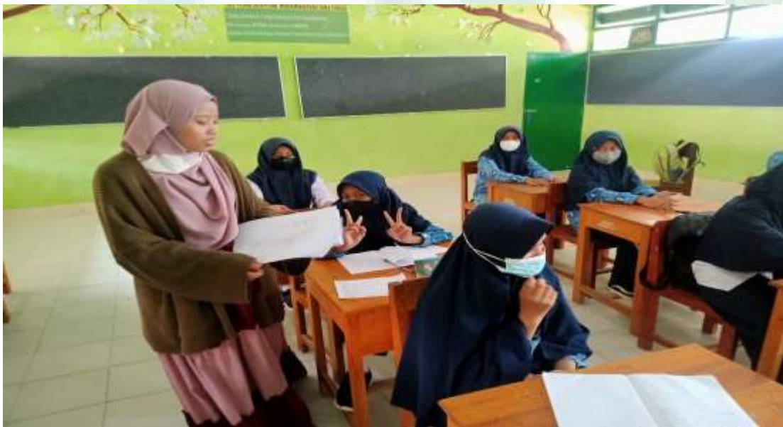
Gambar 2. Membagikan instrumen tes