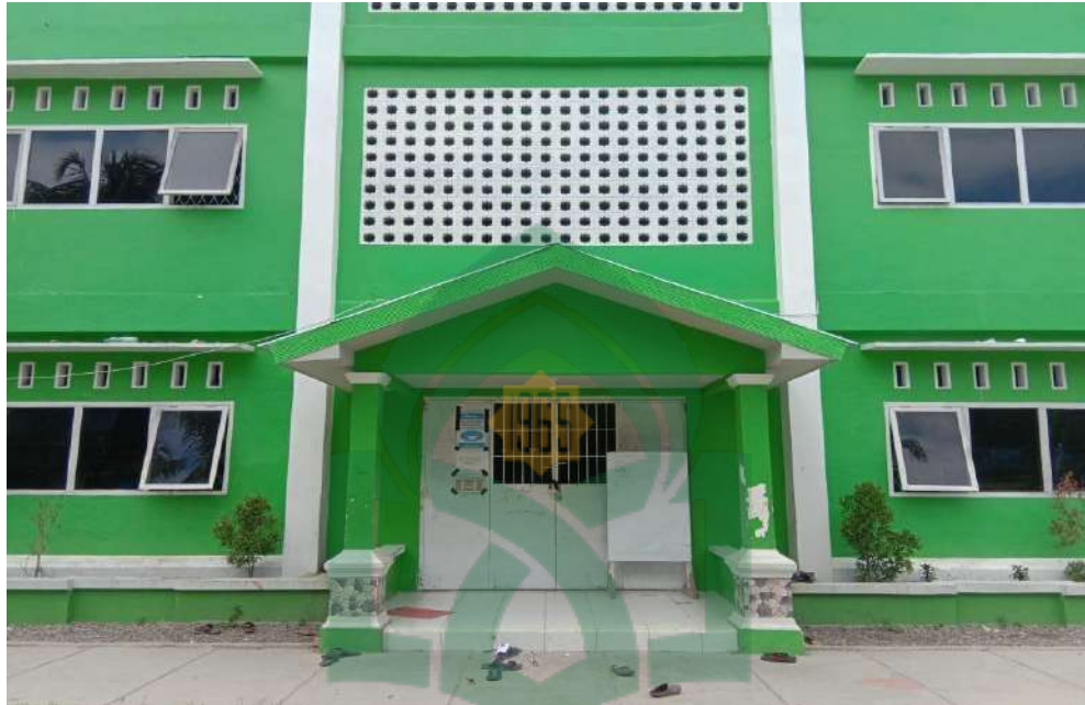
ASRAMA PUTRI UNIVERSITAS ISLAM NEGERI