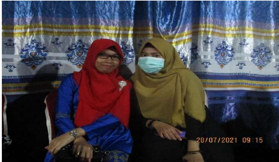
Gambar.1 Dokumentasi dengan Ibu Guru SMA.N.5 Bulukumba yang merupakan salah satu tamu dalam acara Kalomba