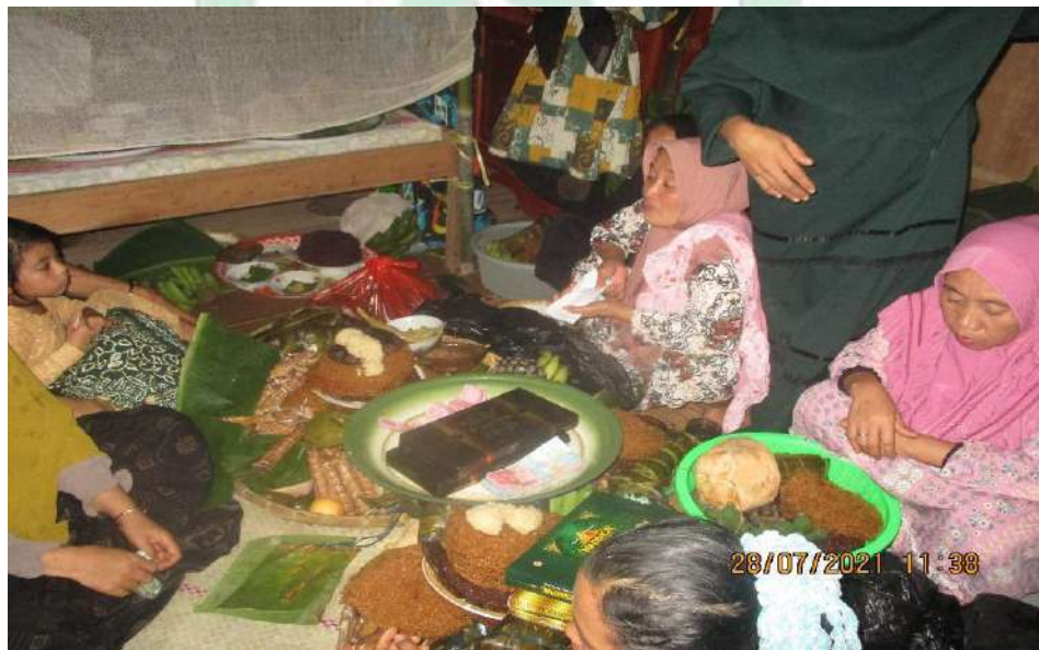
Gambar. 6 Dokumentasi Tradisi Passolo' yang merupakan bagian terakhir dari Tradisi kalomba .