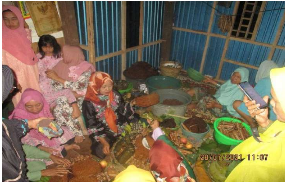
Gambar. 5 Dokumentasi tentang Makanan dan Aneka Kue yang dipersiapkan dalam Tradisi kalomba yang merupakan bagian terpenting.