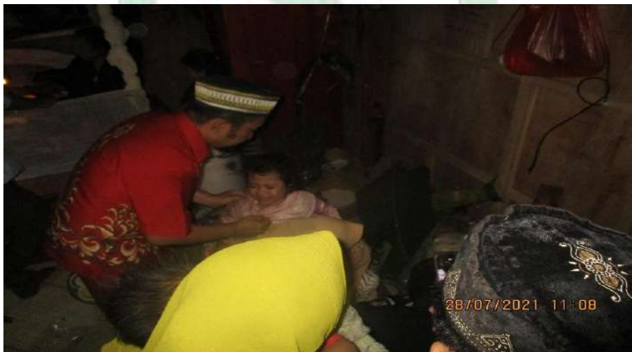
Gambar.4 Dokumentasi Anak yang akan di Kalomba sedang di mandikan dan di Wudhukkan terlebih dahulu.