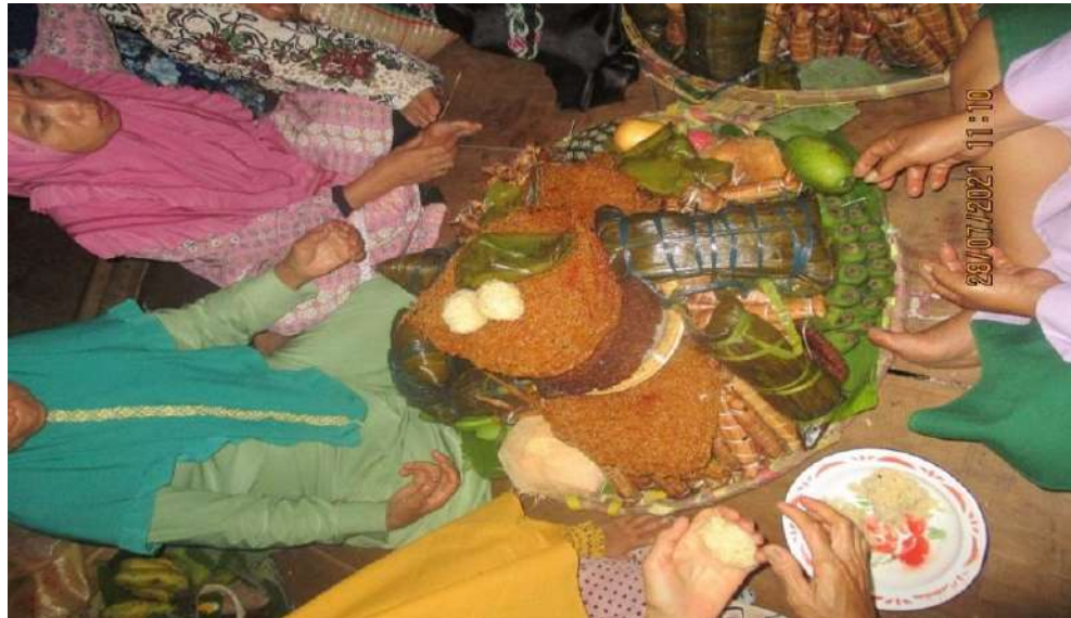
Gambar. 7 Dokumentasi tentang makanan-makanan dan kue-kue yang sedang di susun.