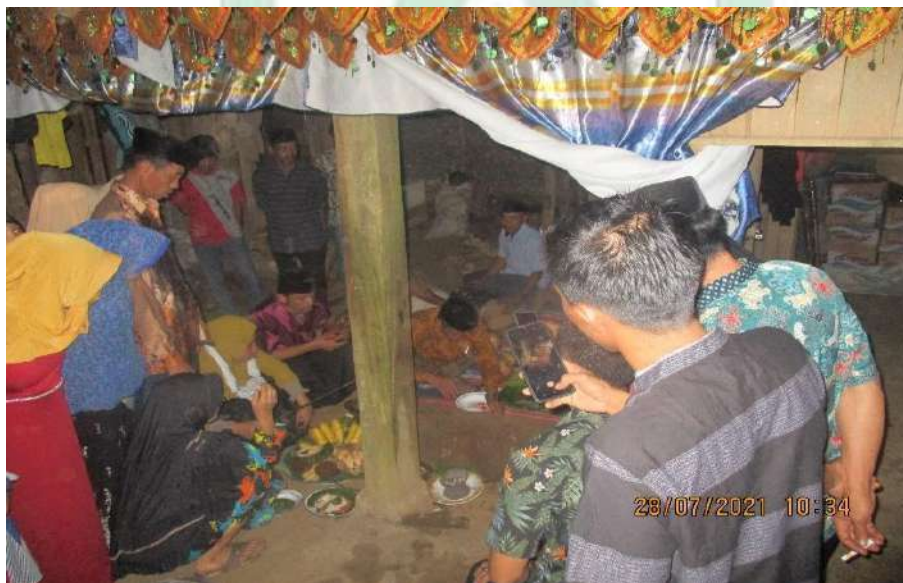
Gambar.2 Dokumentasi Salah satu Acara yang diikuti sertakan dalam Upacara Kalomba yaitu Tradisi Sallu' Tana dalam acara masuk rumah