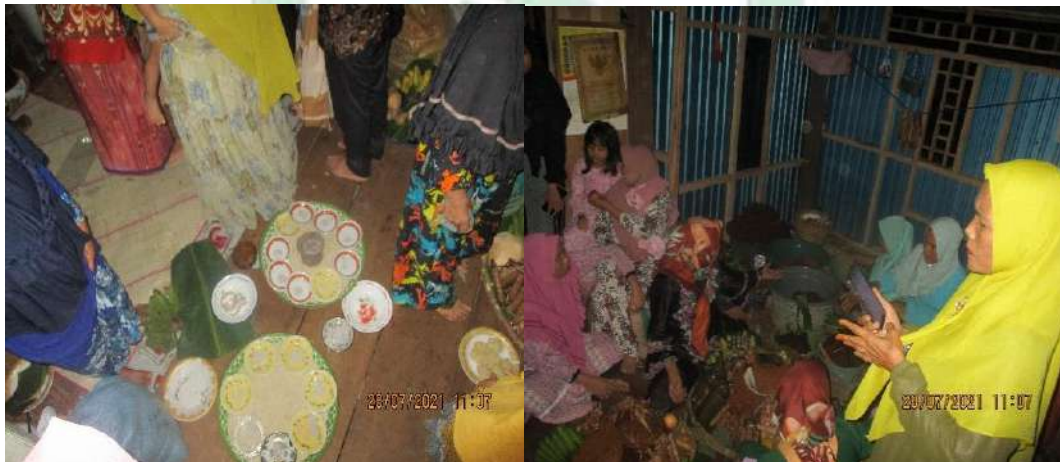
Gambar. 8 Dokumentasi tentang aneka macam perlengkapan dalam proses tradisi kalomba