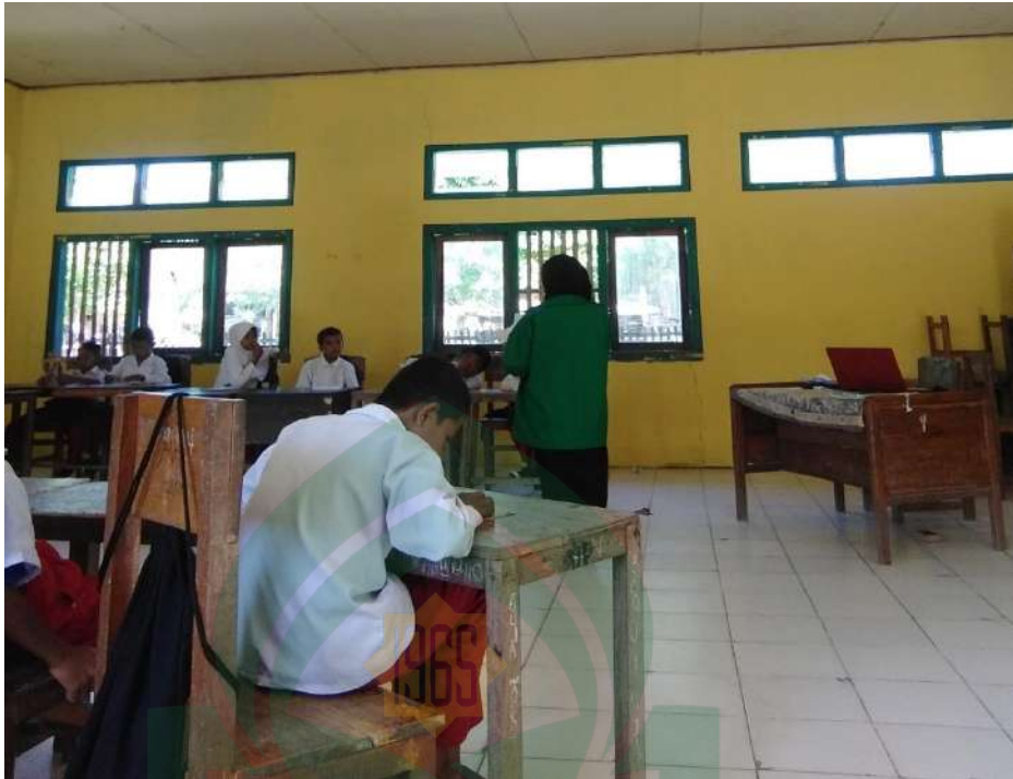
Gambar 5. Guru membagikan soal pre-test