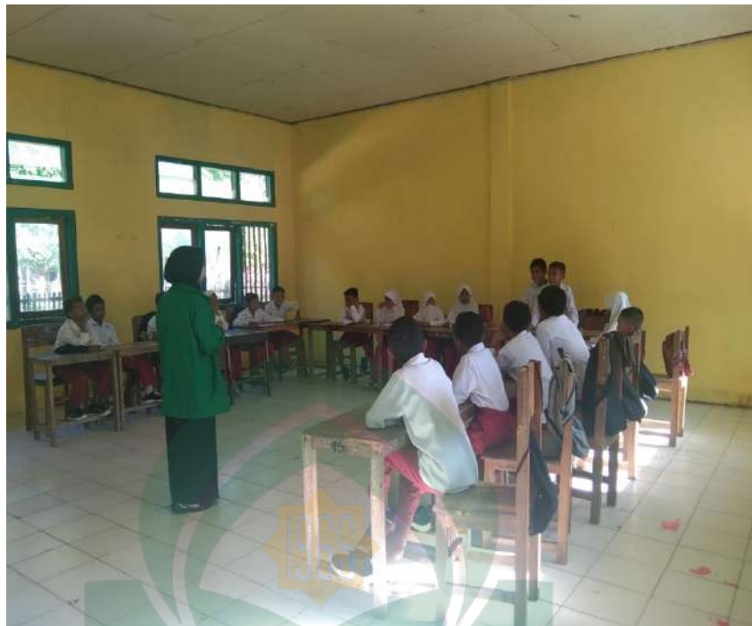
Gambar 3. Peserta didik mengajukan pertanyaan