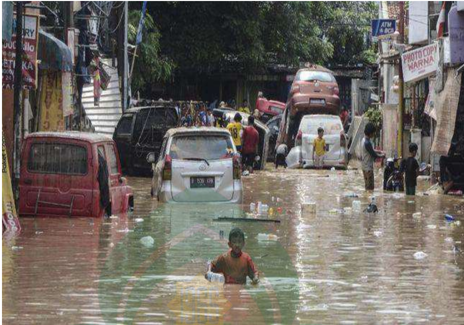
Gambar 12. Media Gambar Peristiwa banjir