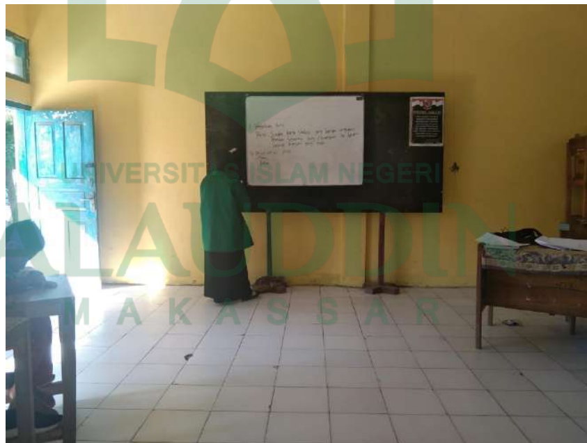
Gambar 4. Guru menulis materi tentang puisi