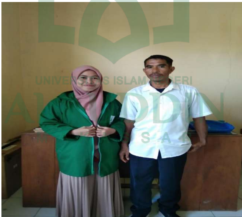
Gambar 15. Foto bersama dengan kepala Sekolah MIS Jihadul Iman