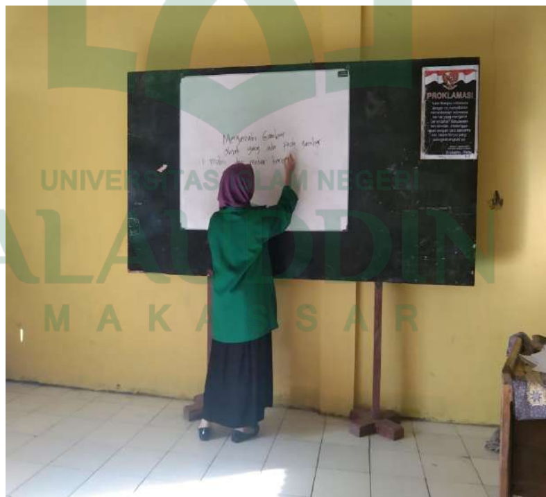
Gambar 10. Guru menjelaskan mengenai gambar yang dibagikan