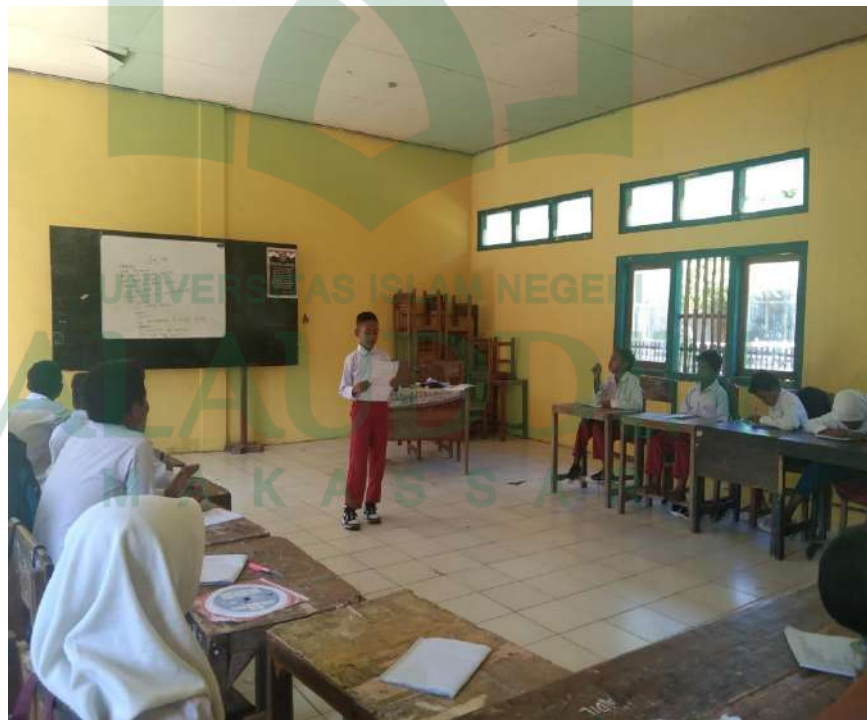
Gambar 8. Peserta didik membacakan hasil puisi yang telah dibuat