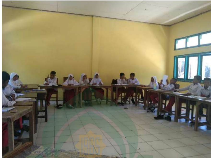
Gambar 7. Peserta didik mengerjakan soal pre-test