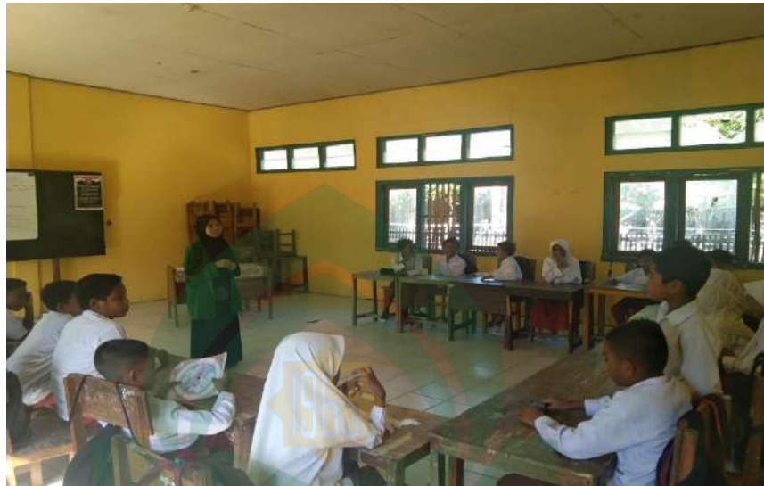
Gambar 1. Perkenalan diri dengan peserta didik kelas V