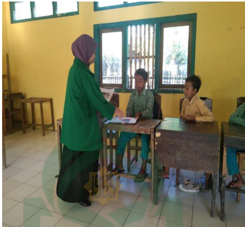
Gambar 9. Membagikan soal post-test dan gambar