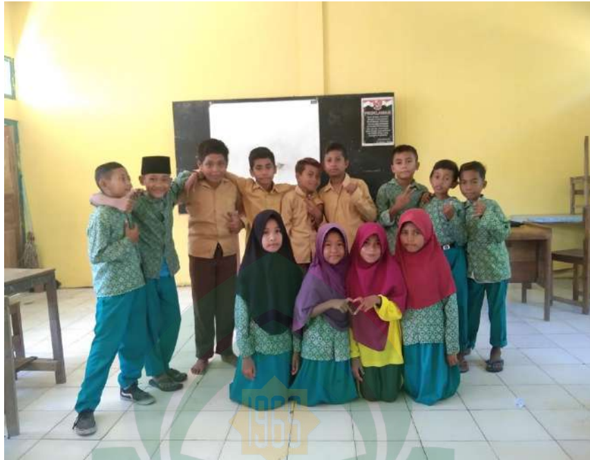
Gambar 14. Foto bersama dengan peserta didik kelas V