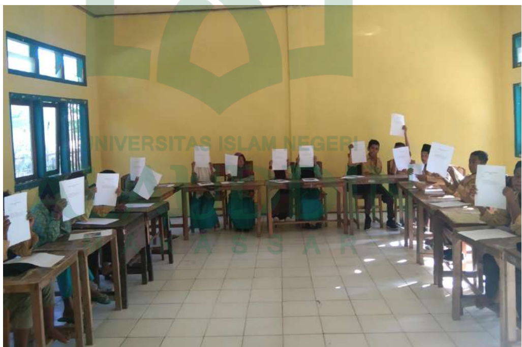
Gambar 11. Siswa mengamati gambar kemudian mengerjakan soal post-test