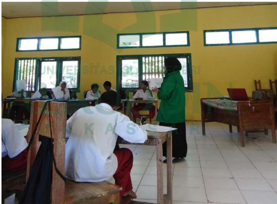
Gambar 6. Guru menjelaskan mengenai perintah soal pre-test