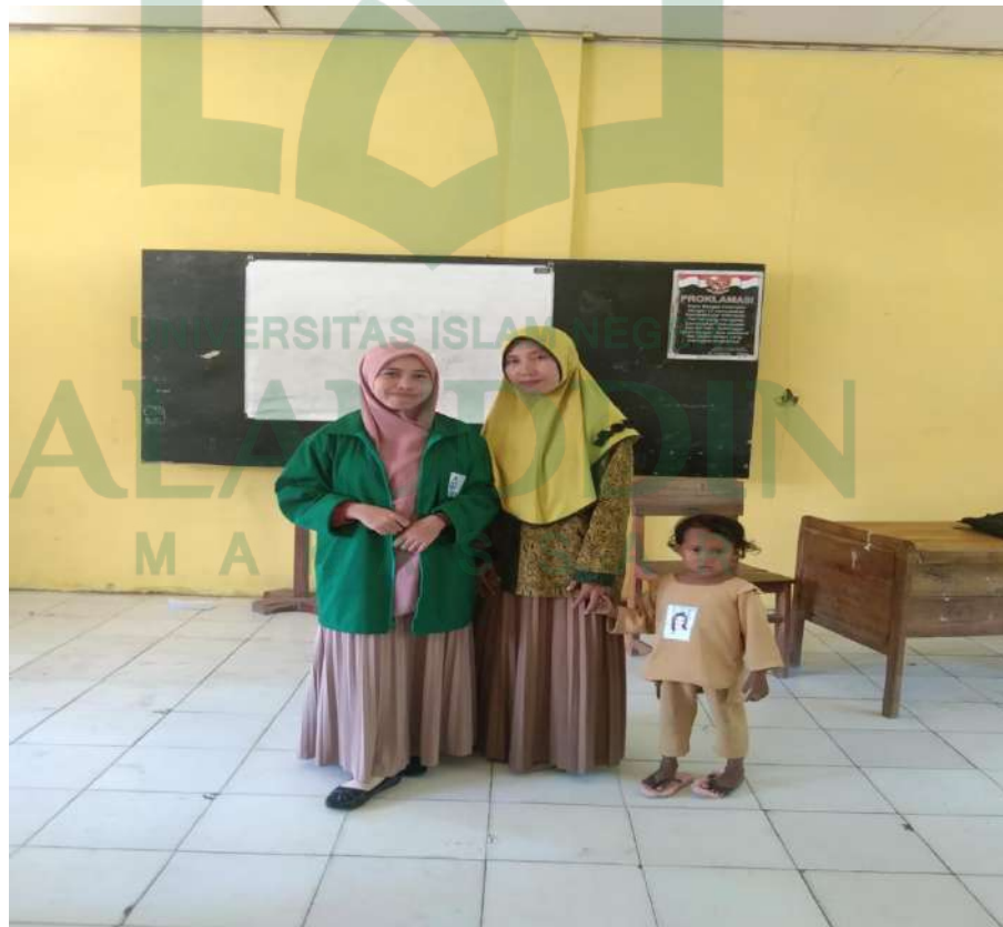
Gambar 13. Foto bersama dengan guru wali kelas