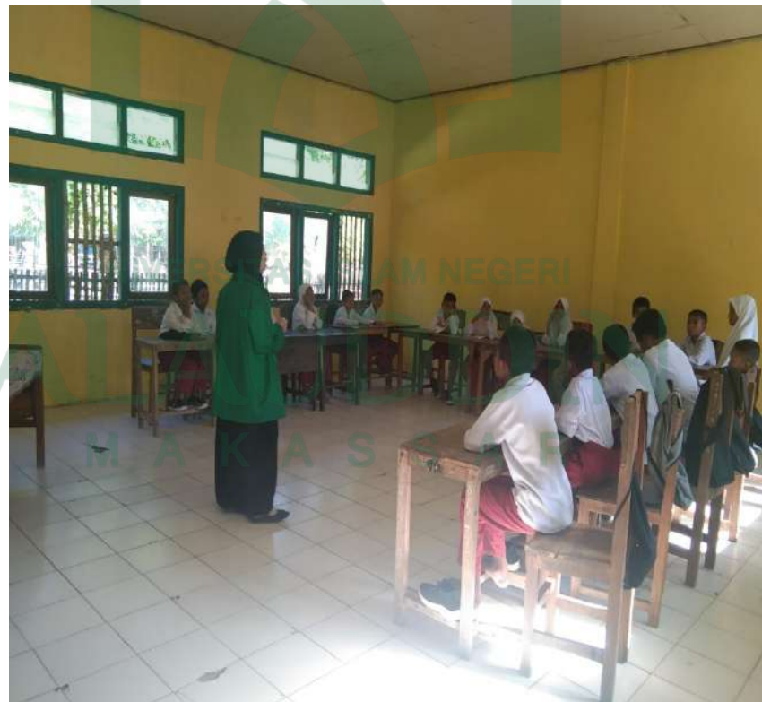
Gambar 2. Menjelaskan materi tentang puisi.