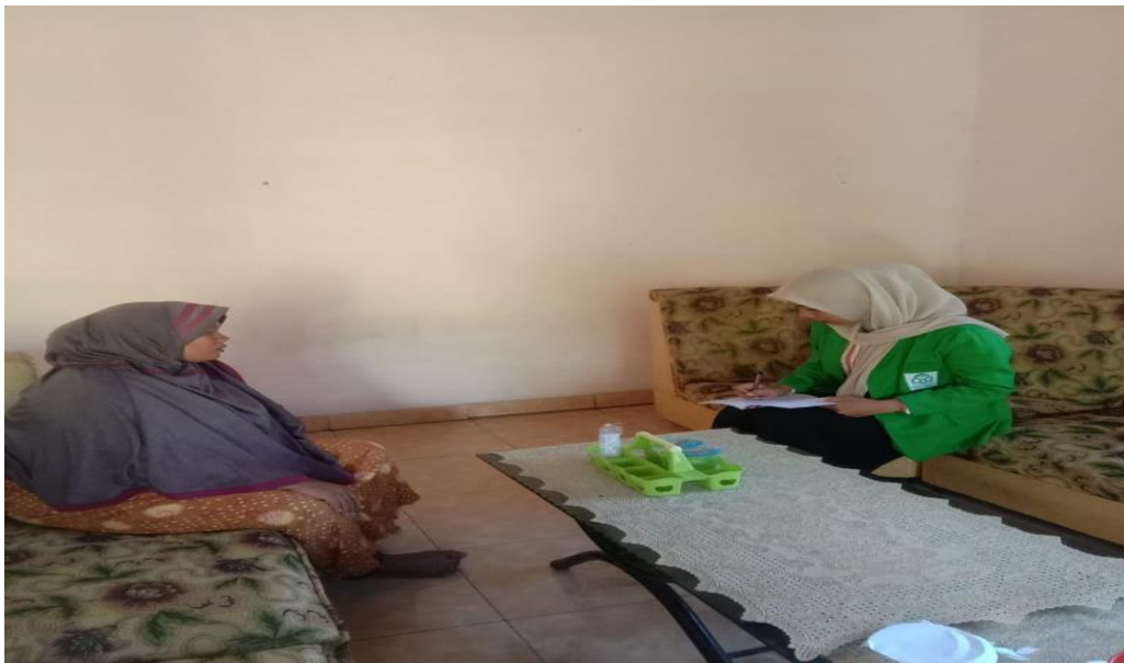
Gambar 2 Foto Wawancara Dengan Ibu Gesi (Orang Tua Siswa)