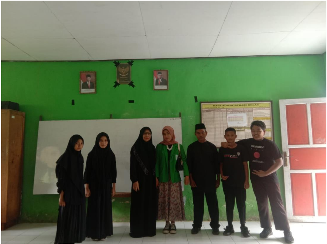
Gambar 6 Foto Dengan Guru Kelas 5 dan 6 ( Data Peneliti: 2023)