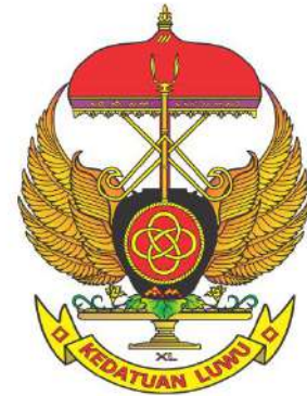
Bendera Kedatuan Luwu