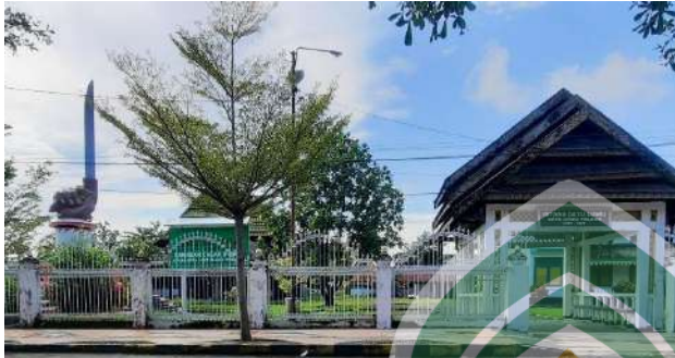
Istana Datu Luwu