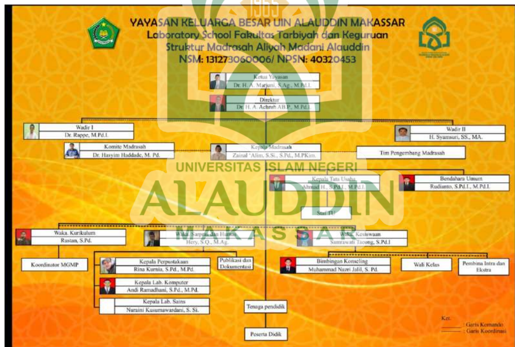
Gambar 4.2 Struktur Organisasi Madrasah Aliyah Madani Alauddin Pao Pao

Guru yang sering juga disebut tenaga pendidik merupakan salah satu tokoh utama dalam dunia pendidikan yang sangat berperan penting dalam memberikan