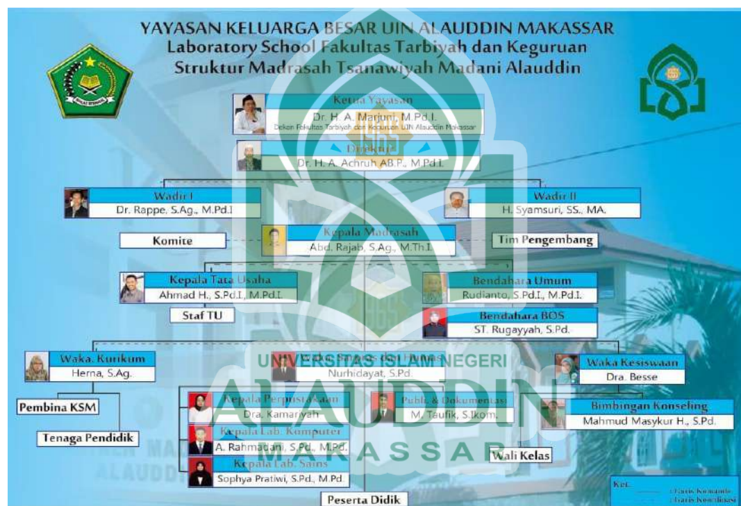
Gambar 4.1 Struktur Organisasi Madrasah Tsanawiyah Madani Alauddin Pao

Guru yang sering juga disebut tenaga pendidik merupakan salah satu tokoh utama dalam dunia pendidikan yang sangat berperan penting dalam memberikan pendidikan kepada peserta didik khususnya di Madrasah Tsanawiyah Madani Alauddin. Dengan adanya tenaga pendidik ini pula maka sangat diharapkan dapat memberikan bimbingan dan perhatian secara professional dengan menggunakan