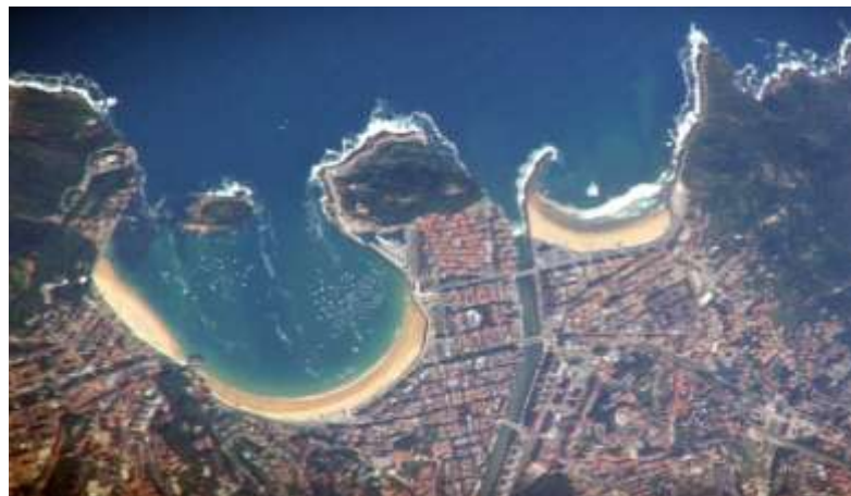
Gambar 3.5. Bentuk Teluk