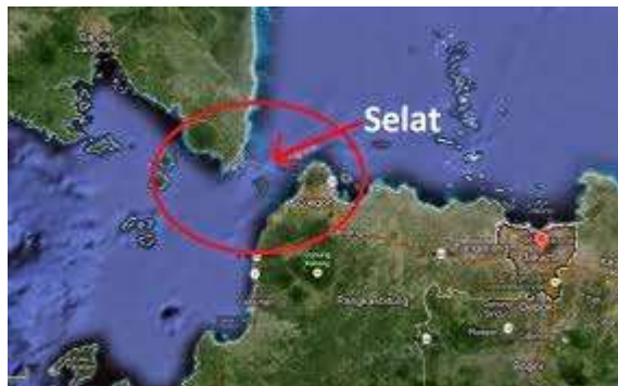
Gambar 3.4. Lebar Selat