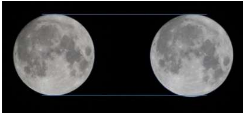
Gambar 4.2. Penampakan Supermoon Tanggal 13-14 November 2016

Perbedaan penampakan bulan terlihat ketika pengambilan gambar di sore hari sekitar pukul 6 sore waktu setempat setelah bulan terbit dan penampakan bulan sekitar pukul 12.30. bulan terbit lebih kecil karena letaknya lebih jauh, jarak pusat bulan kira-kira sama dari pusat bumi dan pengamat.