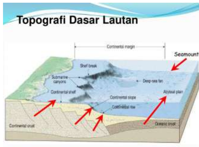
Gambar 3.3. Topografi Dasar Laut