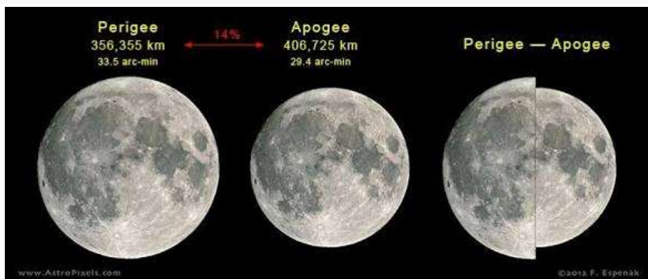
Gambar 4.1. Perbedaan Penampakan Perigee dan Apogee

Supermoon terjadi ketika bulan purnama dan letak bulan berada pada jarak terdekatnya dari bumi. Bulan purnama umumnya terjadi di setiap tahap bulan baru. Bulan melintasi lingkaran lingkaran dunia dengan tujuan ada kalanya bulan akan berada di dekat bumi, tepatnya saat bulan berada pada perigee (sekitar 362.570 km) dan ada kalanya posisi bulan jauh dari bumi atau apogee (sekitar 405.410 km). Namun, saat bulan berada di titik terdekatnya, jaraknya tidak akan persis sama seperti di masa lalu. Bulan berada dalam posisi perigee selama sekitar 27,55 hari, namun umumnya tidak dalam tahap bulan purnama. Pengamat kristal menganggapnya sebagai supermoon dan kosmolog menyebutnya perigee bulan purnama (Full Moon Perigee).