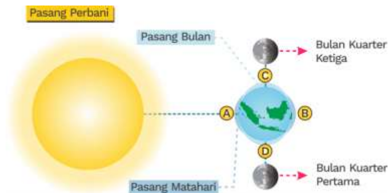
Gambar 3.2. Pasang Perbani

Faktor yang menyebabkan terjadinya pasang surut berdasarkan teori kesetimbangan adalah rotasi bumi pada sumbunya, revolusi bulan terhadap matahari, dan revolusi bumi terhadap matahari. 4 Sedangkan secara teori dinamis dikarenakan kedalaman dan luas perairan, pengaruh rotasi bumi dan gesekan dasar. Selain itu, terdapat beberapa faktor local yang mempengaruhi pasang surut yaitu topografi dasar laut, lebar selat, bentuk teluk, dan lain sebagainya sehingga berbagai daerah memiliki ciri pasang surut yang berbeda.