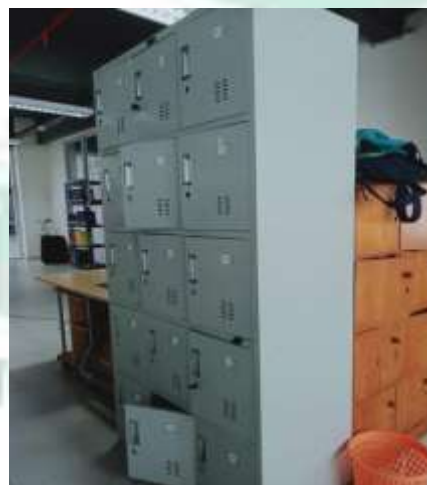
Gambar 4 : Loker penitipan Barang Perpustakaan Universitas Fajar Makassar