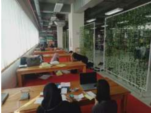
Gambar 3 : Ruang Baca Perpustakaan Universitas Fajar Makassar