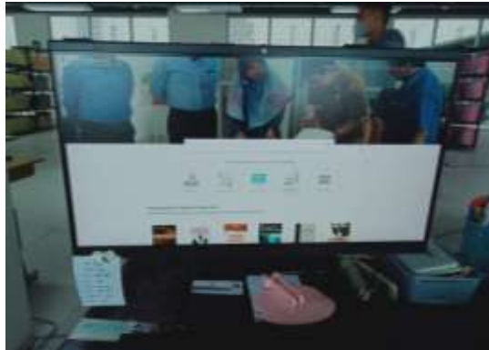
Gambar.2 : OPAC Perpustakaan Universitas Fajar Makassar