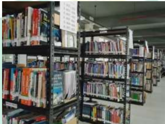
Gambar.1: Rak Buku Perpustakaan Universitas Fajar Makassar