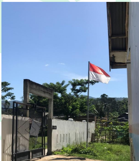
Gambar 12: suasana di depan kelas