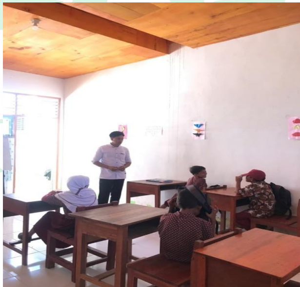
Gambar 4: proses belajar mengajar dikelas