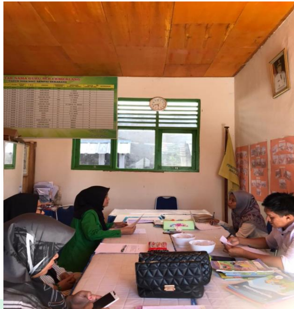
Gambar 7: proses wawancara bersama guru SLB Cemerlang Kolaka