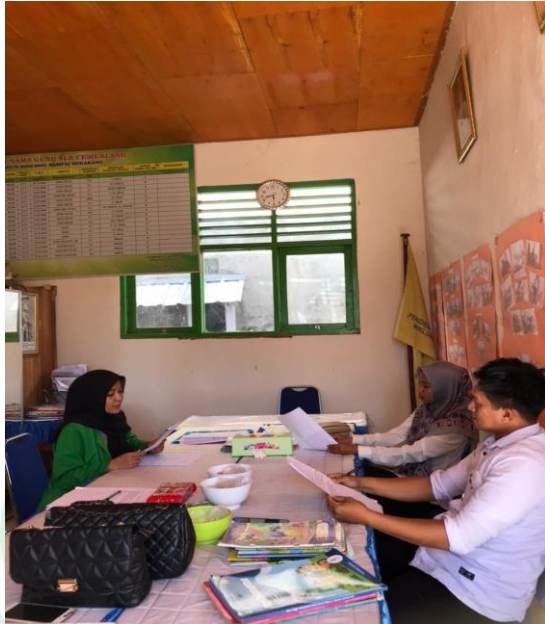
Gambar 9: proses wawancara dengan Guru SLB Cemerlang Kolaka