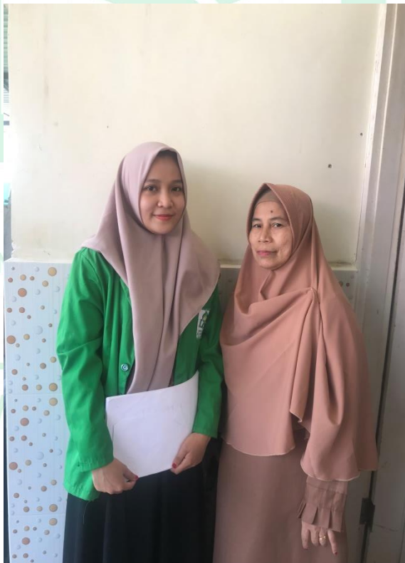
Gambar 10: Foto Bersama dengan Guru SLB Cemerlang Kolaka