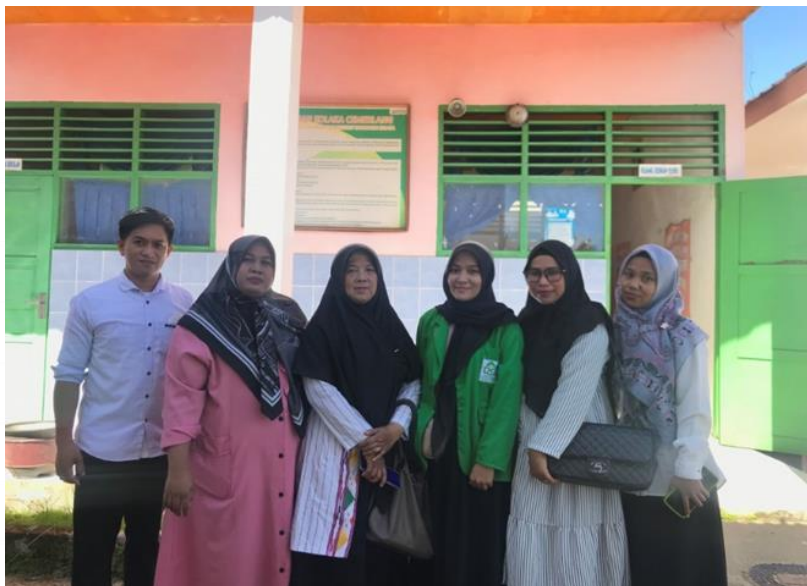
Gambar 11: foto bersama dengan Guru SLB Cemerlang Kolaka