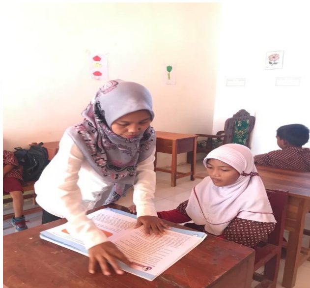
Gambar 5: guru sedang memberikan pelajaran kepada siswa