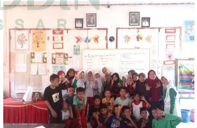
Foto Bersama Peserta Didik UPT SD Negeri 11 Bontosanra