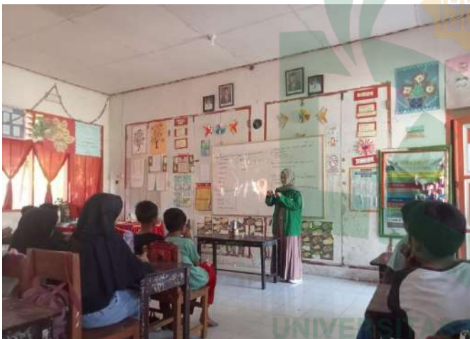
Menjelaskan Materi Pembelajaran