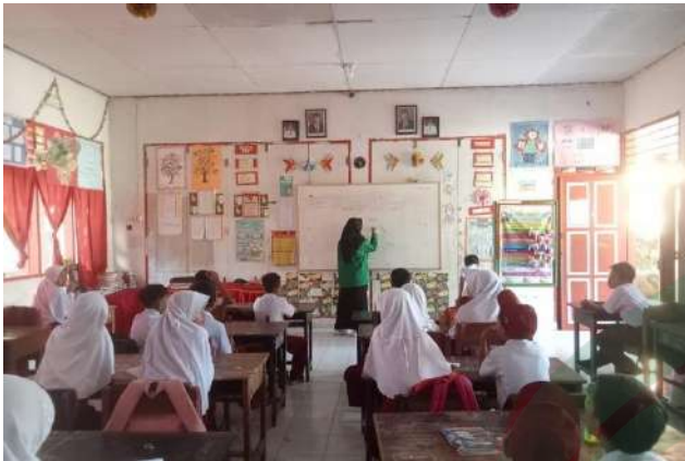
Sebelum Pemberian Pre Test