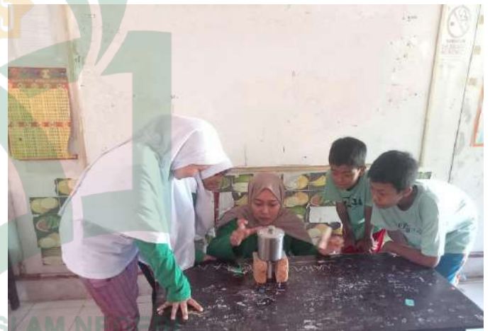
Perwakilan Setiap Kelompok Diminta Untuk Melakukan Percobaan