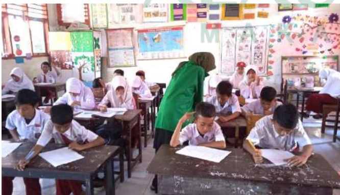
Pemberian Post Test