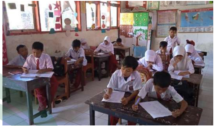
Peserta Didik Mengerjakan Soal Pre Test