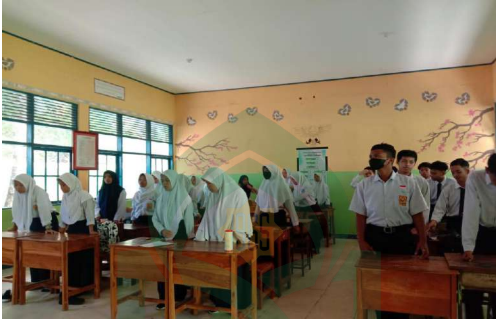
Suasana kelas XI pada saat pembagian angket