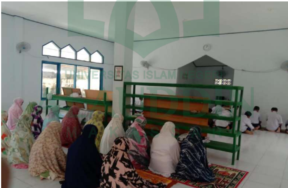
Suasana Kelas XI pada saat melaksanakan Ibadah Mahdah