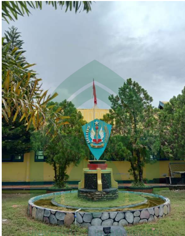
Sekolah SMP Negeri 1 Sendana Kabupaten Majene