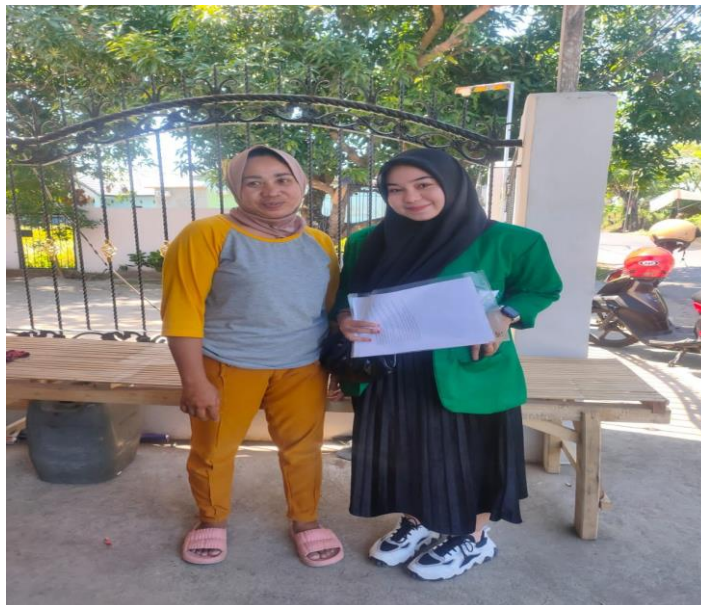
Wawancara Dengan Ratu Warga Desa Boddia (26 Juli 2023)