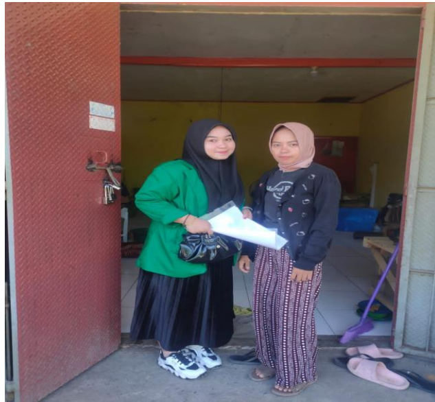
Wawancara Dengan Mawara Warga Desa Boddia (26 Juli 2023)