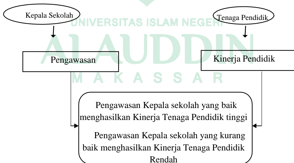
Gambar 2.1 Kerangka Berpikir

Kinerja tenaga pendidik merupakan kemampuan yang harus dimiliki tenaga pendidik dalam melaksanakan berbagai tugas profesinya. Kinerja tenaga pendidik dipengaruhi oleh berbagai faktor, seperti pengetahuan dan keterampilan tenaga pendidik yang didapat pada saat meluimasa pendidikannya, motivasi awal yang dimiliki oleh tenaga pendidik dalam menentukan profesinya, dan faktor motivasi yang didapatkan tenaga pendidik di lingkungan kerjanya dan tidak terlepas dari pengawasan kepala sekolah. Kepala sekolah sebagai pengawas di lingkungan kerja tenaga pendidik, dalam hal ini akan berpengaruh terhadap tenaga pendidik. penelitian ini dapat dilihat dari paradigma sebagai berikut.