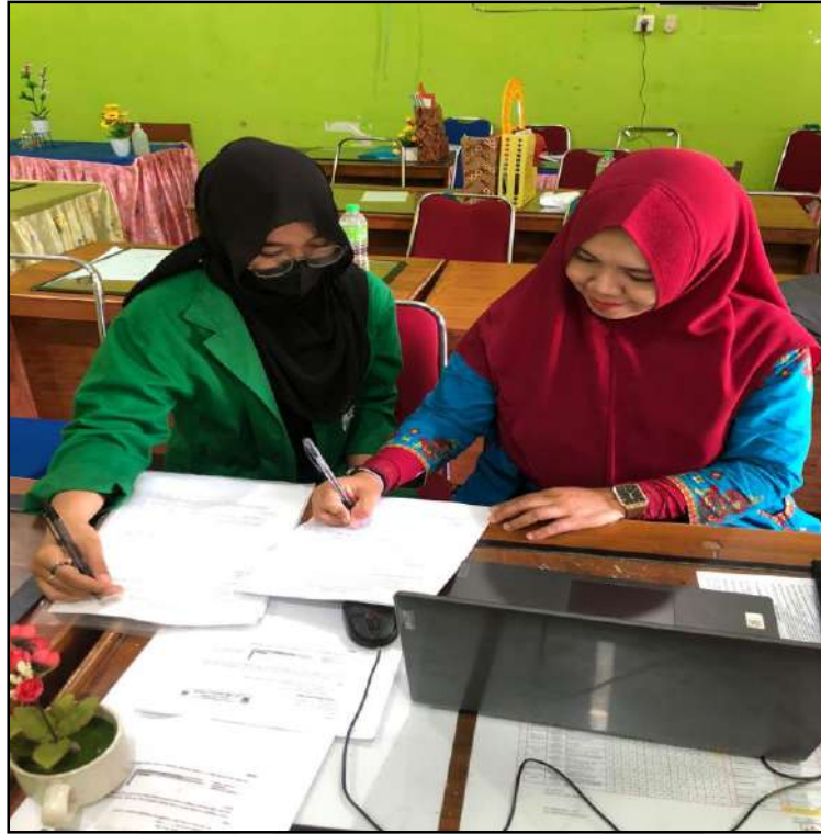
Pengisian Angket Oleh Ibu Guru di SMK Negeri 4 Takalar