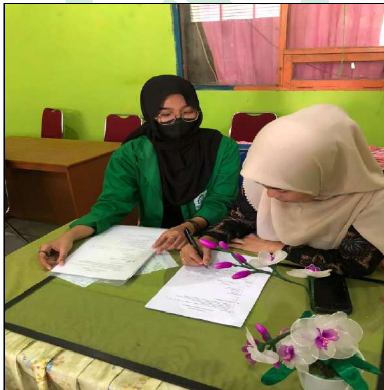
Pengisian Angket Oleh Ibu Guru di SMK Negeri 4 Takalar