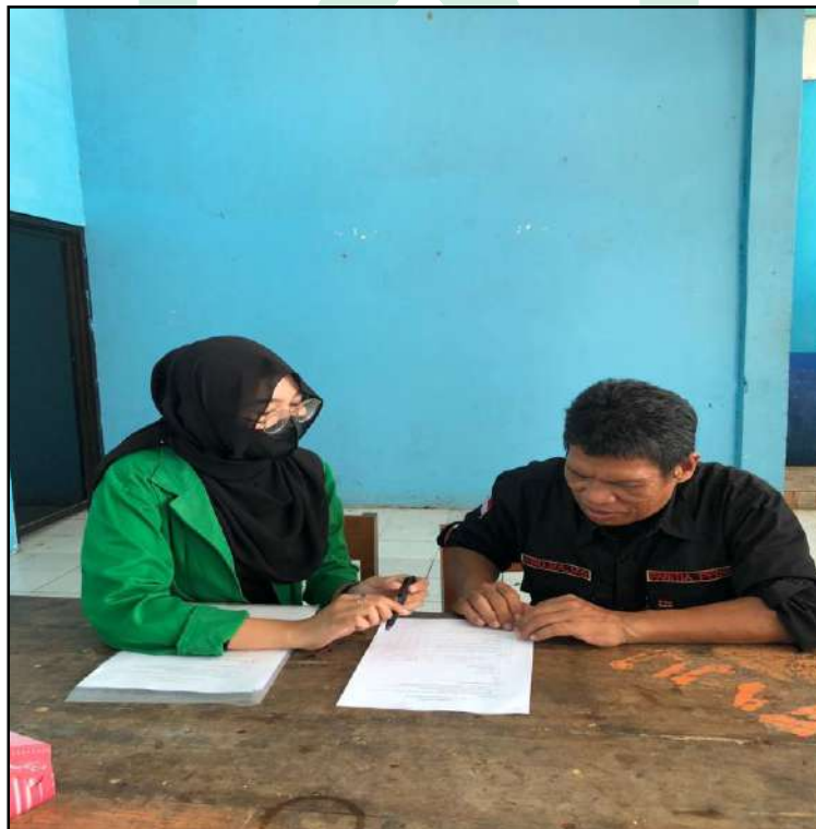
Pengisian Angket Oleh Bapak Guru di SMK Negeri 4 Takalar