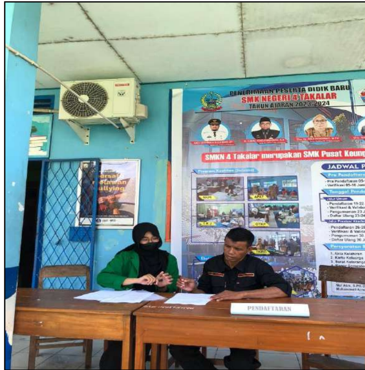
Pengisian Angket Oleh Bapak Guru di SMK Negeri 4 Takalar