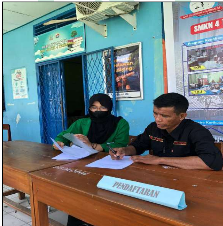
Pengisian Angket Oleh Bapak Guru di SMK Negeri 4 Takalar