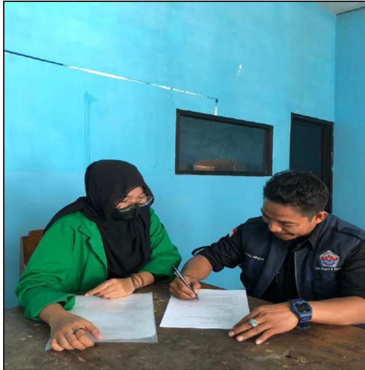
Pengisian Angket Oleh Bapak Guru di SMK Negeri 4 Takalar