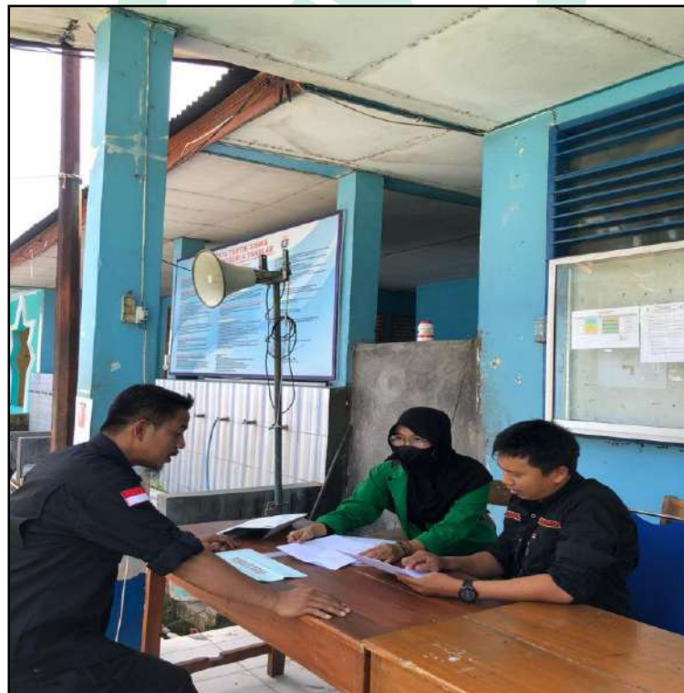
Pengisian Angket Oleh Bapak Guru di SMK Negeri 4 Takalar