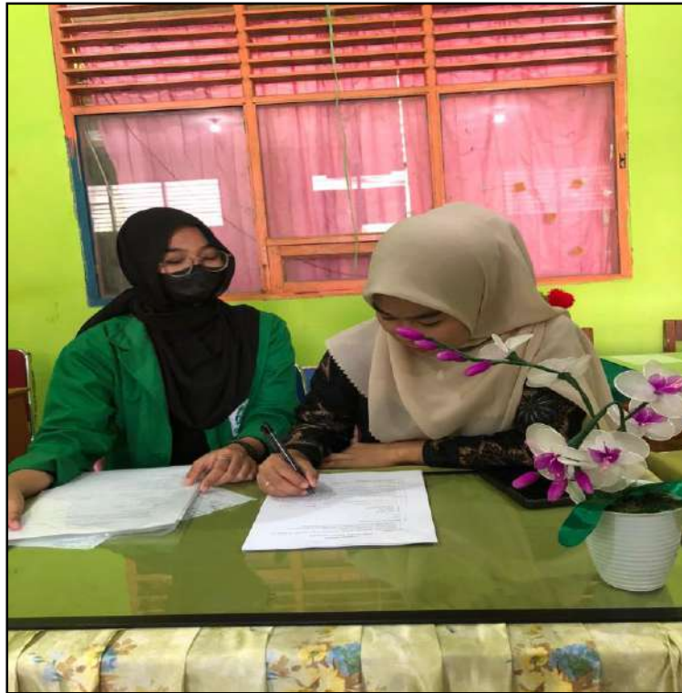
Pengisian Angket Oleh Ibu Guru di SMK Negeri 4 Takalar