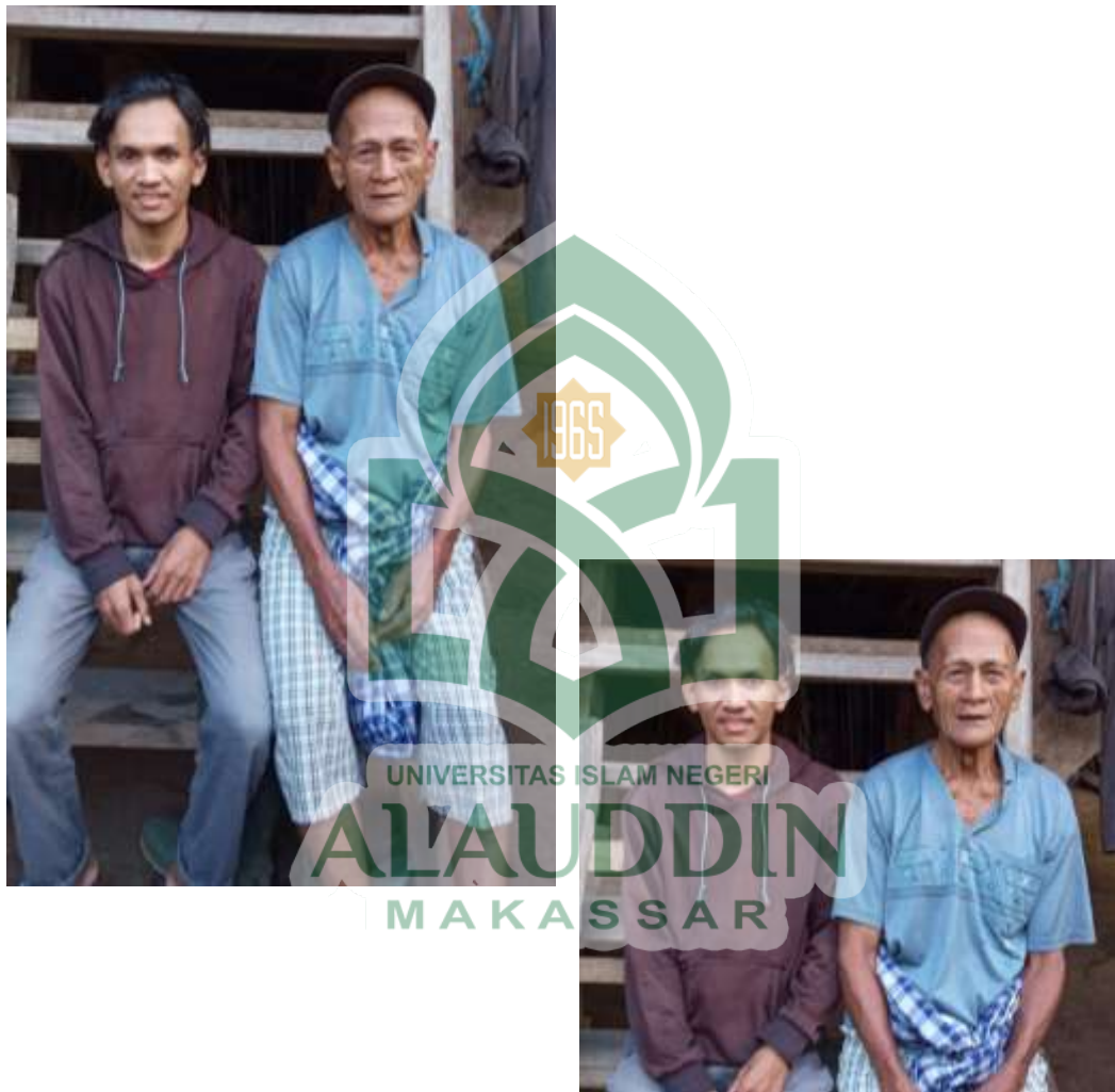
Foto bersama narasumber setelah melakukan wawancara