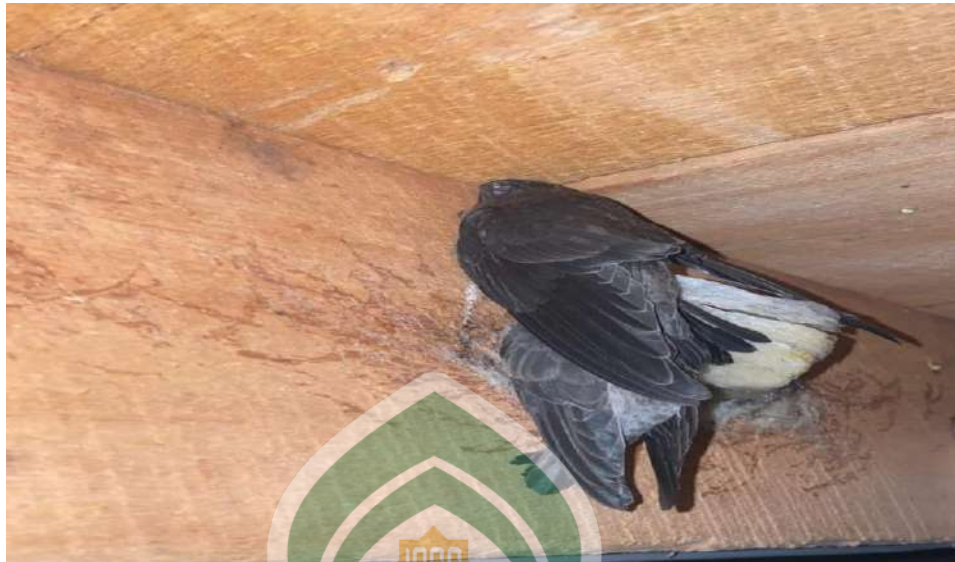
Gambar 2.2. Burung Walet

Namun kebanyakan masyarakat di Desa Enrekeng Kabupaten Soppeng membangun tempat sarang burung walet dari sebagian bangunan rumah tempat tinggal mereka yaitu hanya menambah tingkat bangunan rumah bagian belakang untuk di jadikan gedung walet dan sebagiannya lagi seperti bagian depan dapat ditempati. Kebanyakan petani burung walet menganggap itu dapat meringankan beban biaya pembangunan yang mahal dalam pembangunan gedung walet yang tinggi sampai bertingkat-tingkat. Sehingga tantangan para petani sarang burung walet yaitu mereka harus pintar dalam memancing burung walet agar mau bersarang dalam bangunanya. Meskipun dalam memulai usaha burung walet tersebut membutuhkan modal yang sangat besar namun apabila berhasil maka keuntungan yang di dapat juga sangat besar.