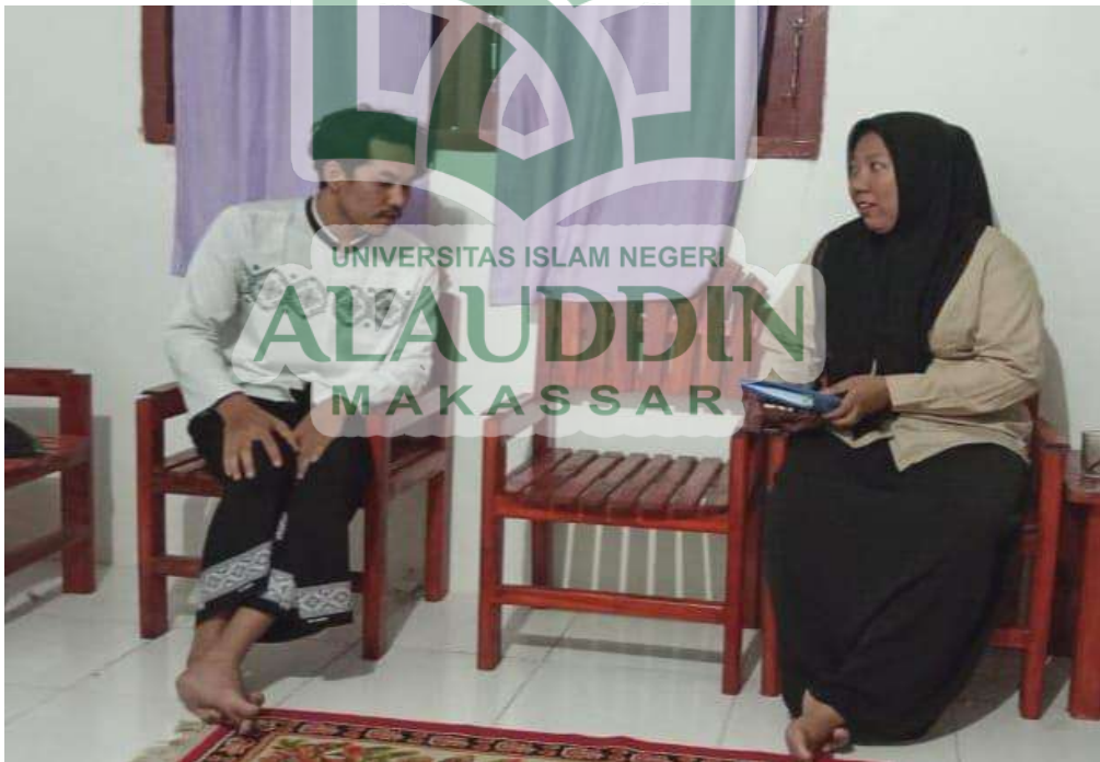
(Tokoh Agama/Imam Desa Enrekeng Fitra)