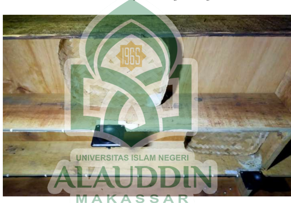
Gambar 2.3. Tempat Sarang Burung Walet

Zakat penghasilan atau dikenal juga dengan zakat profesi adalah bagian dari zakat maal yang wajib dikeluarkan atas harta yang berasal dari setiap pendapatan atau penghasilan rutin dari pekerjaan yang tidak melanggar ketentuan syariah. Zakat profesi menurut Didin Hafidhuddin sendiri adalah zakat yang dikenakan pada tiap pekerjaan atau keahlian tertentu, baik yang dilakukan sendiri maupun bersama orang lain atau dengan lembaga lain, yang mendatangkan penghasilan (uang) yang memenuhi nisab (batas minimum untuk berzakat).