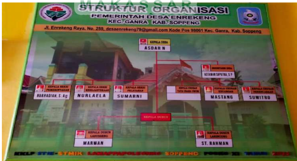
Gambar 1.2. Struktur Organisasi Desa Enrekeng