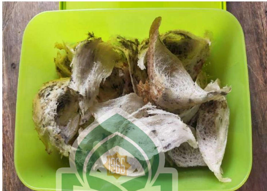
Gambar 2.6. Sarang Burung Walet

Sebagaimana penjelasan sebelumnya dikatakan bahwa zakat sarang burung walet dianalogikan dengan zakat pertanian dan zakat perdagangan. Di nisabkan dengan zakat pertanian karena bersifat menunggu hasil, maka nisabnya tersebut 300 \times 4.8 \text{ ratl Mesir} = 1440 \text{ ratl} gandum. Dan bila dihitung dengan kilogram maka sama dengan 300 \times 2,176 \text{ kg gandum} = 652,8 atau kurang lebih 653 \text{ kg} . 64 Adapun harga beras saat ini mencapai Rp. 8.000, (delapan ribu rupiah) per kg maka nisab pertanian adalah 653 \text{ kg} \times \text{Rp. } 8.000,- (delapan ribu rupiah) = Rp. 5.244.000,- (lima juta dua ratus empat puluh empat ribu rupiah).