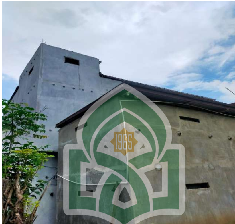
Gamba 2.1. Gedung Walet

Usaha sarang burung walet di Desa Enrekeng Kabupaten Soppeng merupakan usaha yang banyak diminati oleh kalangan masyarakat karena dianggap suatu usaha yang tidak sulit untuk dilakukan karena burung walet tidak di pelihara seperti halnya unggas lainnya yang perlu pengawasan setiap hari dan di perhatikan makannya, burung walet bersifat bebas ingin bersarang di tempat mana saja. Sehingga banyak masyarakat mendirikan bangunan sarang walet sebagai salah satu usaha sampingan mereka selain pertanian dalam memperoleh pendapatan tambahan dalam memenuhi kebutuhan sehari-harinya, yaitu dengan mendirikan bangunan tinggi yang di berikan beberapa lubang terbuat dari potongan pipa besar dan jendela terbuka sebagai bentuk pancingan burung walet masuk kedalam gedung dan bersarang. Kemudian di dalam bangunan tersebut sudah di pasangkan sepiker dengan suara burung walet dan membuat kolam yang berisikan air guna agar dalam bangunan menjadi lembab.