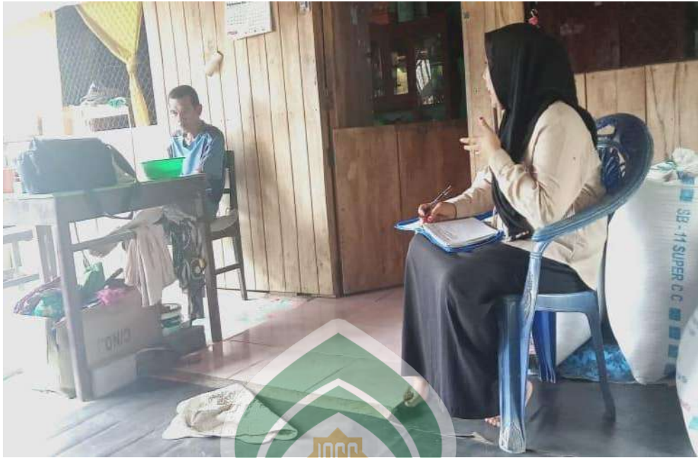
(Petani Burung Walet Tasse)