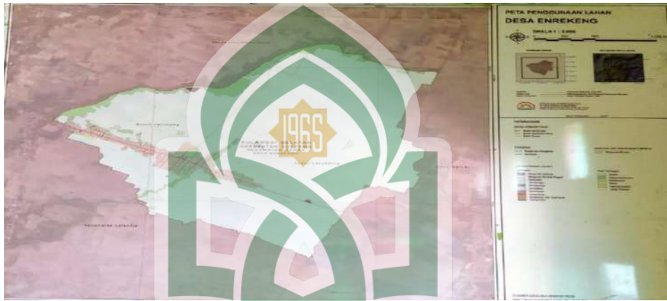
Gambar 1.1. Peta Desa Enrekeng

Peta dan struktur organisasi pemerintah Desa Enrekeng dapat dilihat dari gambar di bawah ini: