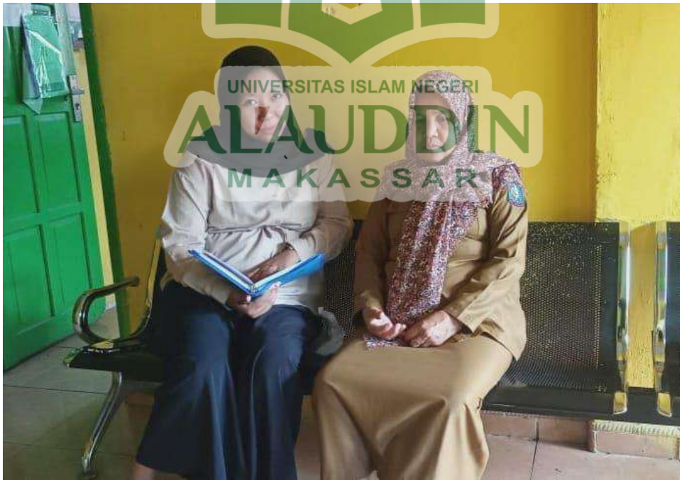
(Aparat Desa Enrekeng Nurhadia)