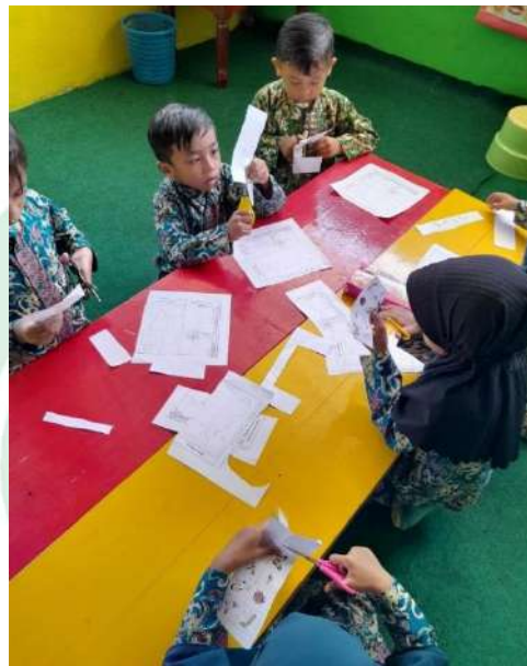
Gambar 4.3 Menggunting

Kegiatan menggunting dapat melatih kontrol gerakan tangan, koordinasi mata serta koordinasi mata dengan tangan. Dengan menggunting mampu menciptakan proses pembelajaran yang efektif, kreatif dan menyenangkan. Berdasarkan hasil observasi di TK Annisa Kec. Pattallassang Kab. Gowa. Terlihat bahwa pada saat kegiatan menggunting terlebih dahulu guru akan memastikan gunting yang digunakan anak sesuai dengan ukuran tangannya. Kemudian guru memberikan gambar atau garis yang akan diikuti atau pola yang akan dipotong. Selanjutnya memberikan instruksi mengenai teknik pemotongan yang tepat, seperti memotong sepanjang garis lurus atau mengikuti bentuk tertentu, guru juga memberikan contoh dan panduan langkah demi langkah untuk membantu anak