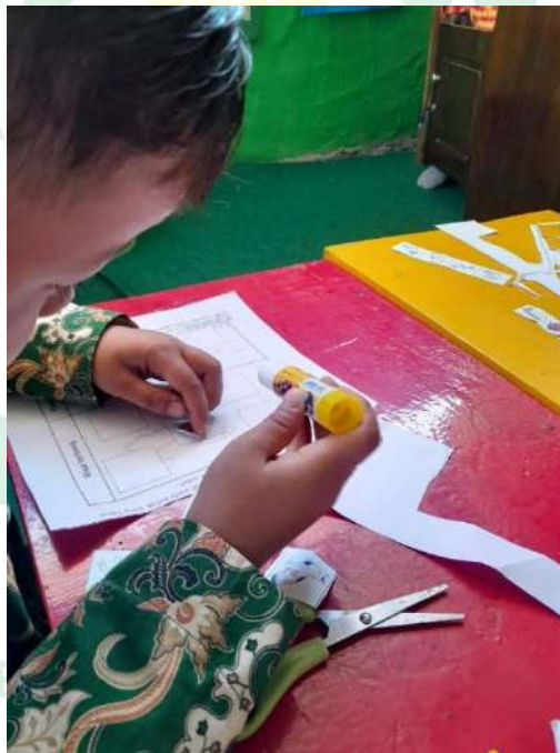
Gambar 4.4 Menempel (kolase)

Kegiatan menempel (kolase) ini dapat mengembangkan keterampilan motorik halus, koordinasi mata dengan tangan. Berdasarkan gambar diatas anak melakukan kegiatan menempel (kolase) pada bagian yang telah ditentukan oleh guru sebelumnya.