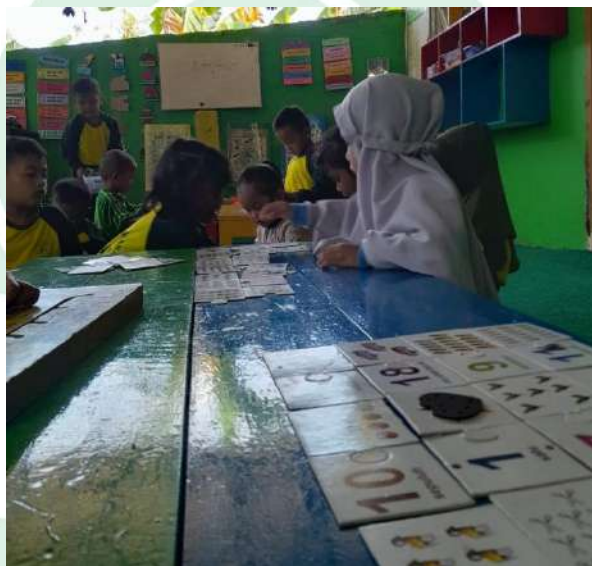
Gambar 4.2 Menyusun Puzzle (Dokumentasi TK Annisa 2023)

Dengan menyusun puzzle anak mengasah kemampuan dalam memecahkan masalah, meningkatkan daya ingat serta memperbaiki koordinasi tangan dan mata saat anak menata bagian-bagian kecil pada tempatnya. Berdasarkan gambar di atas, terlihat bahwa anak-anak akan diberikan mainan puzzle untuk berkreasi atau menghubungkan antara angka satu dengan angka seterusnya, serta diajak untuk mengumpulkan huruf sesuai dengan nama anak masing-masing. Ini memberi mereka kesempatan untuk berlatih memecahkan