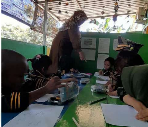
Gambar 4.1 Kegiatan Menggambar

Dalam kegiatan menggambar menggunakan pensil atau krayon, anak-anak dapat melatih koordinasi mata dan tangan mereka. Dengan memegang pensil atau krayon dan menggerakannya di atas kertas, anak-anak belajar mengontrol gerakan tangan mereka untuk menciptakan bentuk dan garis yang diinginkan, sementara mata mereka mengikuti pergerakan alat tulis tersebut. Ini membantu meningkatkan ketepatan dan gerakan tangan serta memperkuat koordinasi antara mata dan tangan anak-anak. Berdasarkan hasil observasi di TK Annisa di Kec. Pattallassang, Kab. Gowa, terlihat bahwa guru di TK Annisa tersebut secara aktif memanfaatkan kegiatan menggambar sebagai cara untuk meningkatkan keterampilan motorik halus anak-anak. Dalam kegiatan pembelajaran tersebut, guru memberikan stimulasi bagi anak-anak untuk melatih cara mereka memegang pensil atau krayon dengan benar dan mengarahkannya dengan tepat di atas kertas. Guru juga memberikan arahan tentang bagaimana mengikuti panduan atau pola