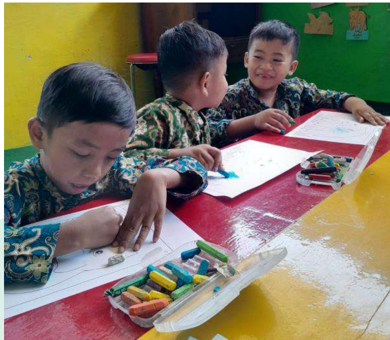
Gambar 4.4 Mewarnai

Dalam kegiatan mewarnai, anak dapat melatih koordinasi antara tangan dan mata mereka sambil juga mengembangkan kreativitas mereka. Proses mewarnai tidak hanya sekedar memberikan hiburan, tetapi juga merupakan cara yang efektif untuk merangsang perkembangan motorik halus anak-anak. Selama kegiatan mewarnai, guru dapat memberikan instruksi kepada anak untuk mengisi gambar dengan warna-warna tertentu sesuai dengan arahan yang diberikan. Misalnya, guru bisa mengarahkan anak untuk menggunakan warna tertentu untuk mengisi bagian-bagian yang berbeda dalam gambar, sehingga anak harus memilah-milah warna dan menggunakan setiap warna dengan tepat sesuai