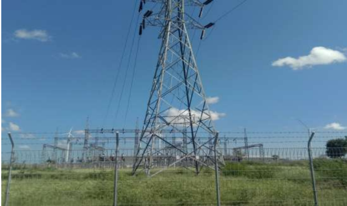
Pusan Listrik pada Pembangunan PLTB