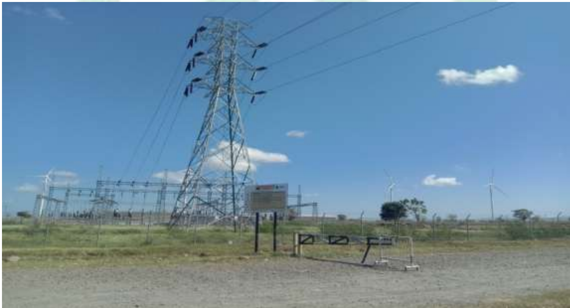
Kawasan Pembangunan PLTB