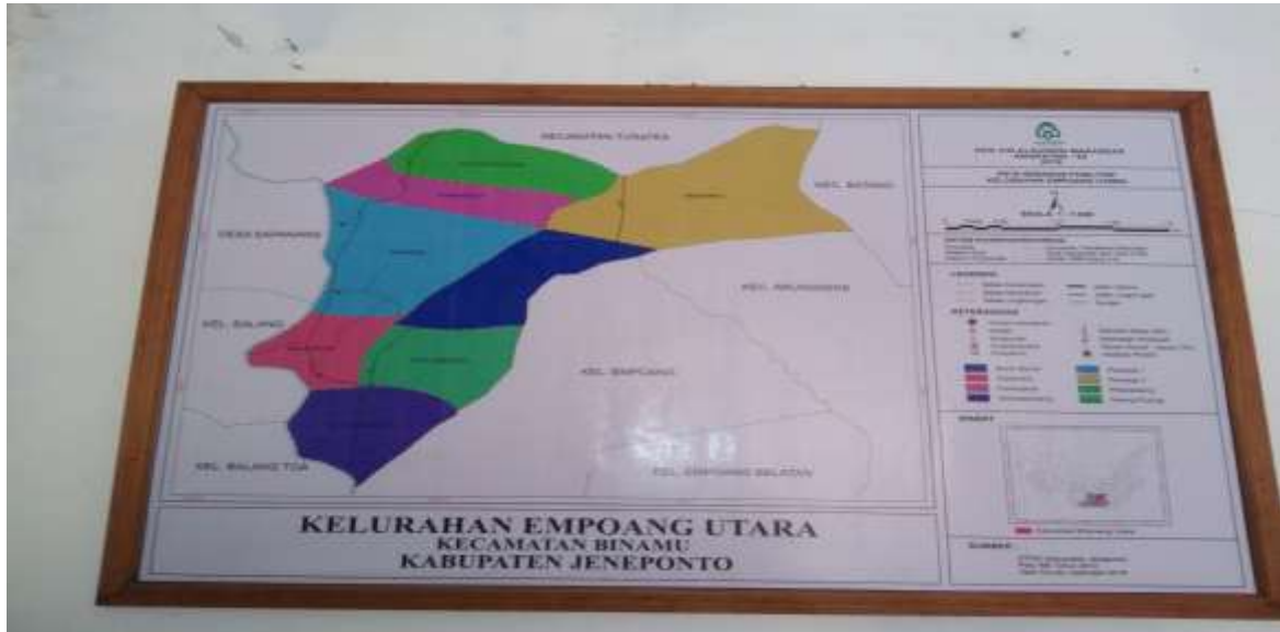
Foto Batas-Batas Wilayah Kelurahan Empoang Utara Kecamatan Binamu Kabupaten Jeneponyo