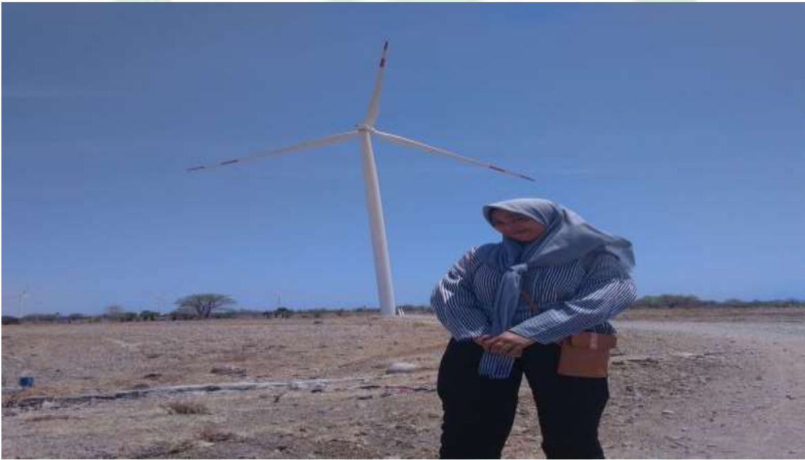
Foto di Wilayah Penelitian