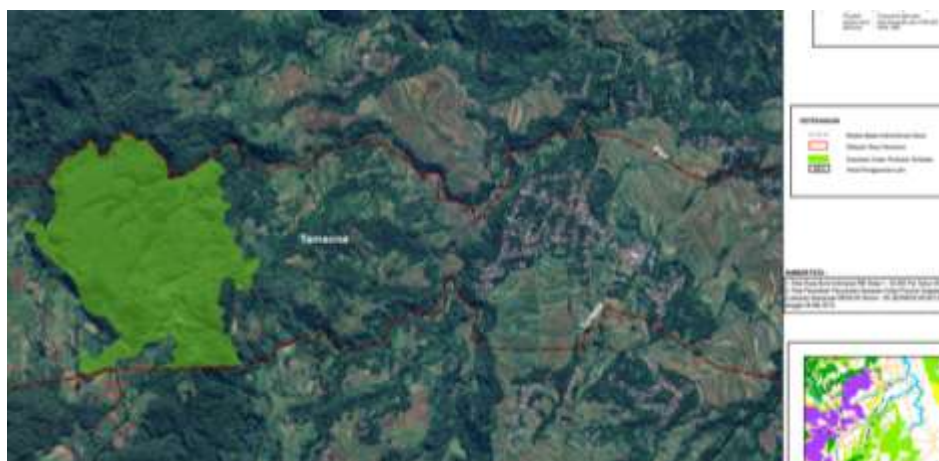
Gambar 1.1 Peta Kelurahan Tamaona

Pembebasan lahan terkait dengan masyarakat yang tinggal didaerah hutan lindung harus sesuai dengan mekanisme sesuai dengan pernyataan dari Polisi hutan melalui wawancara yang dilakukan oleh penulis. Adapun gambaran terkait dengan luas hutan lindung dan luas daerah pemukiman Kelurahan Tamaona, yaitu: