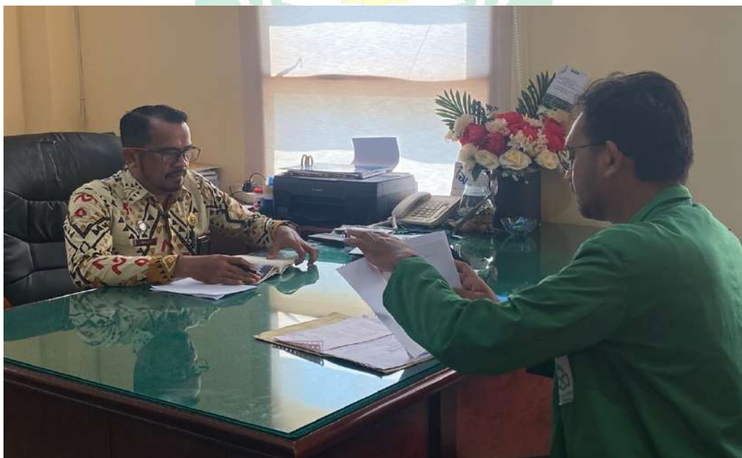
(Gambar 2, Dokumentasi wawancara dengan Panitera PA Makassar)