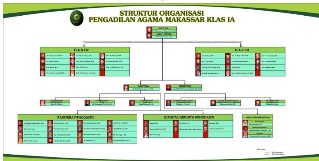
(Gambar 2, Struktur Pegawai Pengadilan Agama Kelas IA Makassar)

Struktur pegawai dalam Pengadilan Agama Kelas IA Makassar bulan Desember tahun 2023 sebagai berikut: