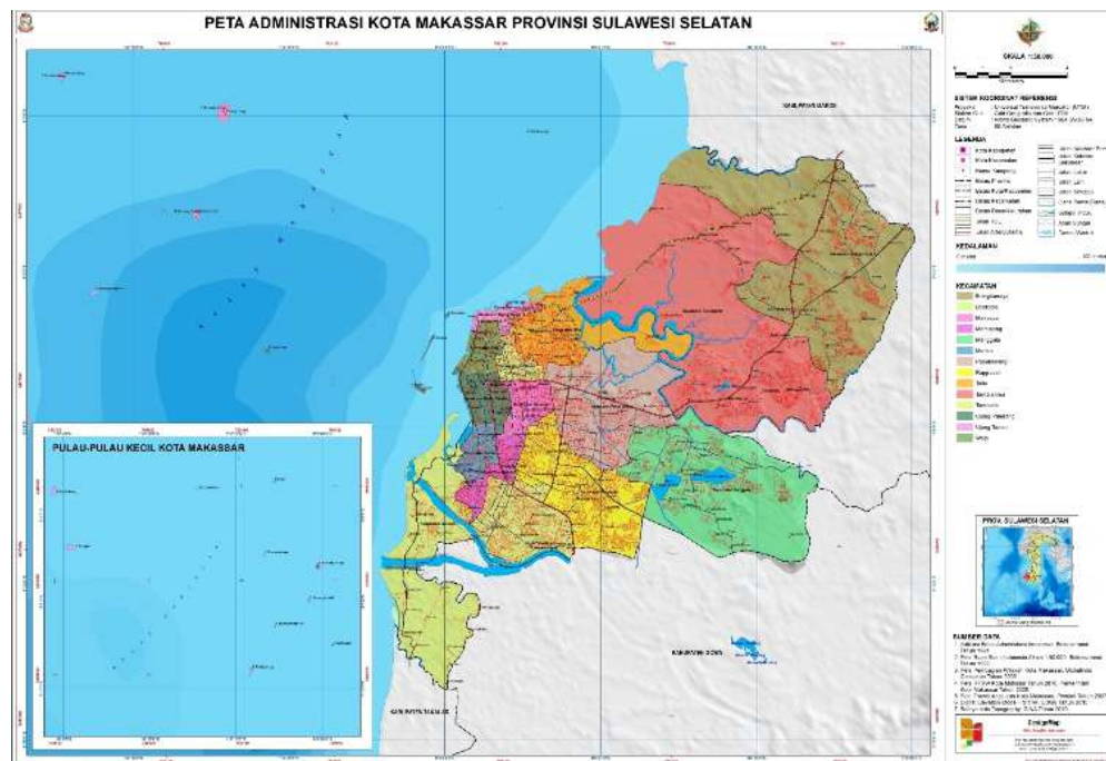
(Gambar 1, Peta Wilayah Yurisdiksi PA Makassar)

Berikut dibawah ini terlampir peta yang juga menjadi yurisdiksi atau kewenangan Pengadilan Agama Kelas IA Kota Makassar, sebagai berikut: