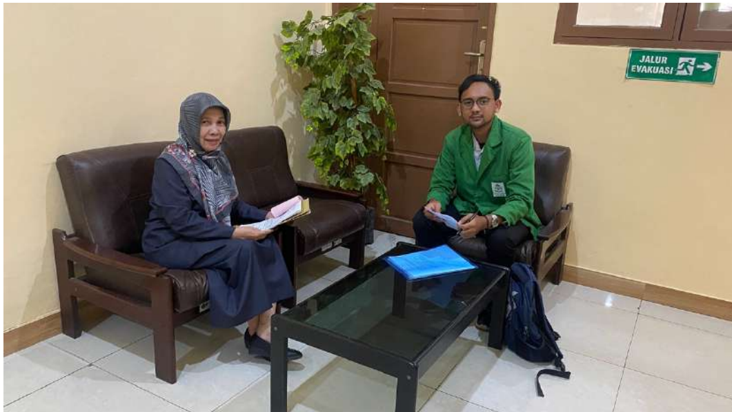
(Gambar 1, Dokumentasi wawancara dengan Ibu Hakim PA Makassar)