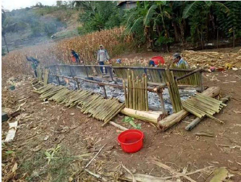
Gambar 7. Lemmang yang telah matang setelah dibakar