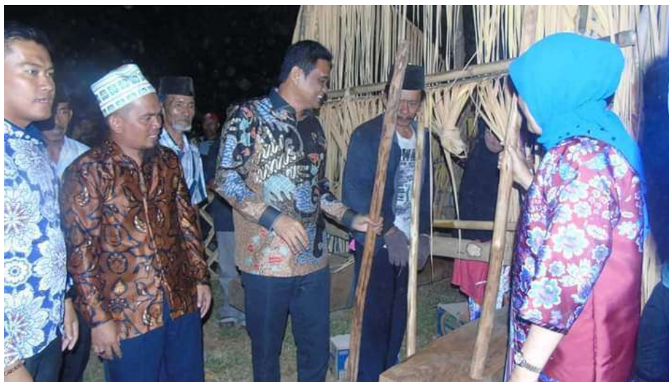
Gambar 8. Lokasi Mappadandang , terlihat Bupati Barru bersama warga yang akan memainkan musik Mappadandang