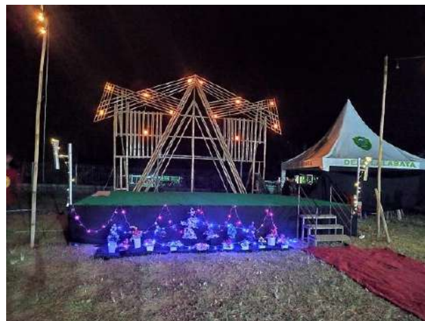
Gambar 5. Panggung acara Mappadendang