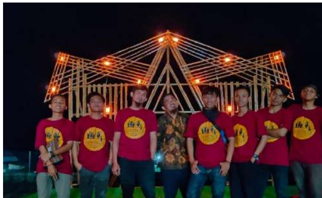
Gambar 4. Panitia Acara Mappadendang