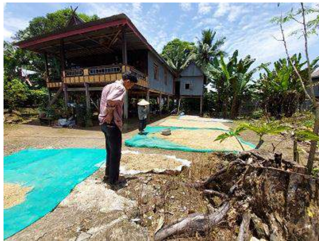
Gambar 2. Padi persiapan membuat Lemmang dan ditumbuk pada Mappadandang