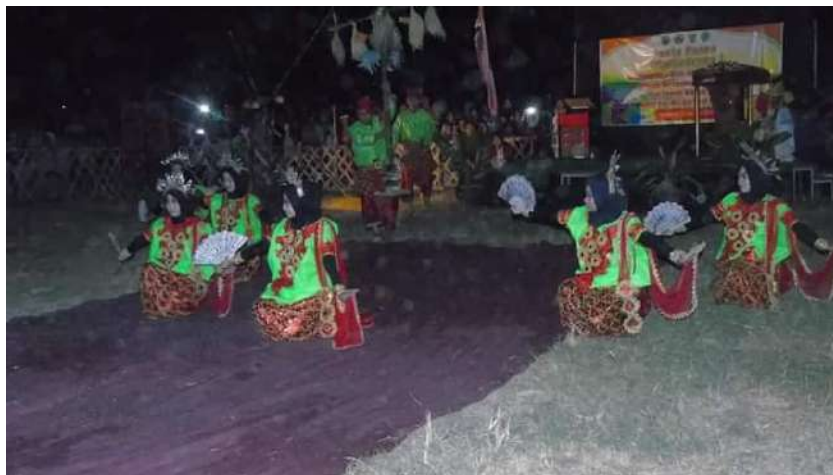
Gambar 7. Penari pada acara pembukaan Mappadendang