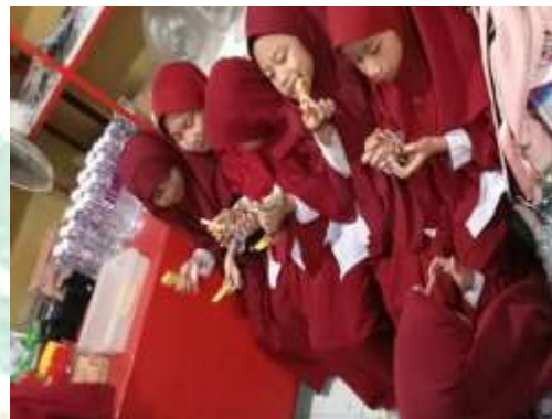
Peserta didik membiasakan diri makan dan minum sambil duduk