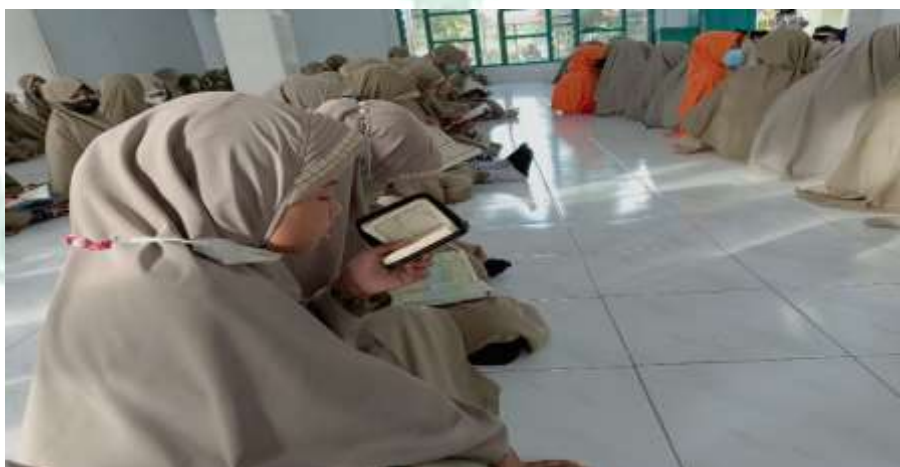
Peserta Didik mengaji sebelum memulai pelajaran di kelas