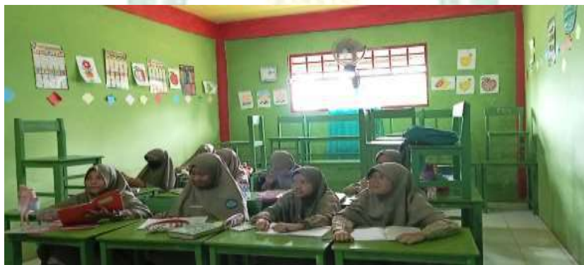
Peserta didik menyetorkan hafalan sebelum pemberian materi