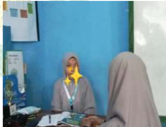
Wawancara dengan Pengajar TRANS kelas V