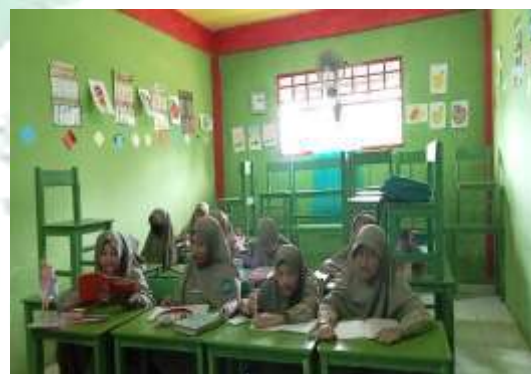
Peserta didik mendengarkan dan mencatat materi yang diberikan