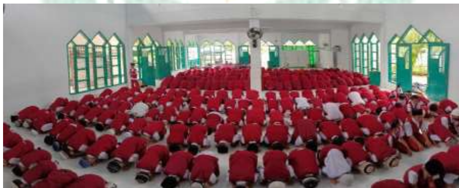
Peserta Didik Melaksanakan Sholat Dhuha Berjamaah