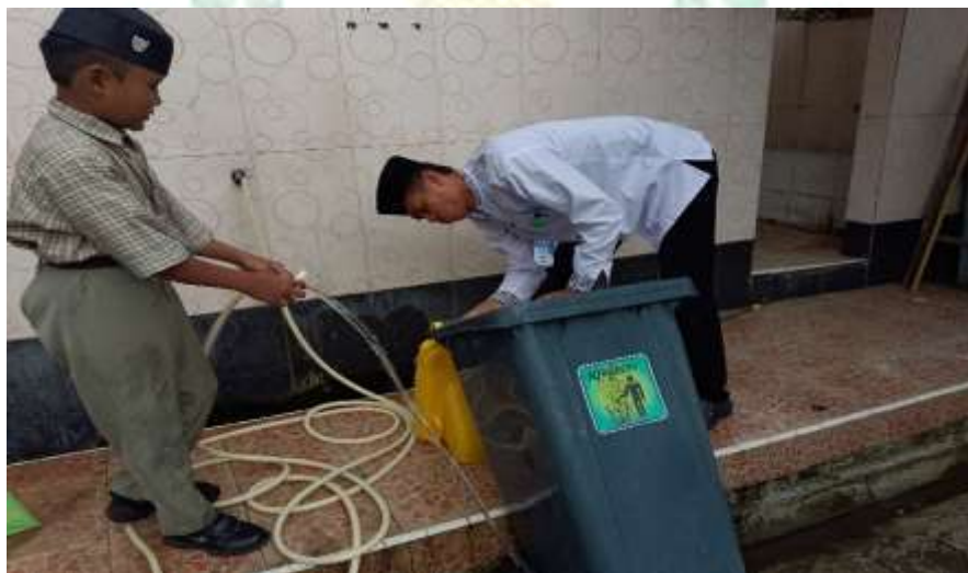
Kepala Sekolah bersama peserta didik membersihkan tempat sampah