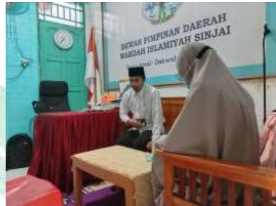
Wawancara dengan Bapak Kepala Sekolah dan Guru PAI