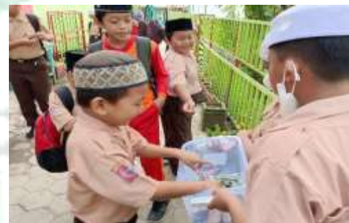
Peserta didik mengumpulkan sumbangan untuk membaantu salah satu peserta didik yang memerlukan uluran tangan karena sakit