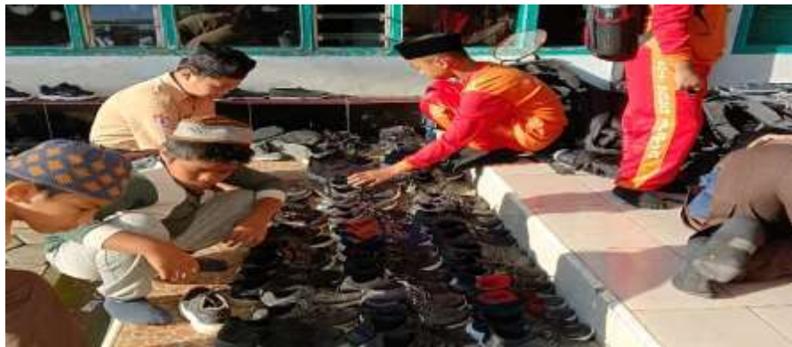
Peserta Didik dibiasakan merapikan sepatu sebelum masuk ke masjid