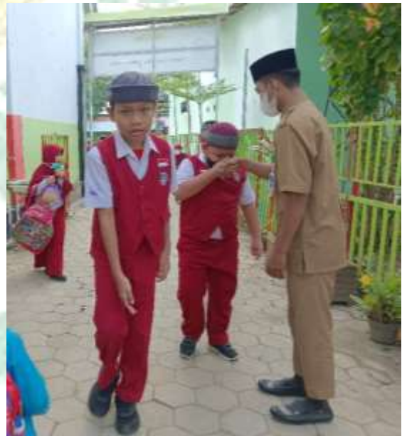
Peserta Didik Bersalaman dengan guru dan menunjukkan sikap ma'tabe ketika lewat di depan guru