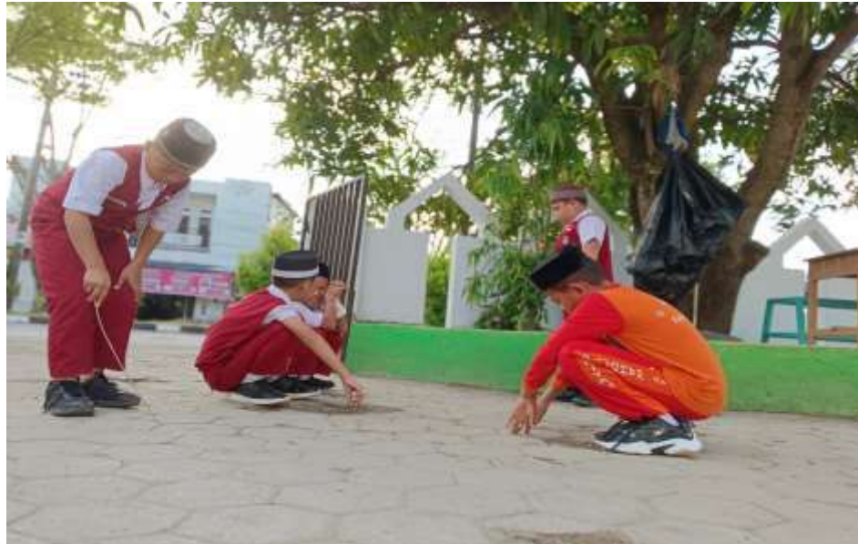
Peserta didik memungut sampah dan membuangnya di tempat sampah