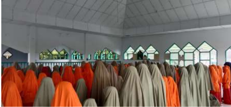
Peserta Didik Melakukan Sholat Zuhur Berjamaah