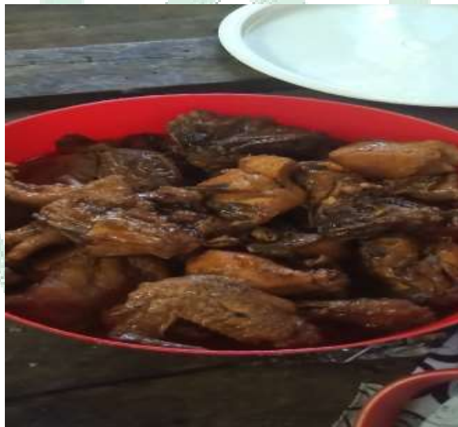
Gambar 1.2 ayam goreng