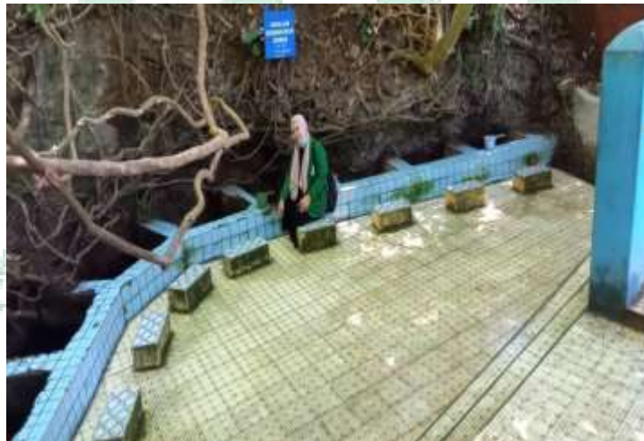
Gambar 4.1, Bungung Salapang

Dari kesimpulan kedua narasumber diatas bahwa sumur tersebut mempunyai ciri kas tersendiri dengan masing-masing sumur yang berukuran kecil telah memiliki khasiat yang berbeda, untuk menghilangkan rasa penasaran tentang airnya, sayapun mencoba air dari Sembilang Sumur itu, dan saya merasakan bahwa pada sumur bagian sebelah kiri memiliki khasiat pekat, pada bagian tengah memiliki khasiat lebih manis dan pada bagian kanan pojok memiliki khasiat keasam-asaman.