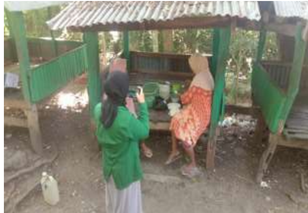
Gambar 4.3 Makan-makan Sumber Penelitian