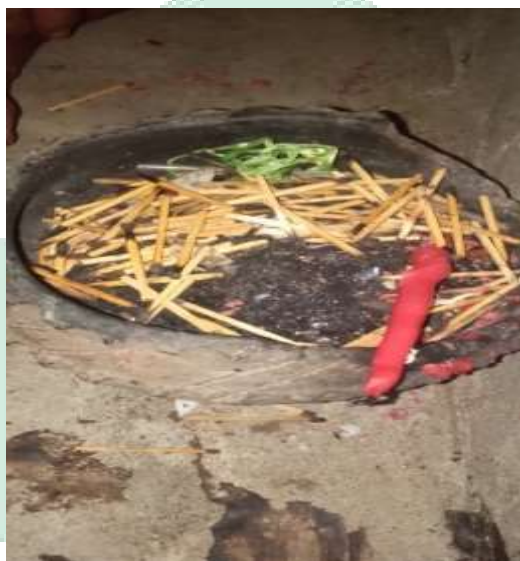
Gambar 3.1 Dupa Sumber Peneliti

Dupa ini adalah salah satu benda yang sering ada setiap tradisi, seperti halnya pada tradisi Allappassi Kana. Kemenyang ini digunakan sebagai simbol wewangiang yang biasa ditimbulkan dari asap Kemenyang. Orang yang berdoa atau yang mendoakan menggunakan asap dari Kemenyang selain sebagai simbol wangi-wangian, mereka juga mengharapkan bahwa doa yang dipanjatkan dapat mencakup semua bagian atau orang yang ada didalam ruangan.