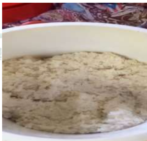
Gambar 1.1 songkolo