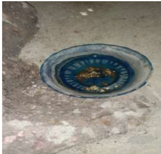
Gambar 3.3 Minyak Sumber Peneliti

Minyak ini digunakan ketika doa selesai dibacakan maka orang yang bernazar memakai minyak ini dengan cara mencelupkan jarinya kemudian meletakkan pada bagian kedua dahi dan bagian leher guna sebagai tanda syukurnya.