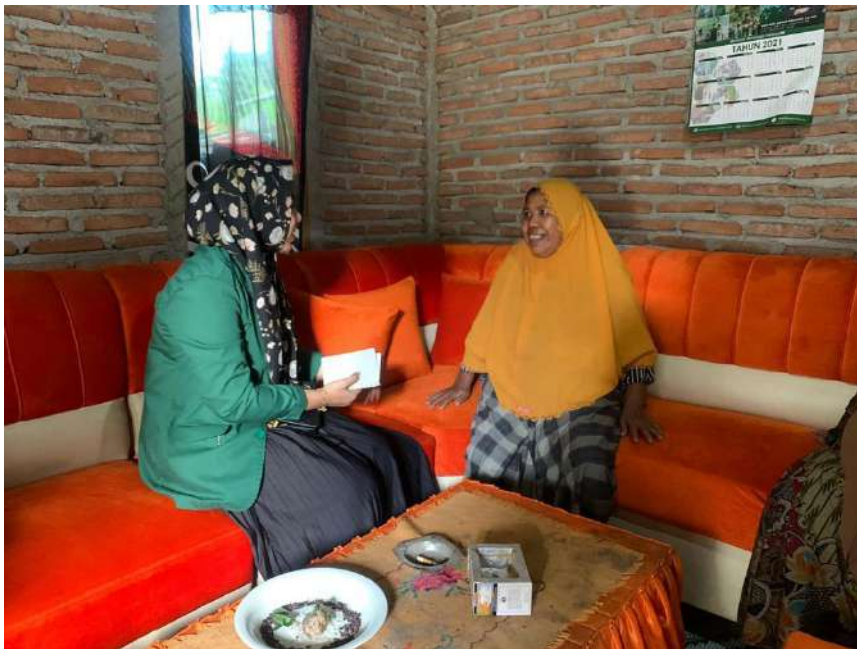
Wawancara dengan tokoh masyarakat