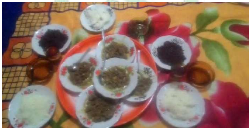
Dulang/Nampan yang berisi Sesajen