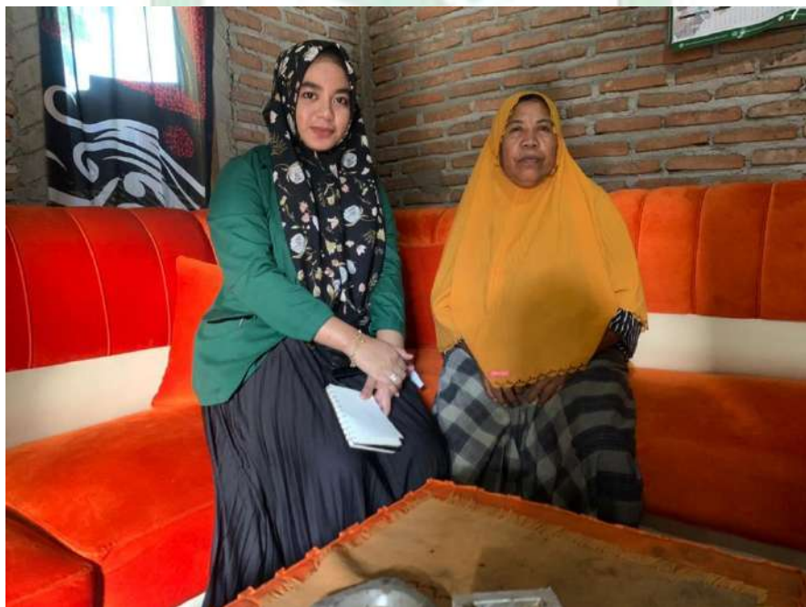
Wawancara dengan tokoh masyarakat