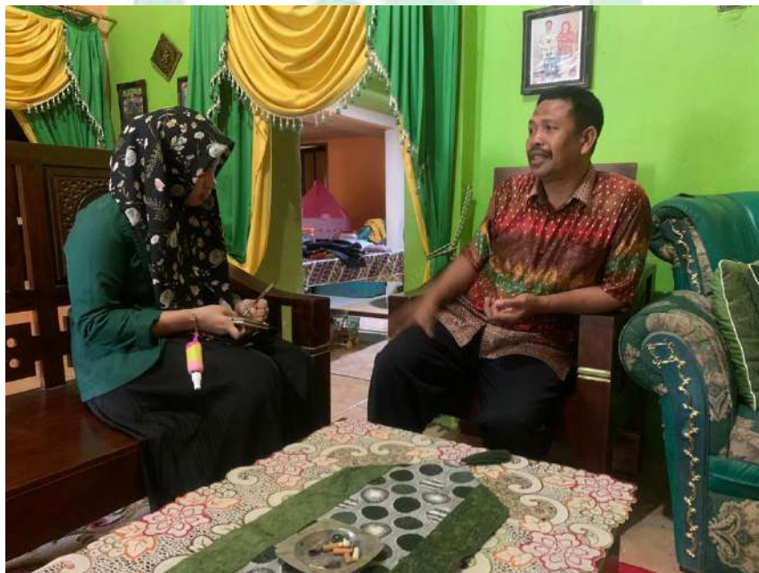
Wawancara dengan tokoh masyarakat