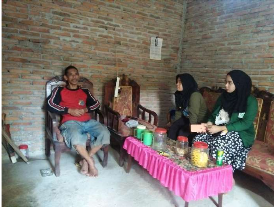
Wawancara dengan tokoh masyarakat