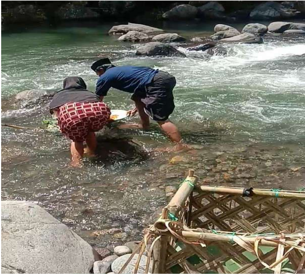
Masyarakat yang sedang melakukan Tradisi Mappasoro

UNIVERSITAS ISLAM Negeri ALAUDDIN M A K A S S A R I