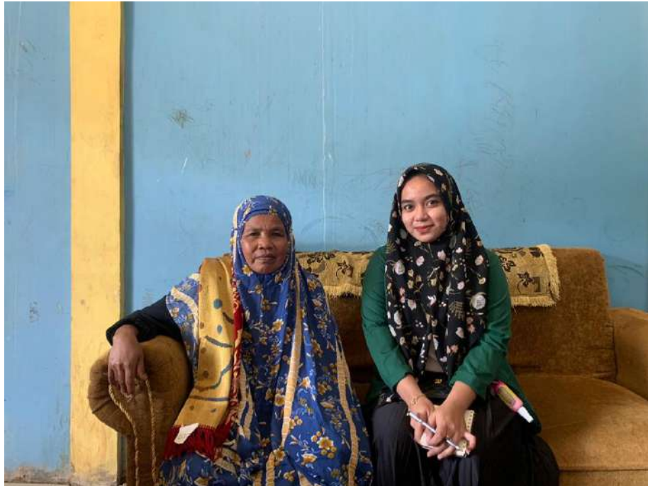
Wawancara dengan tokoh masyarakat