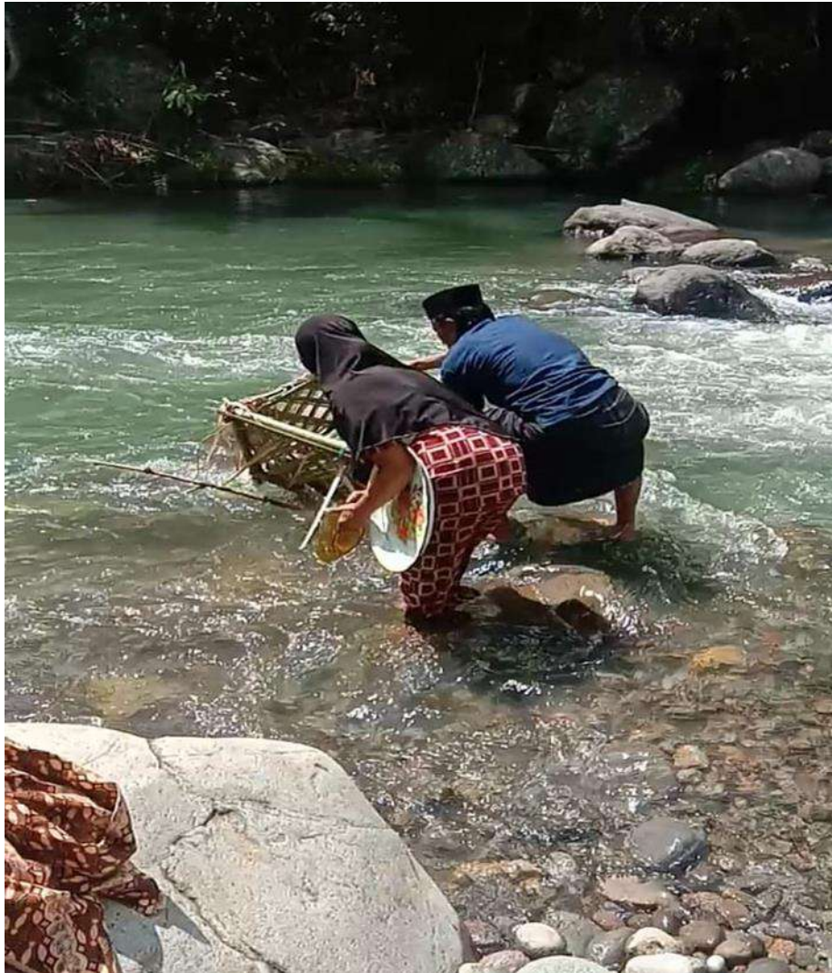
Masyarakat yang sedang melakukan Tradisi Mappasoro dengan melepas Panca yang berisi sesajian