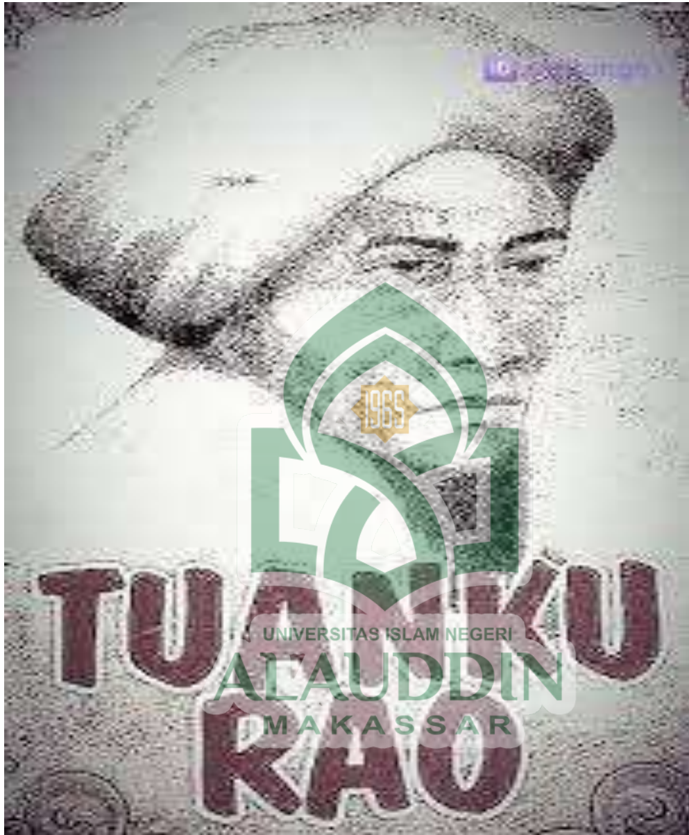
Lampiran III: Gambar Tuanku Rao