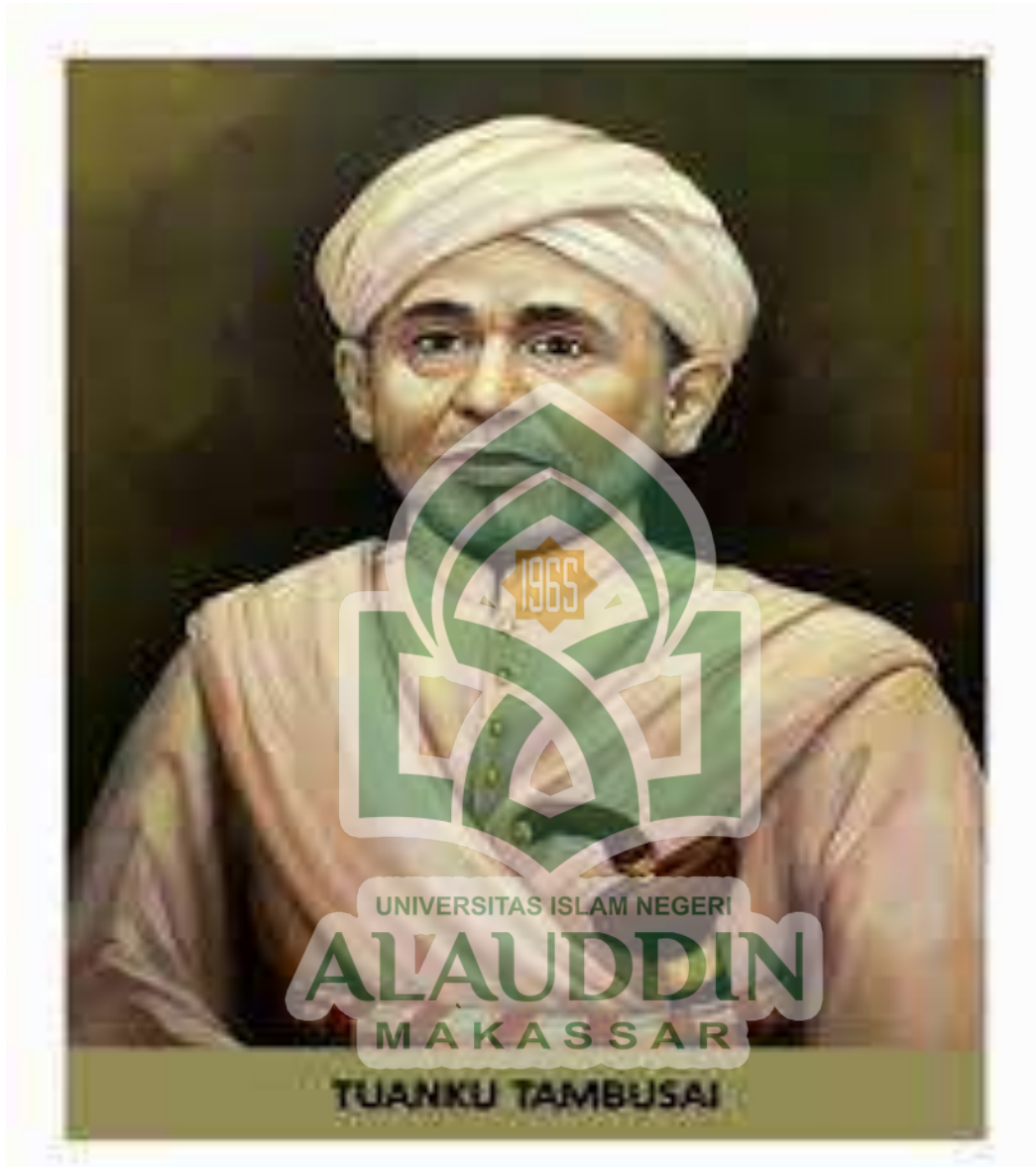
Lampiran V: Gambar Tuanku Tambusai