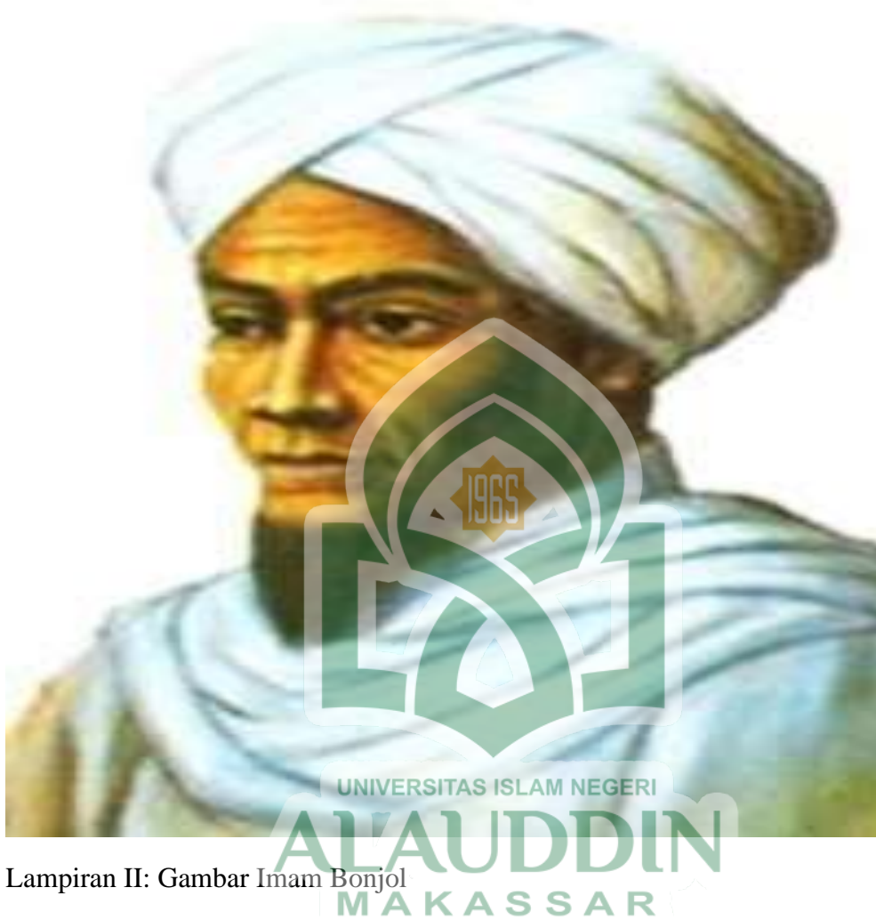
Lampiran II: Gambar Imam Bonjol