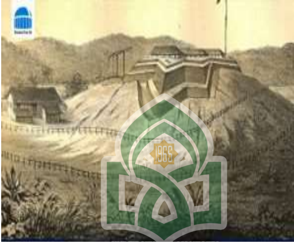
Lampiran I: Gambar Benteng Imam Bonjol