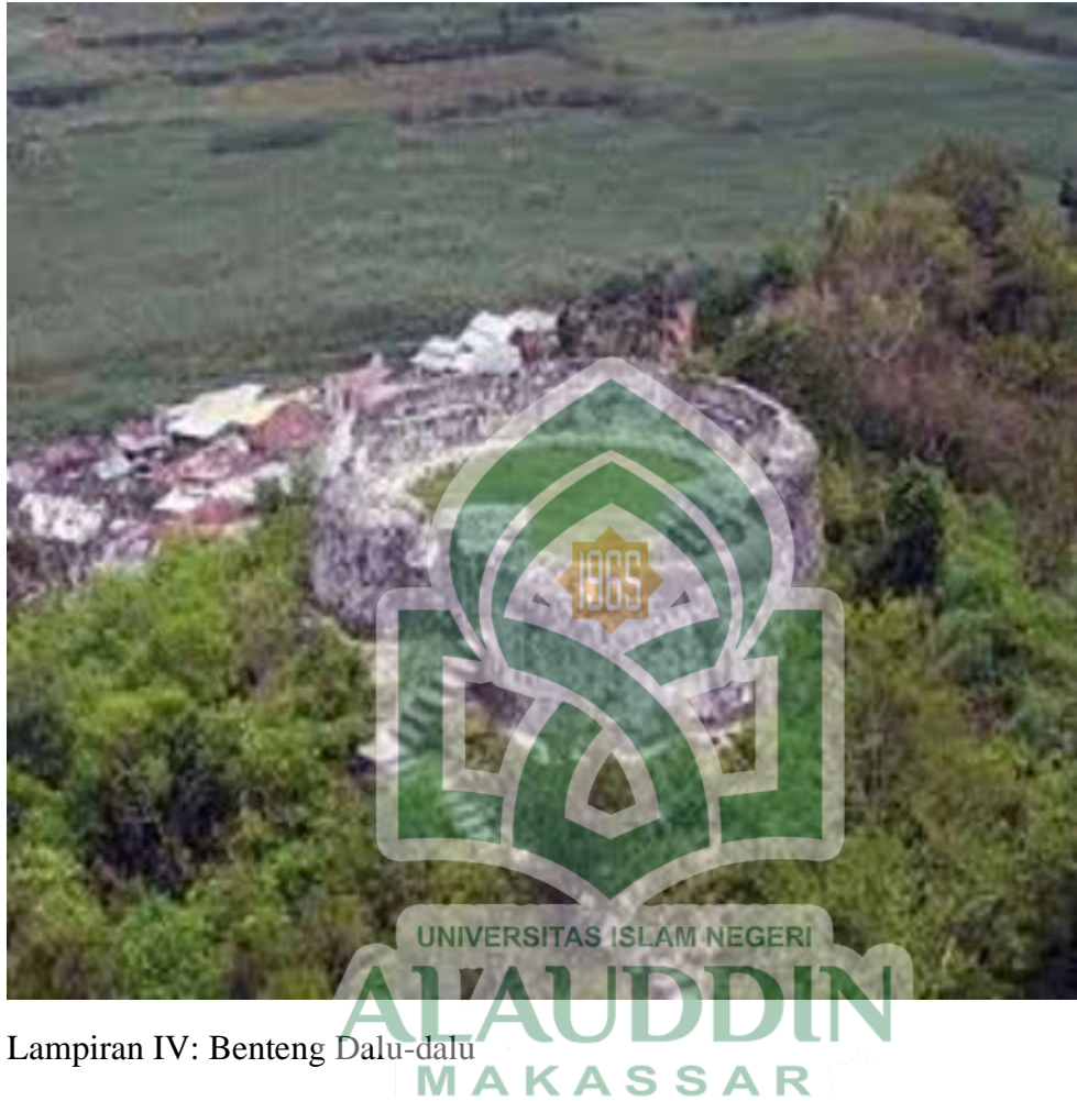
Lampiran IV: Benteng Dalu-dalu