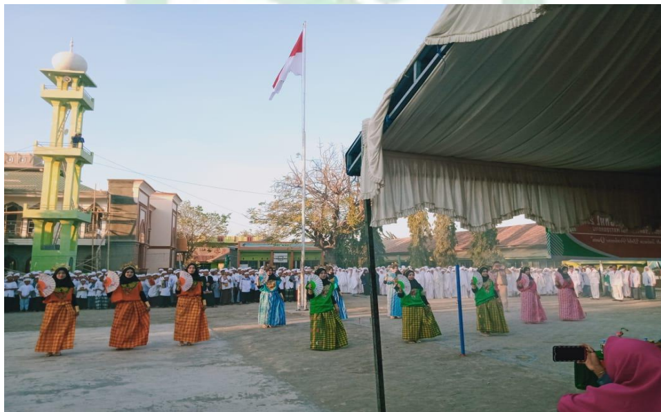
Gambar 14. Penampilan tari dari santriwati Pondok Pesantren DDI Mattoanging Bantaeng.