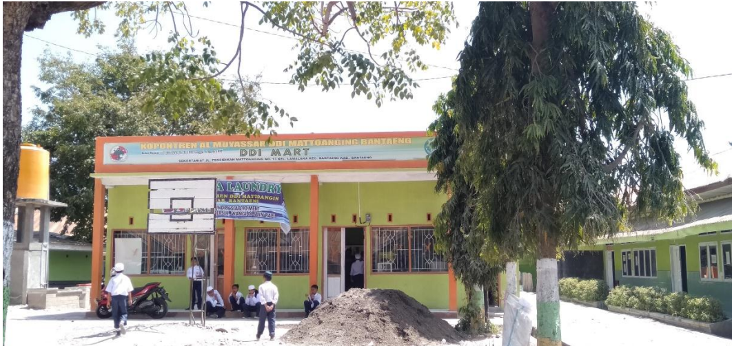
Gambar 7. Koperasi Al Muyassar DDI Mattonging Bantaeng