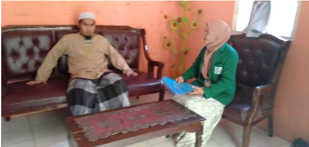
Gambar 9. Wawancara dengan Pimpinan Pondok Pesantren DDI Mattoanging Bantaeng