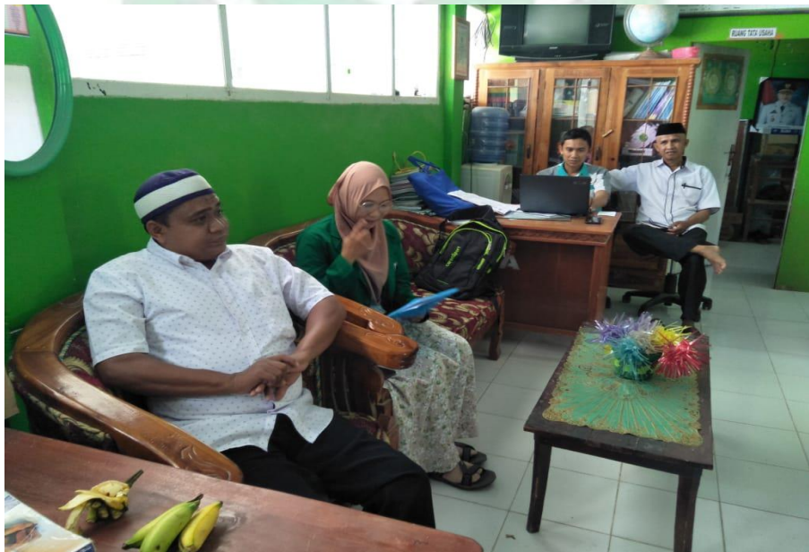
Gambar 10. Wawancara dengan sekretaris Pimpinan Pondok DDI Mattoanging Bantaeng