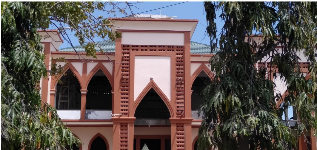
Gambar 8. Masjid Darul Fala DDI Mattoanging Bantaeng