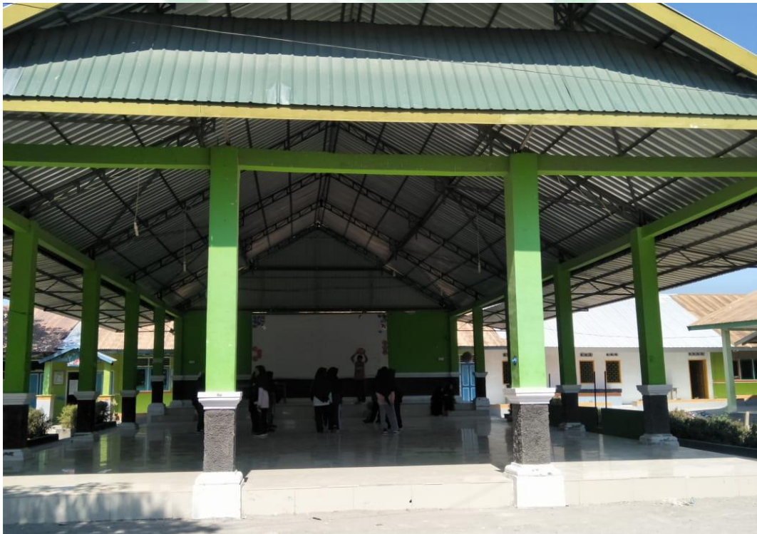
Gambar 6. Aulah Pesantren DDI Mattoanging Banteng