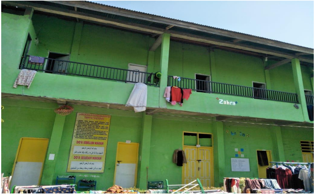
Gambar 5. Pondok Santriwati