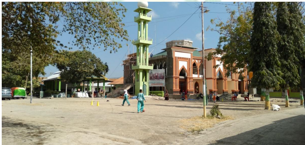
Gambar 2. Keadaan lingkungan Pondok Pesantren DDI Mattoanging Bantaeng.