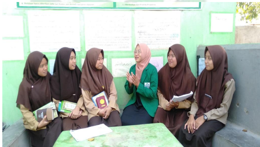
Gambar 12. Wawancara dengan santriwati Pondok Pesantren DDI Mattoanging Bantaeng.