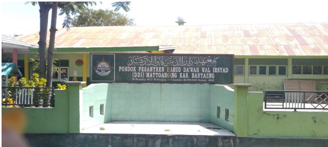
Gambar 1. Bagian depan Pondok Pesantren DDI Mattoanging Bantaeng.