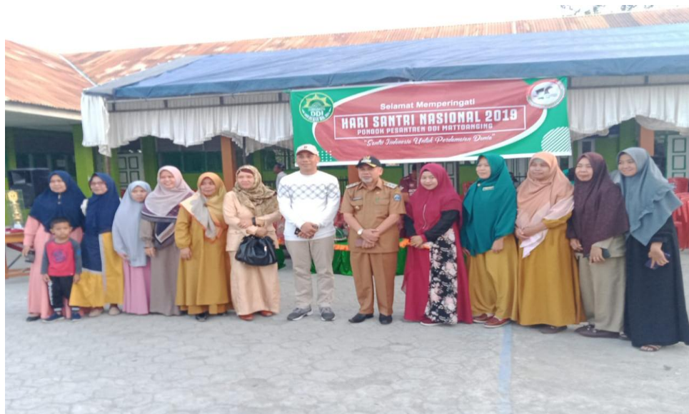
Gambar 15. Foto bersama wakil bupati Bantaeng