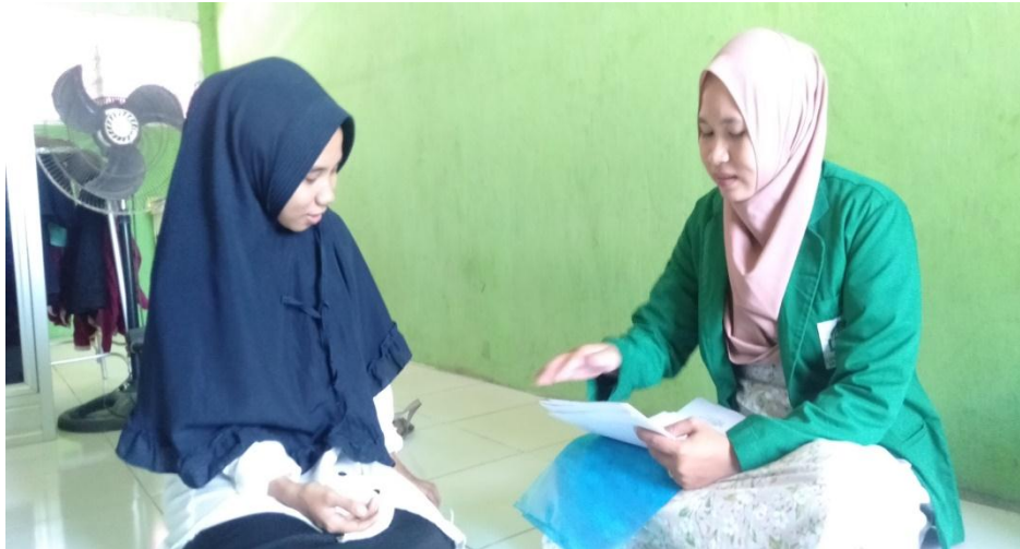
Gambar 11. Wawancara dengan pembina Pondok Pesantren DDI Mattoanging Bantaeng.