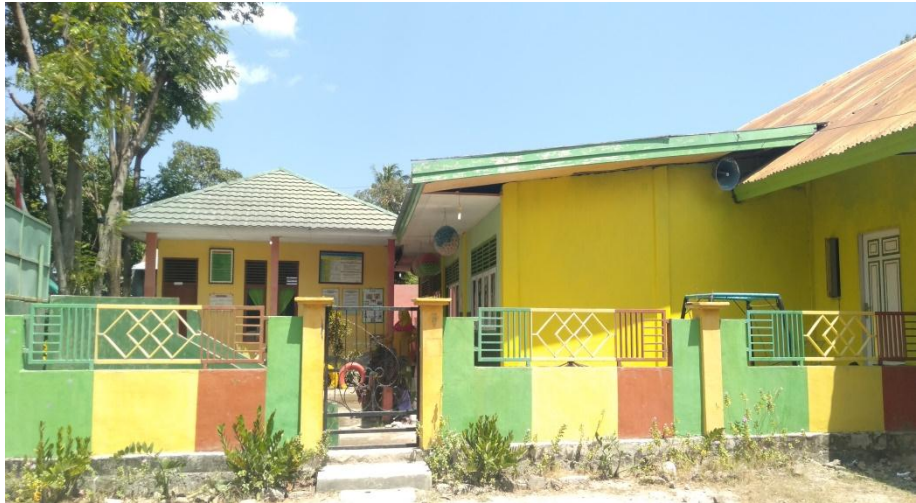
Gambar 3. Sekolah TK Pondok Pesantren DDI Mattoanging Bantaeng.