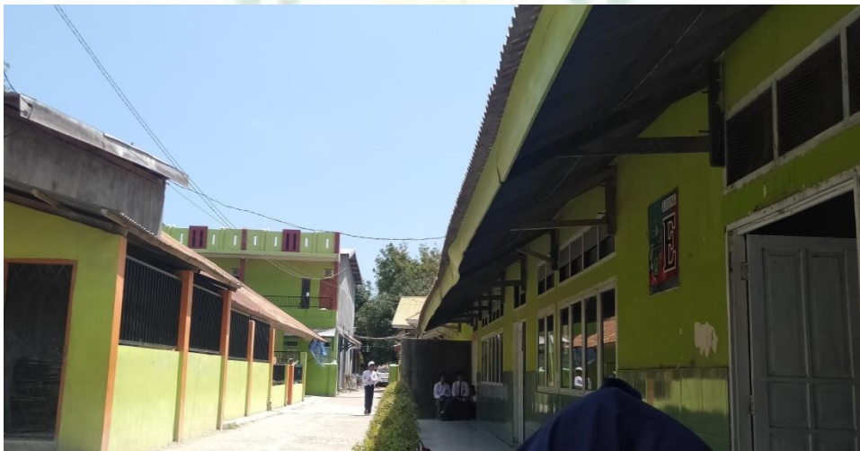
Gambar 4. Kamar santri