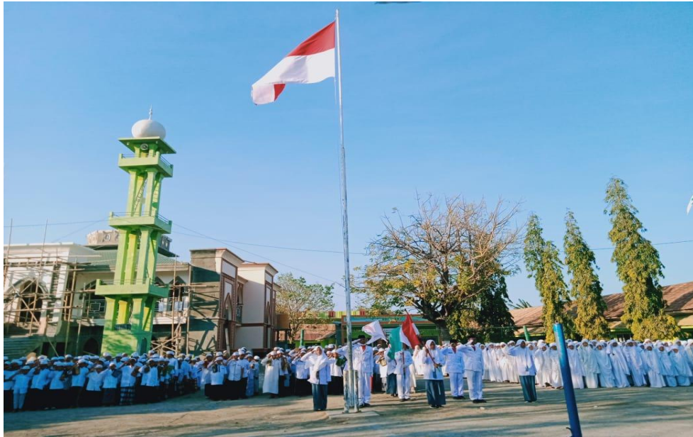
Gambar 13. Kegiatan menyambut hari santri nasional