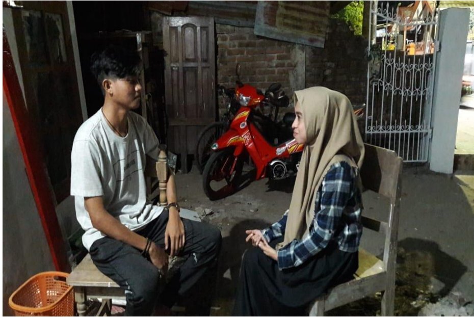
Wawancara bersama Remaja Hakiki ( 22 thn )