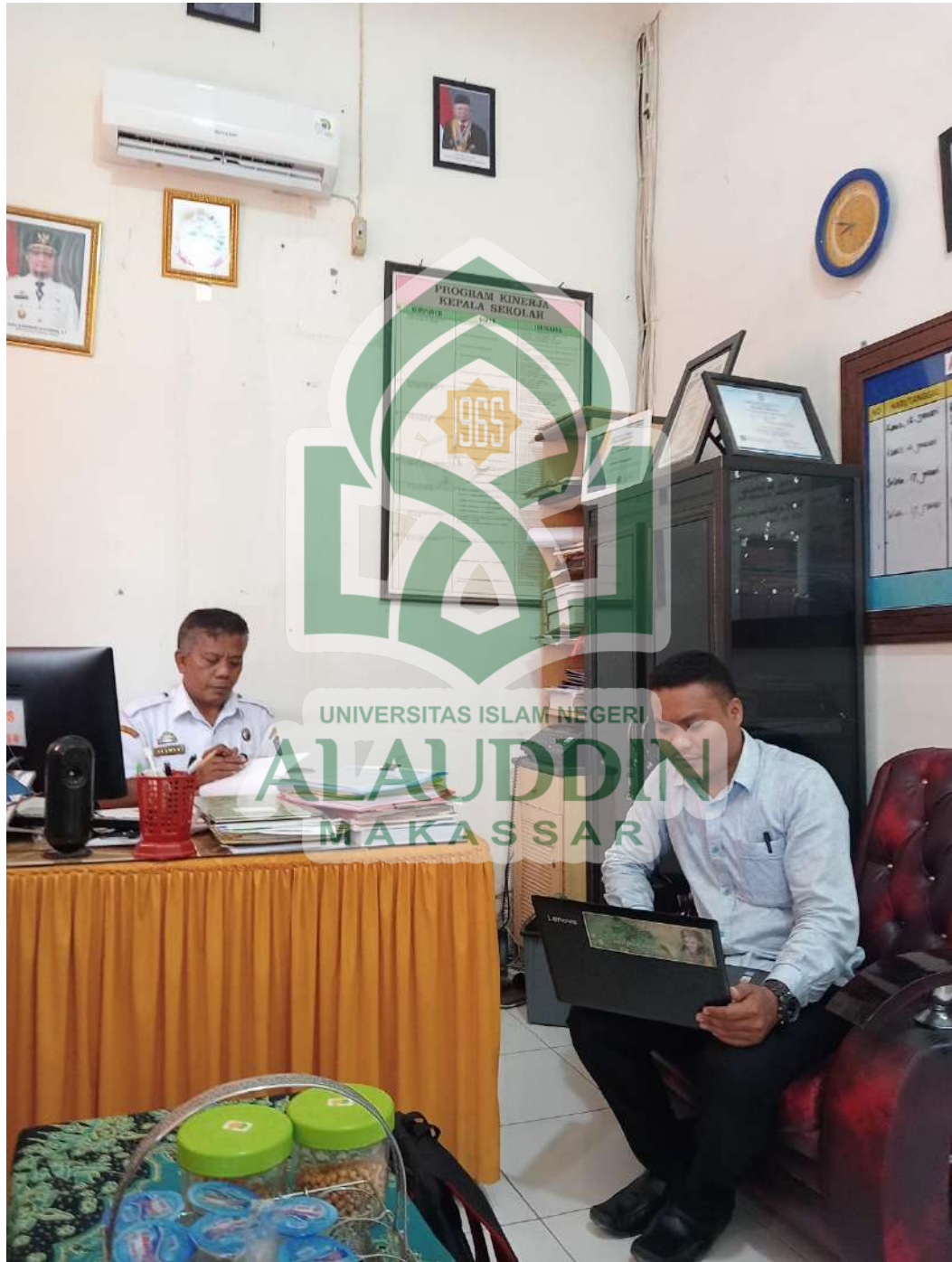
Gambar 1. Wawancara dengan Kepala Sekolah SMAN 8 Bulukumba

memberikan peluang yang besar kepada SMAN 8 Bulukumba untuk mengembangkan nilai tersebut