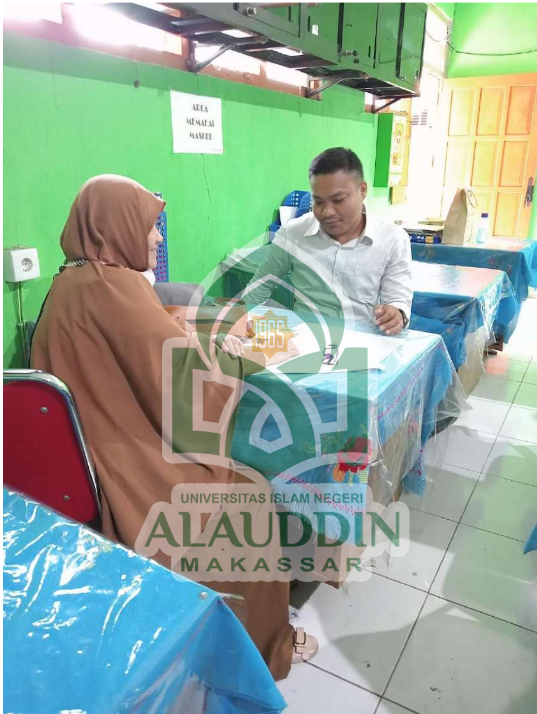
Gambar 3. Wawancara dengan Guru PAI SMAN 8 Bulukumba