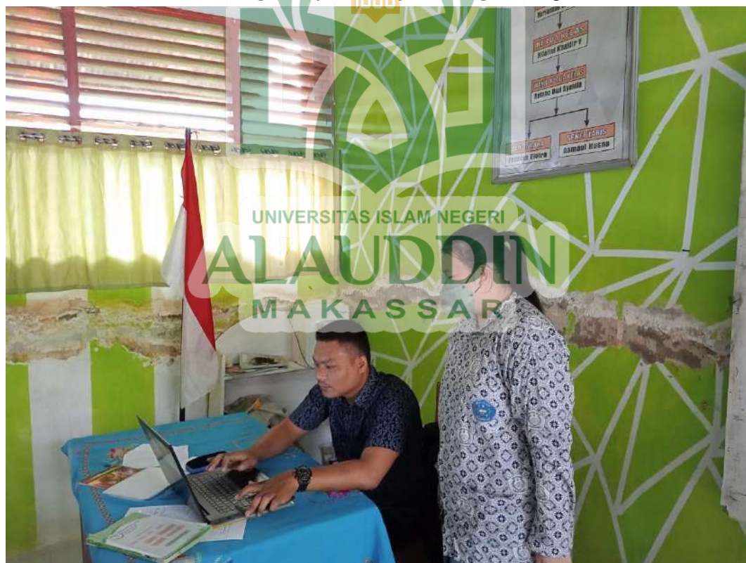
Gambar 4. Wawancara dengan peserta didik non muslim

Jawaban : Iya, karena guru mendengar semua pendapat peserta didik dan tidak membeda-bedakan apakah agama peserta didik tersebut muslim atau non muslim, semuanya disamaratakan. Serta mengingatkan peserta didik sesuai dengan keyakinannya masing-masing dalam beribadah