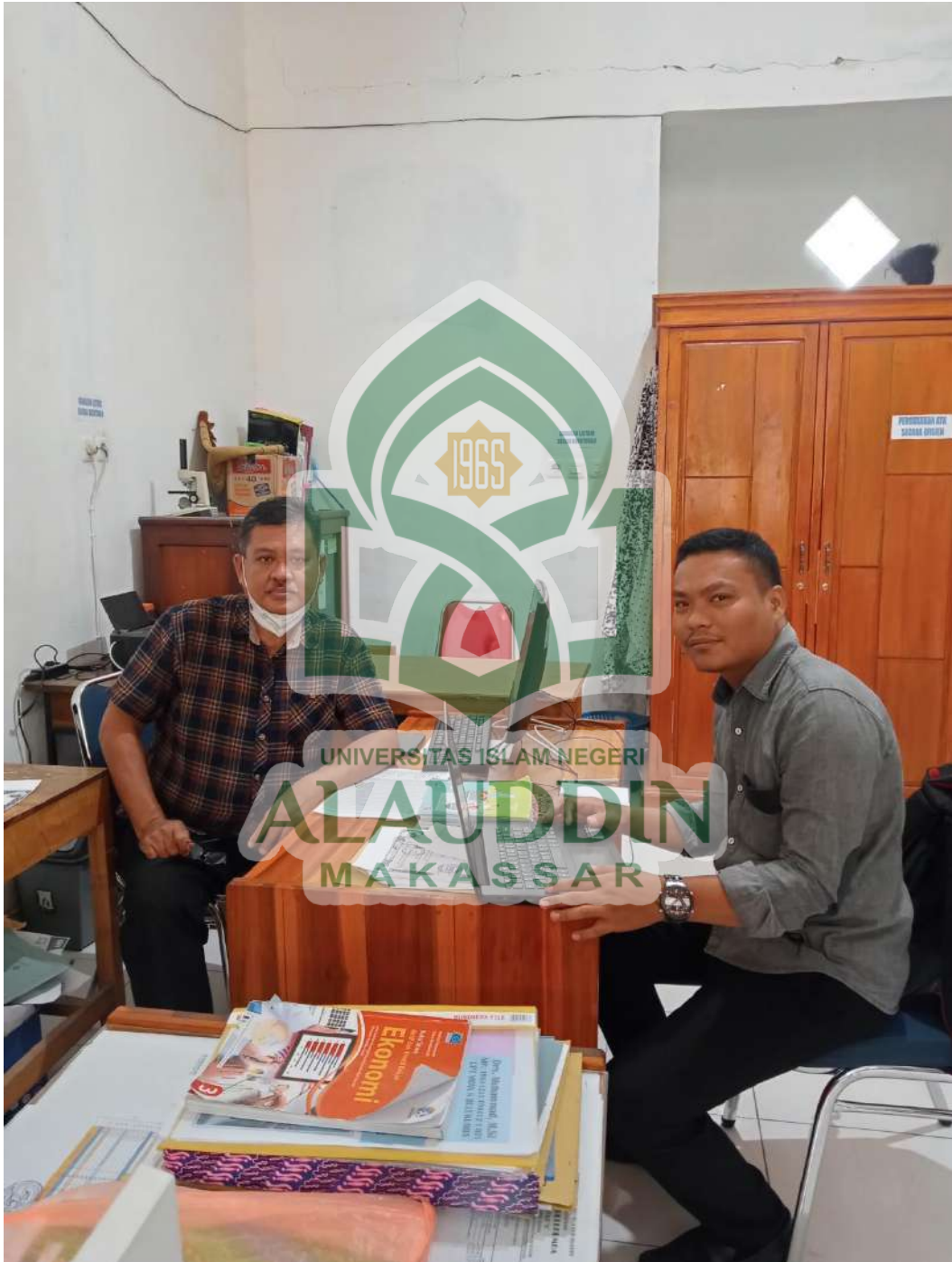
Gambar 2. Wawancara dengan wakil kepala sekolah SMAN 8 Bulukumba

Jawaban : Kehadiran 80% dari jumlah efektif ulangan semester, ulangan harian di tempat ibadah masing-masing dan setelah itu melapor ke sekolah untuk menginput data kelaporan pendidikan