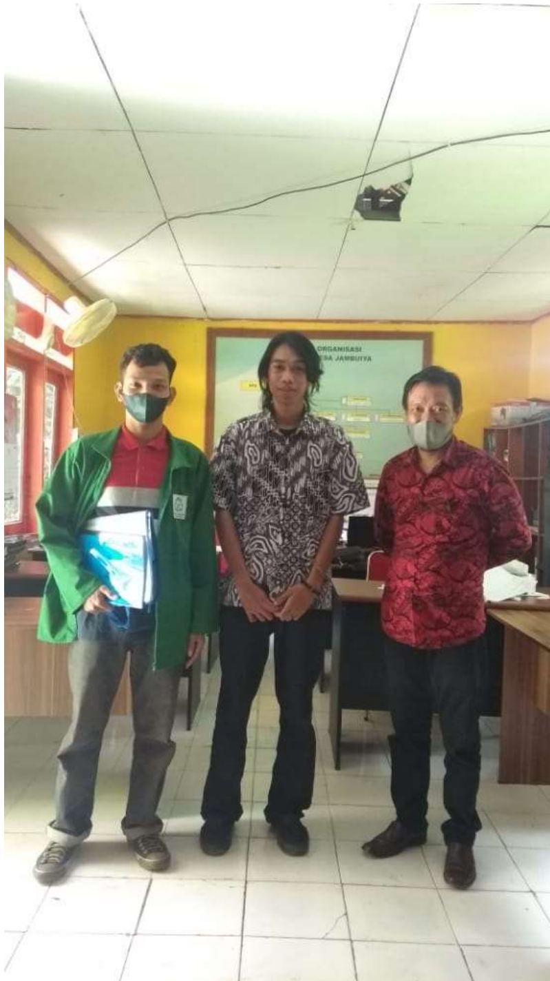
Bersama Sodara Takbir