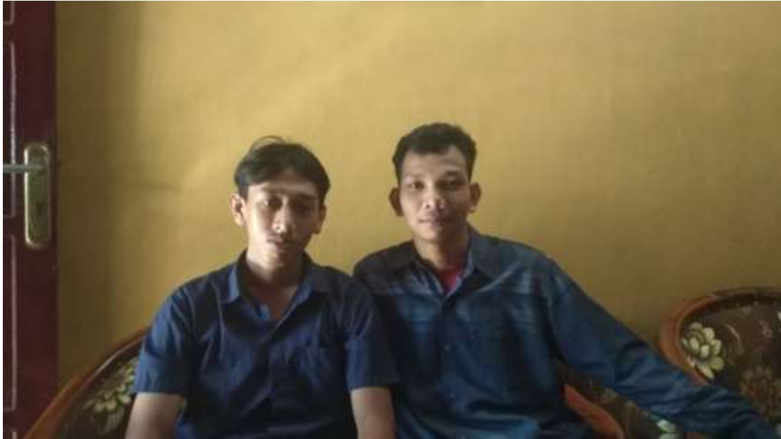
Bersama Hindar Cakra