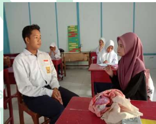
Wawancara terkait kedekatan antar peserta didik dengan guru Bahasa Arab