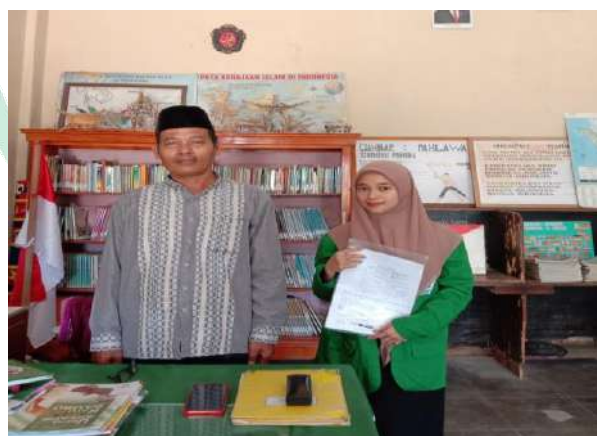
Foto bersama Guru bahasa Arab setelah wawancara