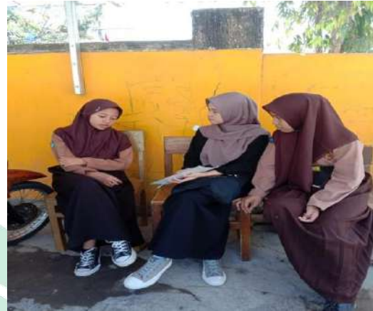
Wawancara terkait minat peserta terhadap pembelajaran Bahasa Arab