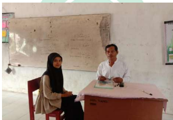
Wawancara dengan guru Bahasa Arab pada hari Sabtu, Tanggal 09-09-2023