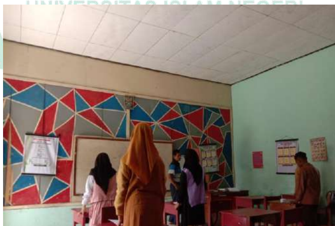
Suasana Proses Pembelajaran Kelas VII MTs. Yapis Polewali Mandar