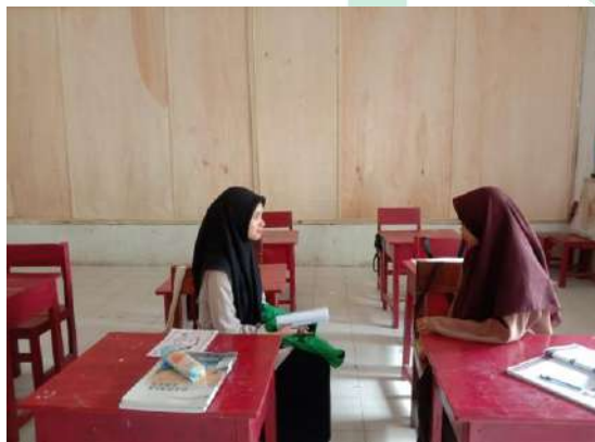
Wawancara terkait metode yang digunakan guru Bahasa Arab dalam mengajar