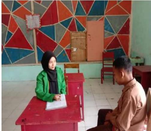
Wawancara dengan peserta didik terkait didik cara mengajar guru di kelas