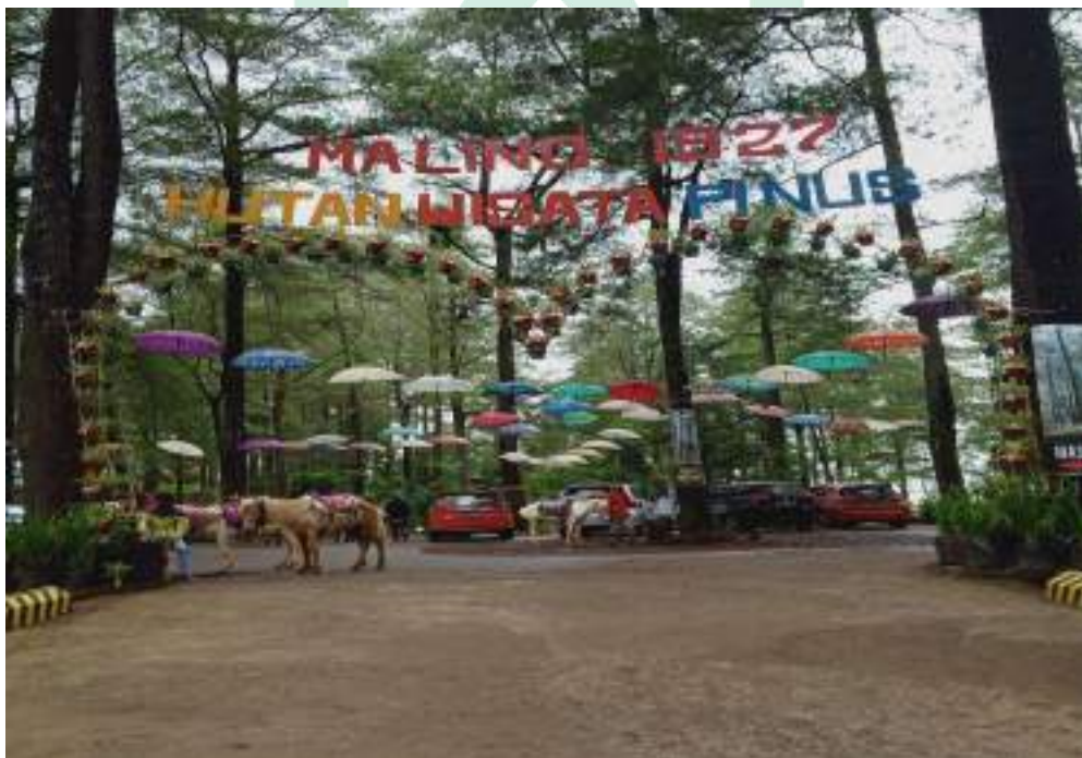
Gambar tentang Lokasi Wisata Hutan Pinus Malino (Tanggal 17-02-2021)