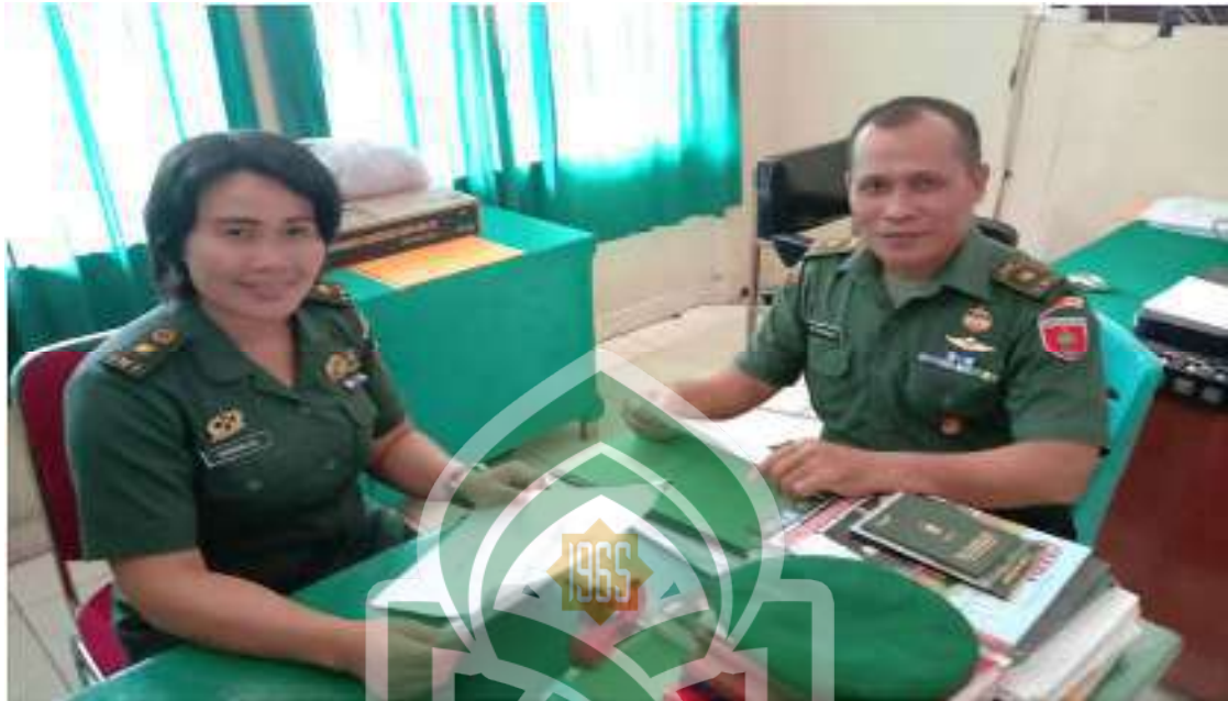
Dokumentasi wawancara dengan Mayor Chk (K) Nur Rahmi KS, SH, MH