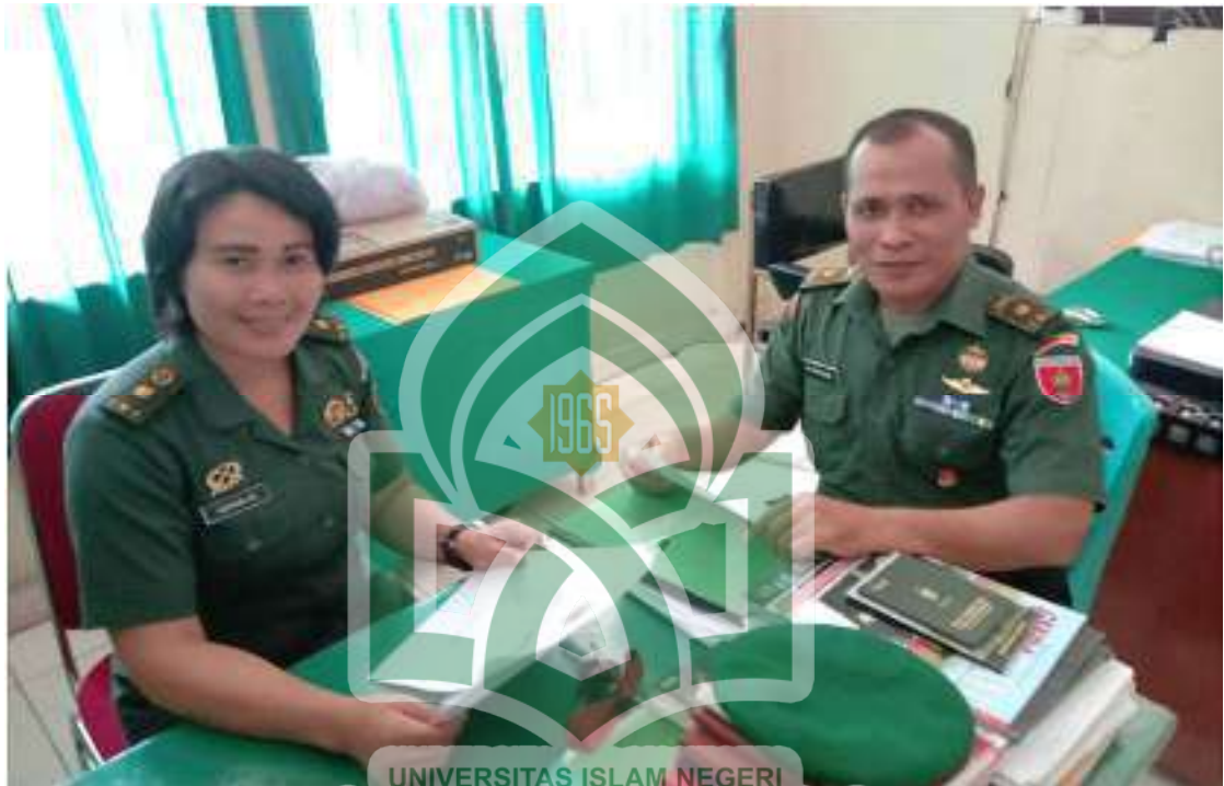
Dokumentasi wawancara dengan Mayor Chk (K) Nur Rahmi KS, SH, MH